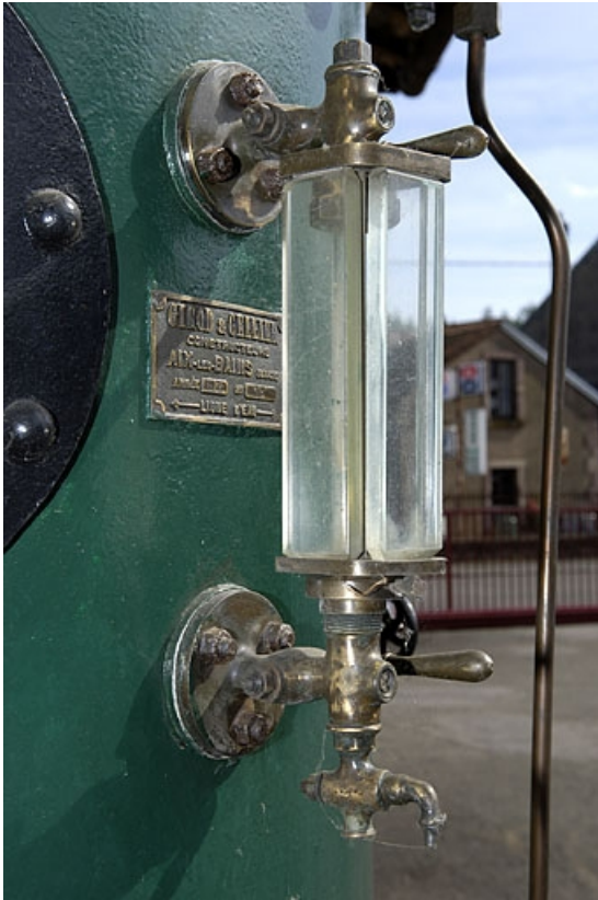
Alambic ambulant. Détail de la chaudière.

70, Raddon-et-Chapendu, 9 avenue du Breuchin