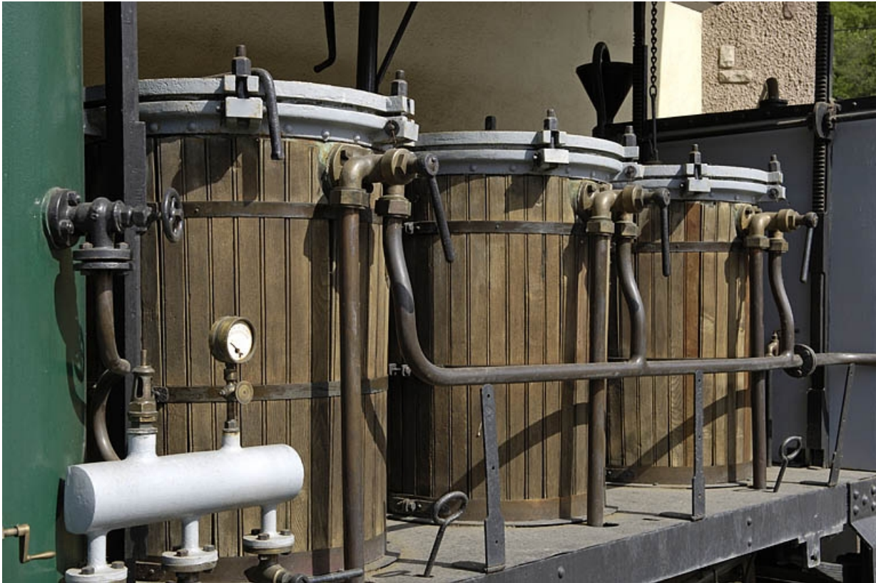
Récipients de l'alambic ambulant.

70, Raddon-et-Chapendu, 9 avenue du Breuchin