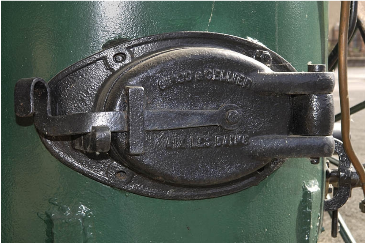
Alambic ambulant. Détail de la porte de la chaudière.

70, Raddon-et-Chapendu, 9 avenue du Breuchin