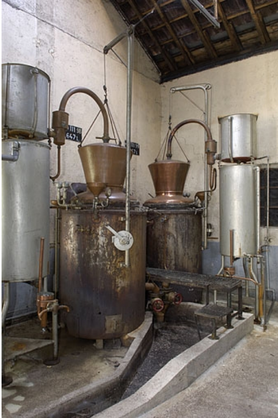
Alambic en service.

70, Raddon-et-Chapendu, 9 avenue du Breuchin