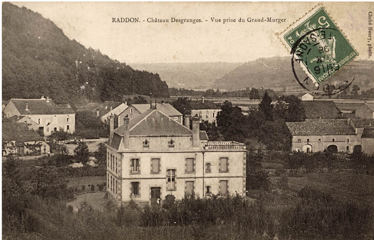
Raddon - Château Desgranges. - Vue prise du Grand-Murger.

70, Raddon-et-Chapendu rue des Planchottes