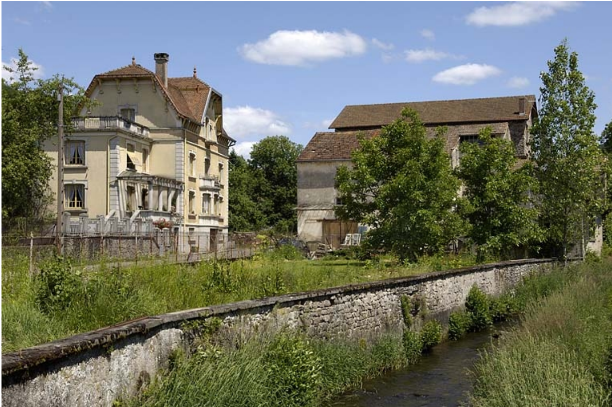
Vue d'ensemble depuis le sud.