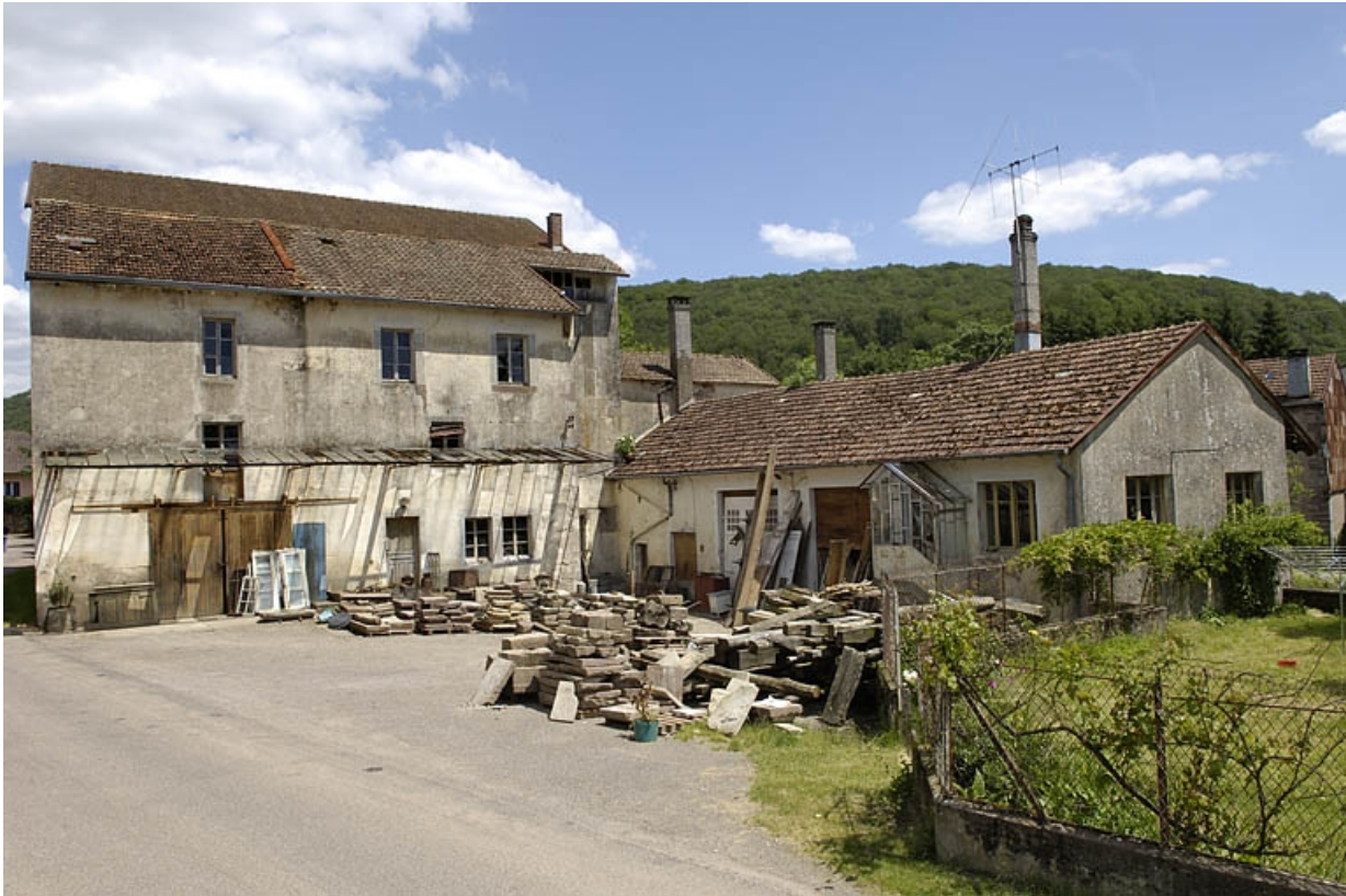
Le moulin et le bâtiment abritant le bureau, un logement et le garage.