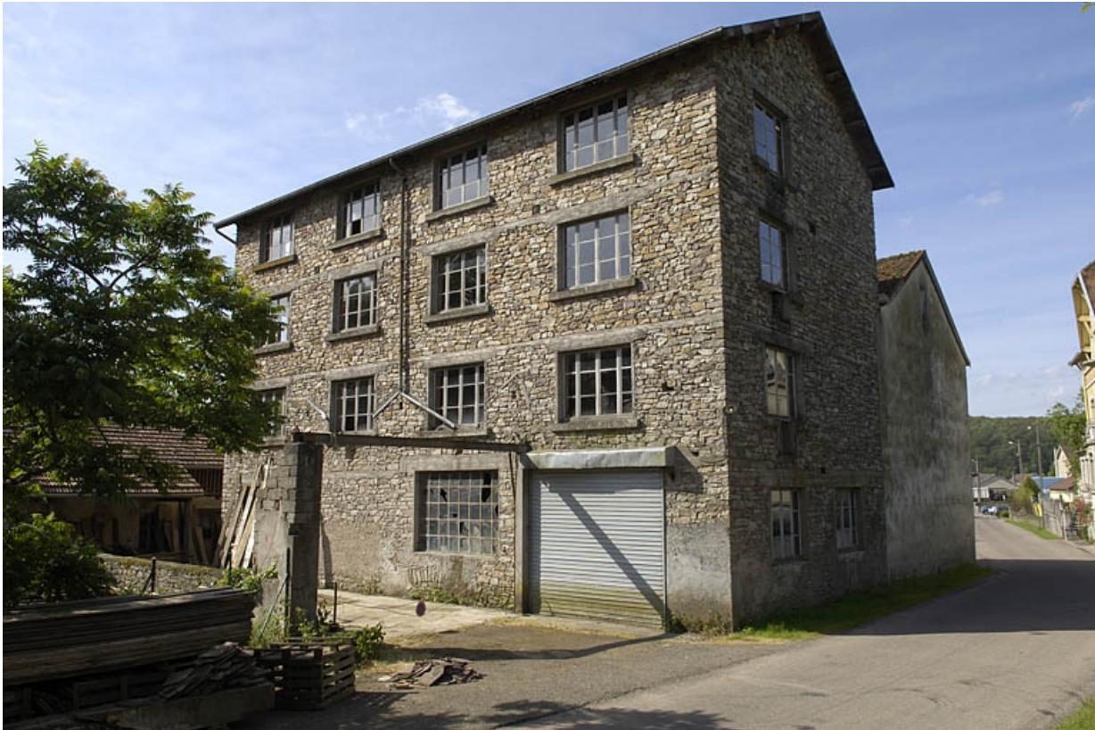
Extension orientale de l'atelier de fabrication.