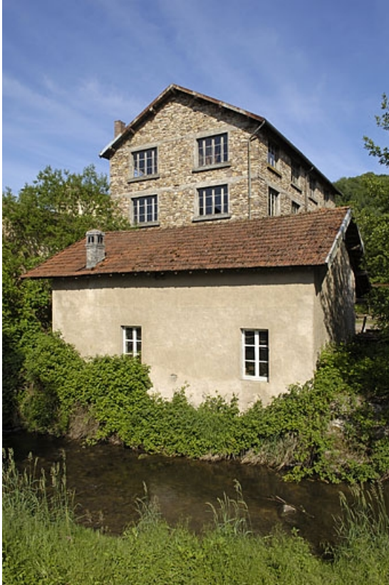
Extension de l'atelier de fabrication depuis la rive gauche du Raddon.