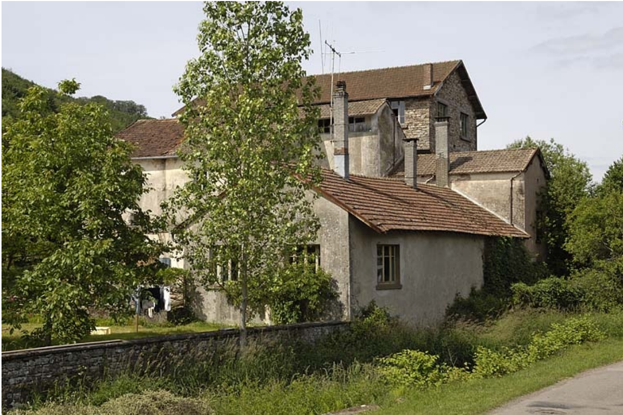
Vue depuis l'aval, sur la rive gauche du Raddon.