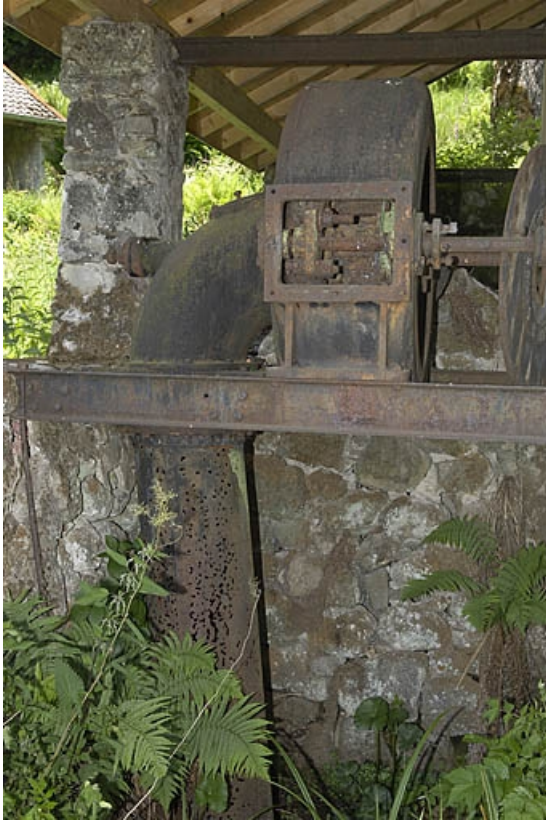
Turbine horizontale et sa conduite d'évacuation.

70, La Montagne, lieudit : le Marchessant