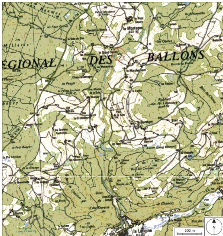
Carte de localisation. Carte topographique au 1:25000, I.G.N., Remiremont, 3519 OT. SCAN 25 © IGN - 2008, Licence n°2008CISE29-68.

70, La Montagne, lieudit : le Marchessant