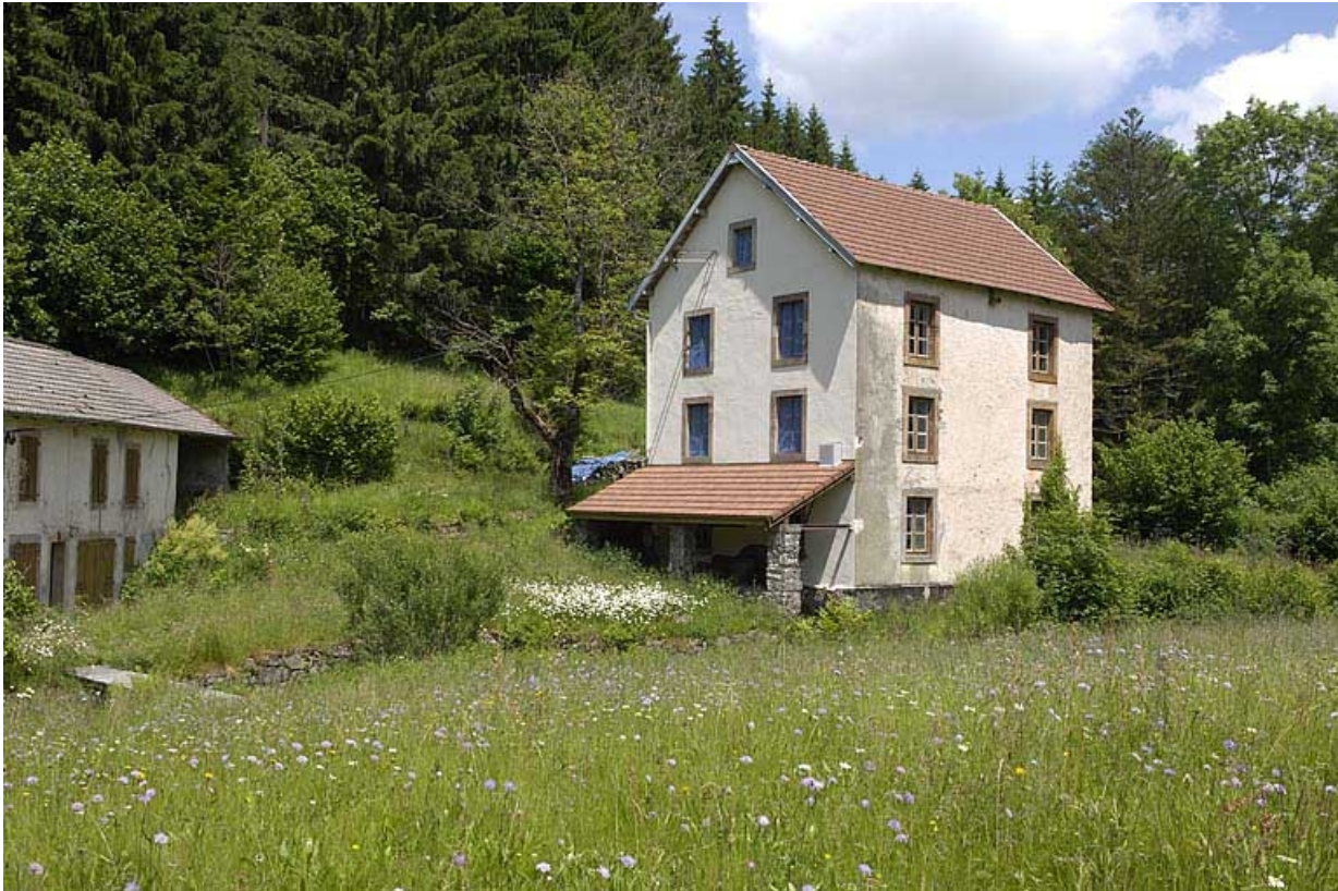
Le moulin vu depuis l'ouest.

70, La Montagne, lieudit : le Marchessant