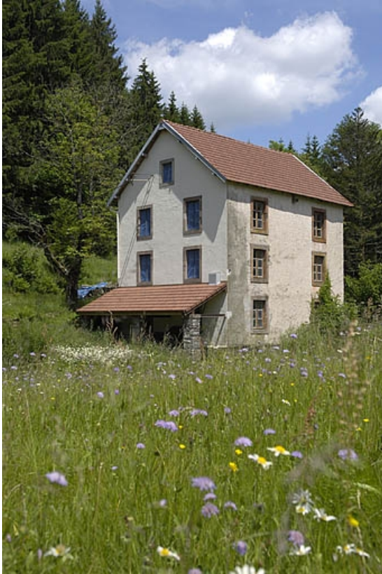
Le moulin vu de trois quarts.

70, La Montagne, lieudit : le Marchessant