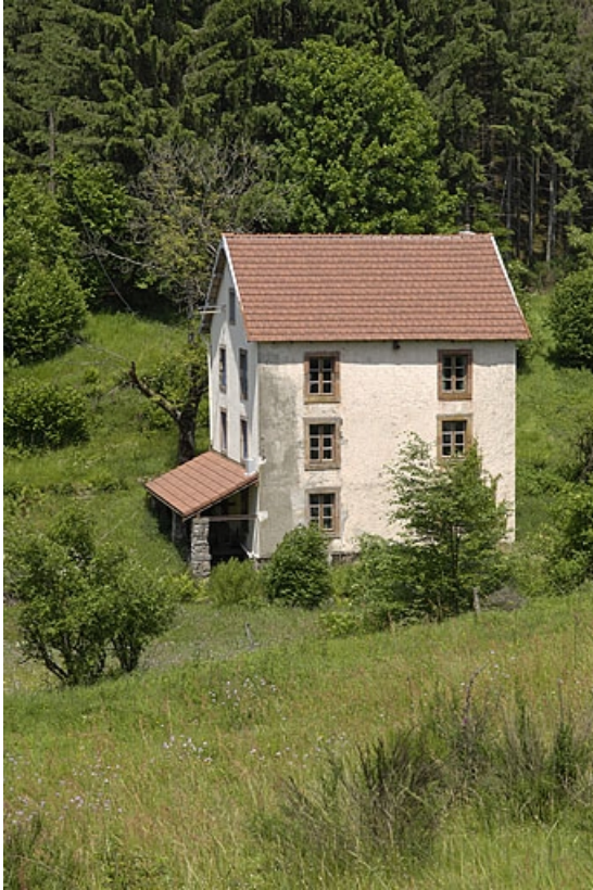
Façade sud du moulin.

70, La Montagne, lieudit : le Marchessant