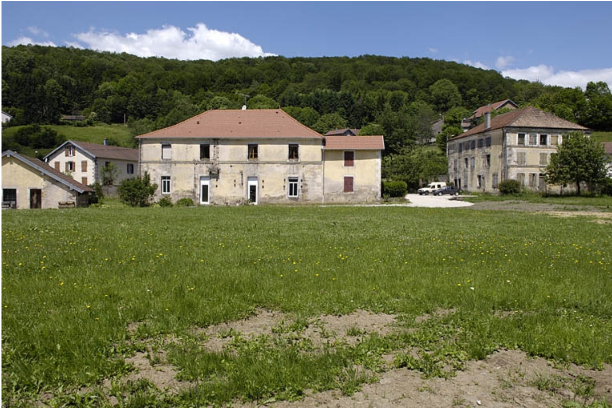
Vue des bâtiments de la papeterie depuis le sud.

70, Saint-Bresson, lieudit : les Maires d'Avaux