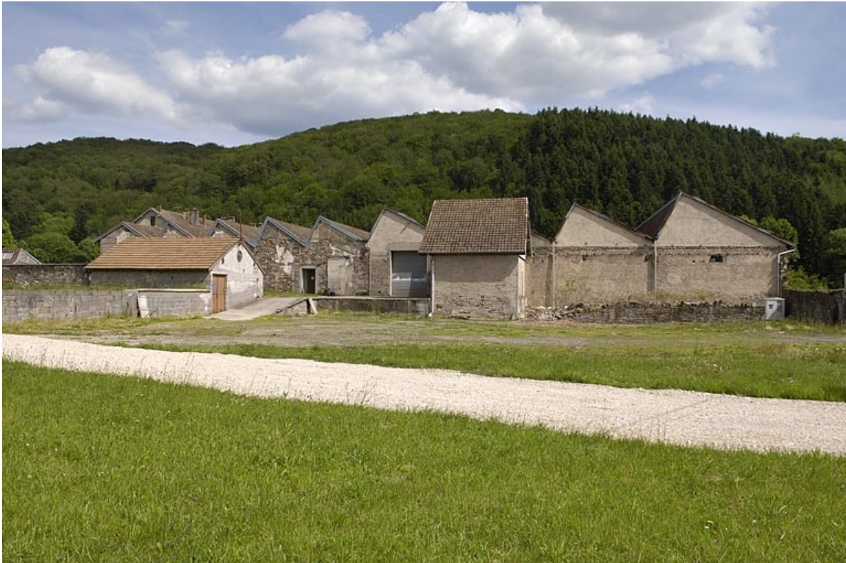
Pignons des ateliers de filature depuis le nord-ouest.

70, Saint-Bresson, lieudit : les Maires d'Avaux