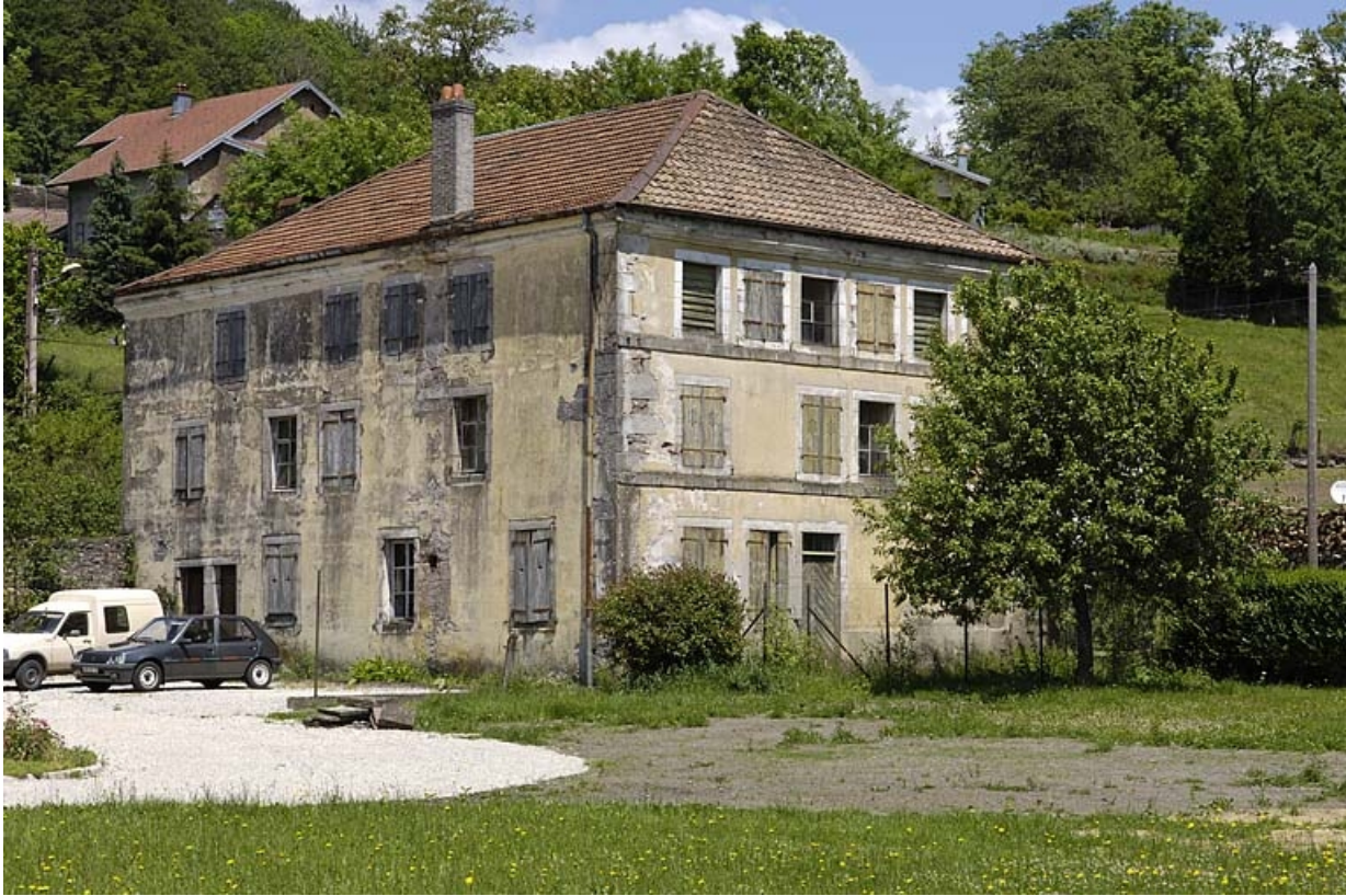
Ancien logement ouvrier de la papeterie.

70, Saint-Bresson, lieudit : les Maires d'Avaux