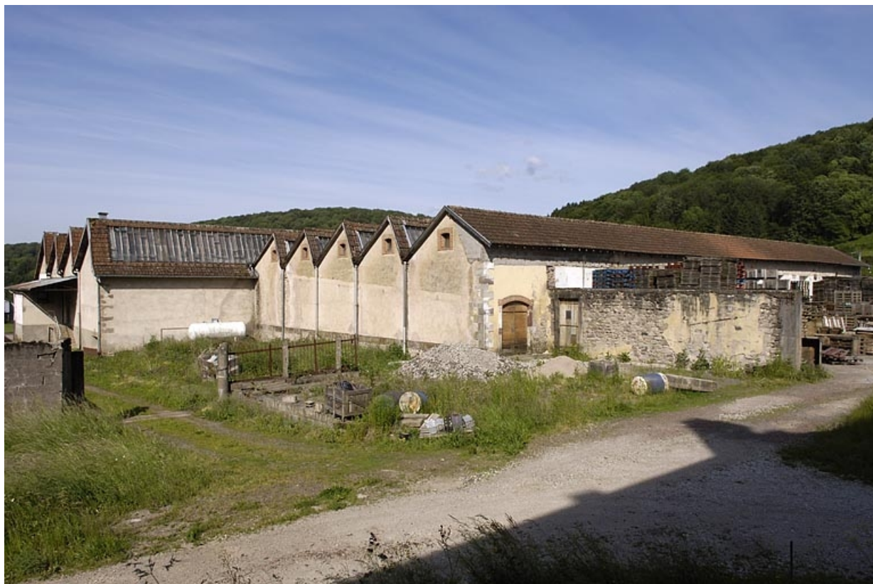
Les ateliers de filature vus depuis l'est.

70, Saint-Bresson, lieudit : les Maires d'Avaux