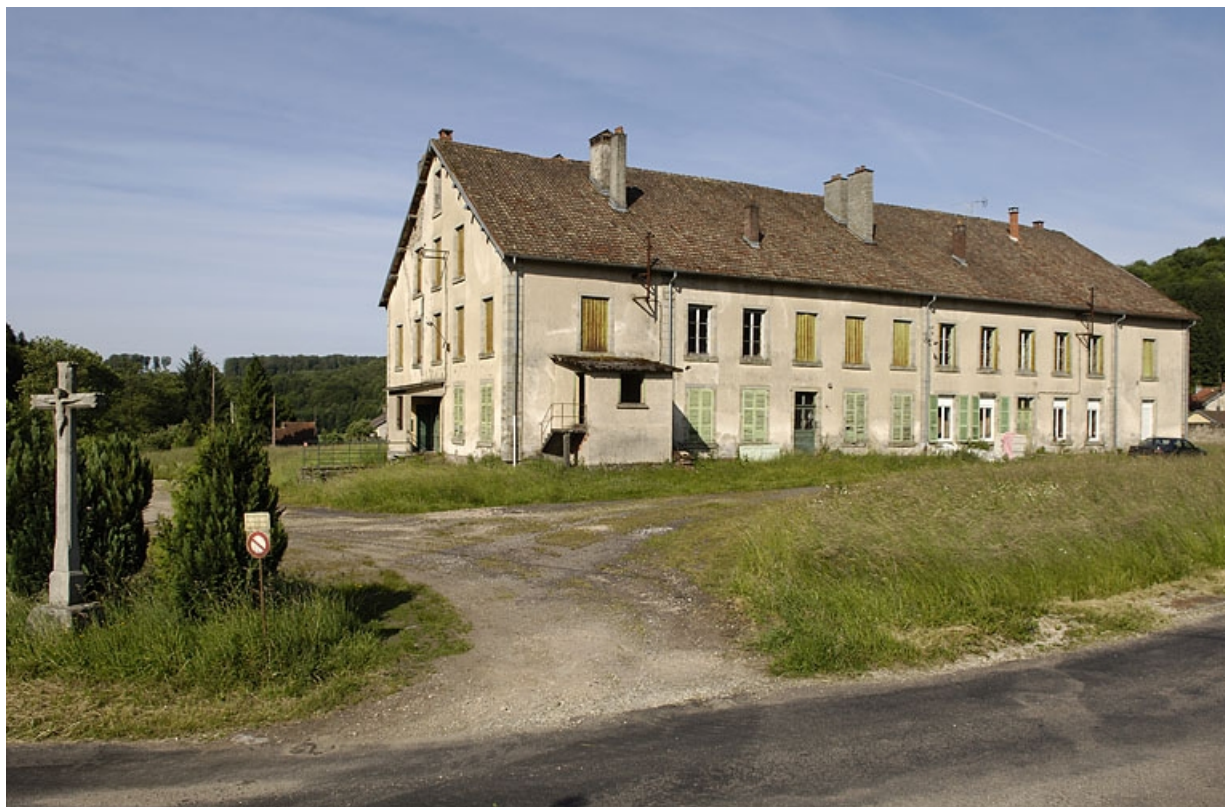
Ancien logement patronal, devenu logement ouvrier, depuis l'est.

70, Saint-Bresson, lieudit : les Maires d'Avaux