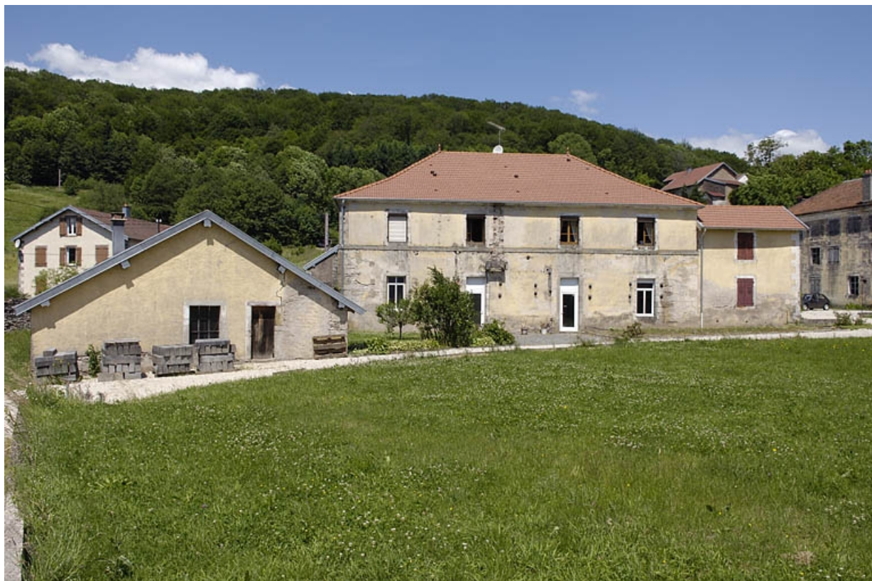
Ancienne menuiserie et forge de la filature.

70, Saint-Bresson, lieudit : les Maires d'Avaux