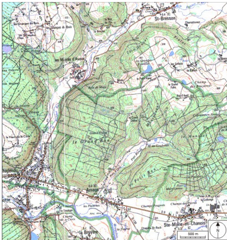
Carte de localisation. Carte topographique au 1:25000, I.G.N., Mëlisey, 3520 O. 70, Saint-Bresson, lieudit : les Maires d'Avaux