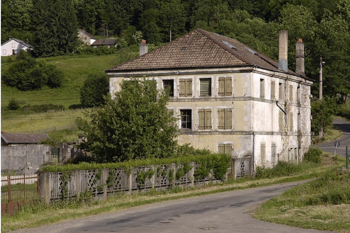
Ancien logement ouvrier vu depuis le sud-est.

70, Saint-Bresson, lieudit : les Maires d'Avaux