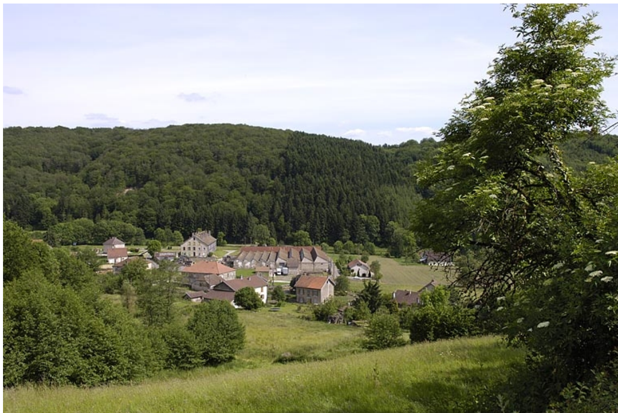
Vue générale plongeante depuis le nord-ouest.

70, Saint-Bresson, lieudit : les Maires d'Avaux