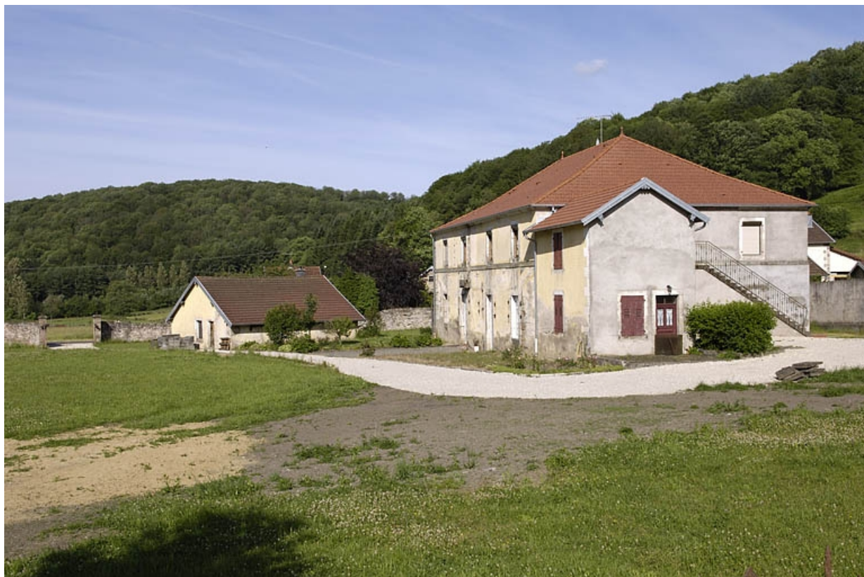
Vue de trois quarts de l'ancienne menuiserie et forge.

70, Saint-Bresson, lieudit : les Maires d'Avaux