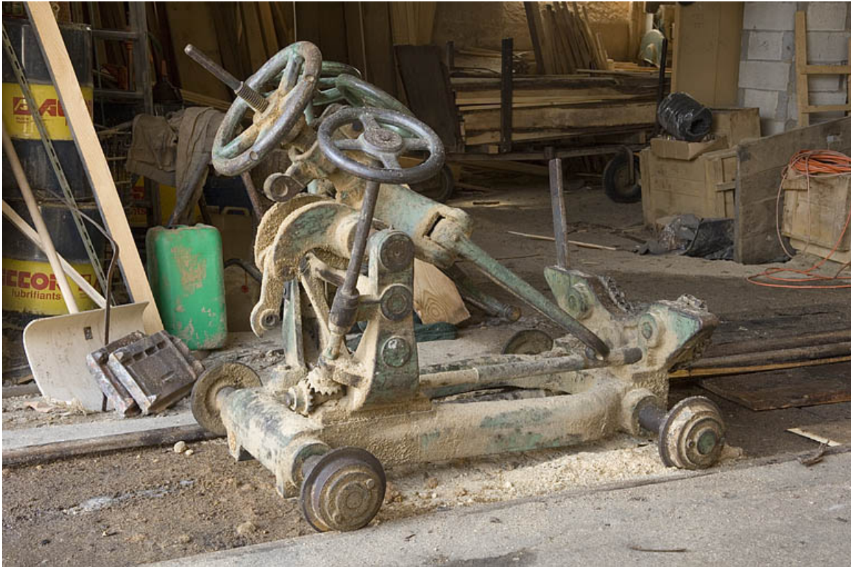
Chariot porte-grumes de la scie déligneuse Socolest.