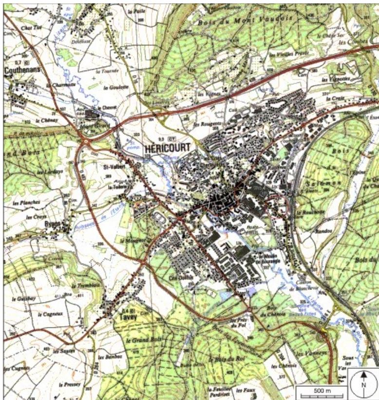
Carte de localisation. Carte topographique au 1:25000, I.G.N., Belfort, 3621 OT. 70, Héricourt, 49 à 53 rue Jean Jaurès