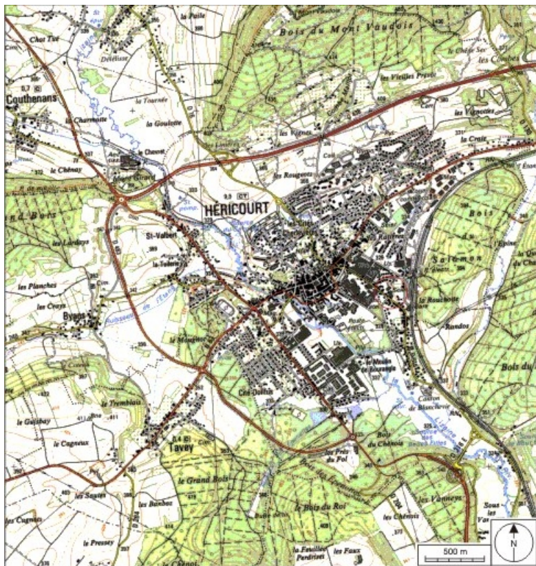
Carte de localisation. Carte topographique au 1:25000, I.G.N., Belfort, 3621 OT. 70, Héricourt, 49 à 53 rue Jean Jaurès