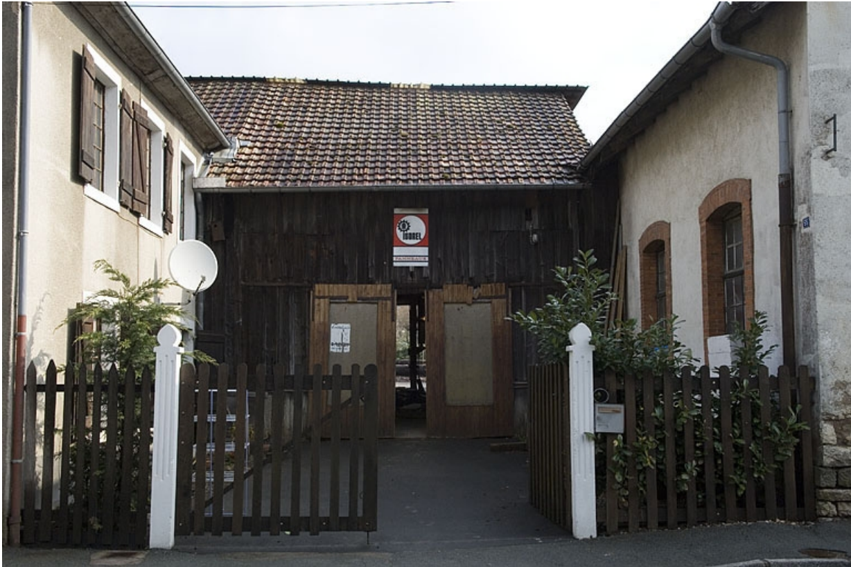
Façade antérieure de l'atelier de scierie.