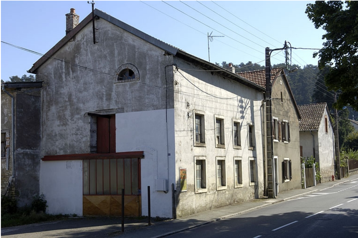
Alignement de façades sur la rue Jean Jaurès.