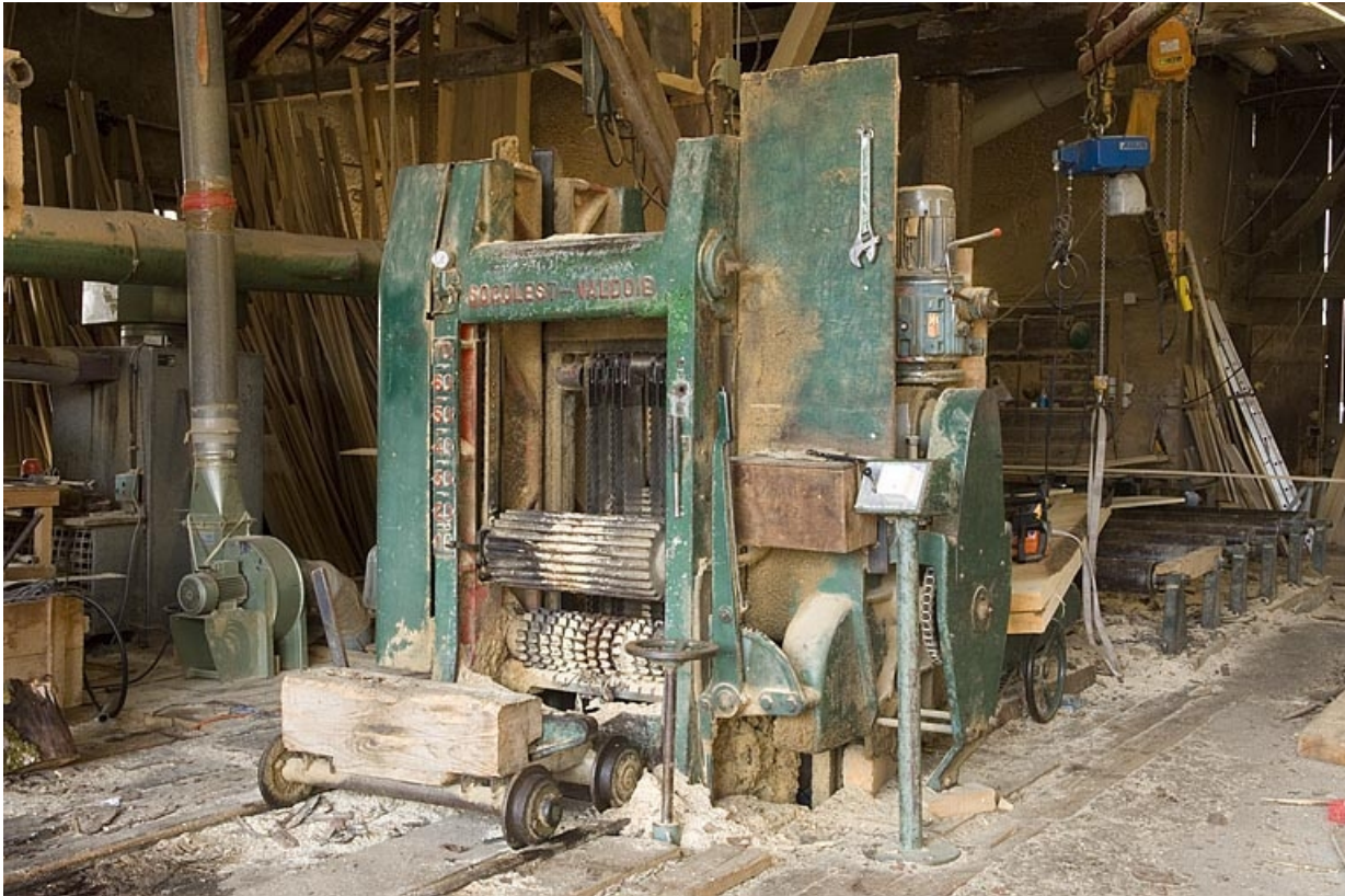
Scie à châssis multilames verticales dite déligneuse Socolest.