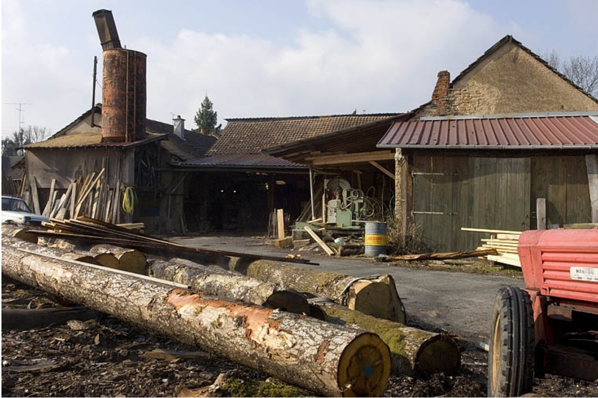
Façade postérieure de l'atelier de scierie. 70, Héricourt, 49 à 53 rue Jean Jaurès