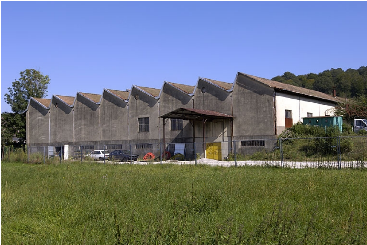
Vue d'ensemble depuis l'ouest.