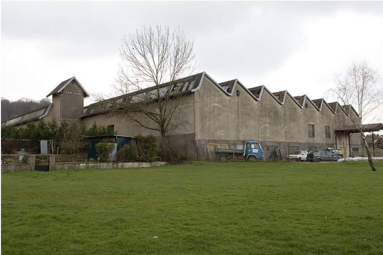
Vue de trois quarts arrière de l'atelier de fabrication.