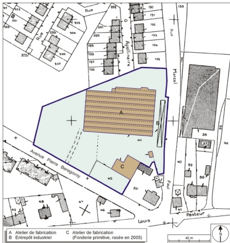
Plan-masse et de situation. Extrait du plan cadastral numérisé, 2005, section AN, 1:1000. 70, Héricourt, 19 rue Marcel Paul