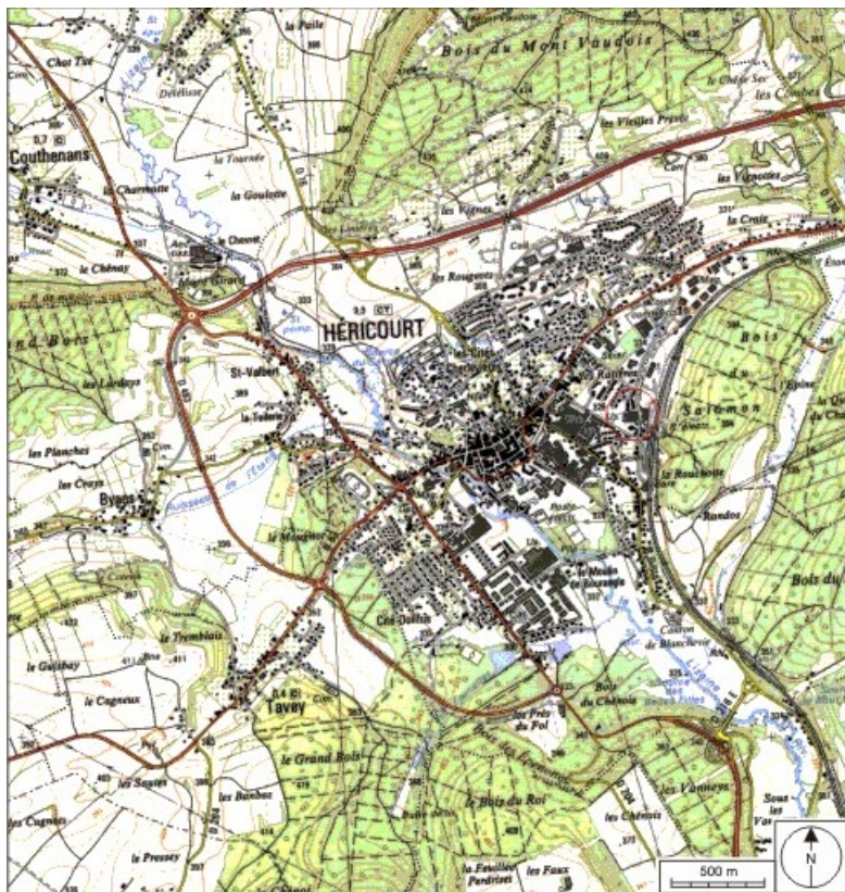
Carte de localisation. Carte topographique au 1:25000, I.G.N., Belfort, 3621 OT. 70, Héricourt, 19 rue Marcel Paul