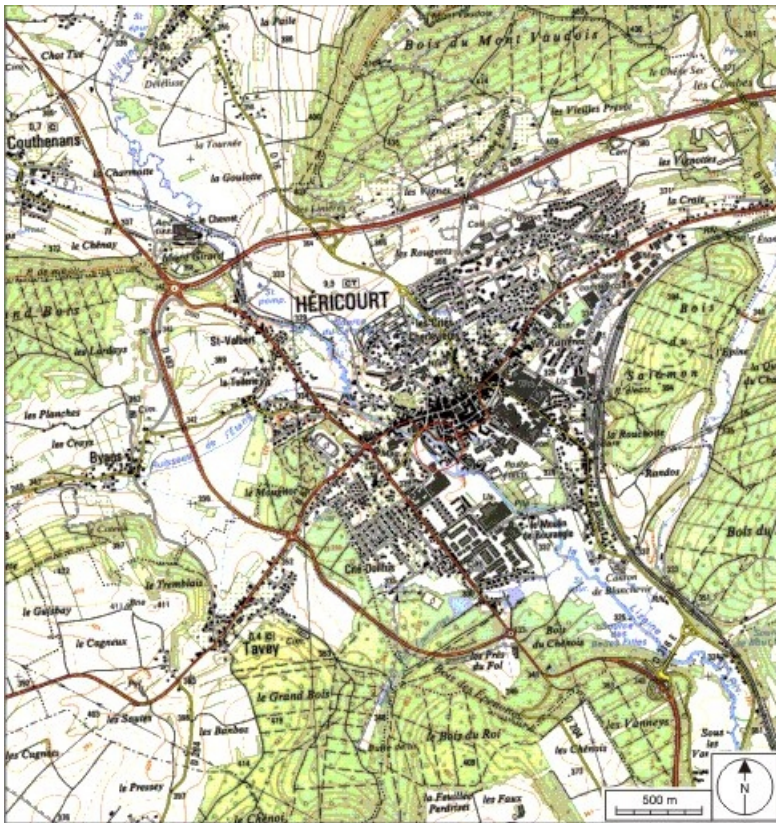
Carte de localisation. Carte topographique au 1:25000, I.G.N., Belfort, 3621 OT. 70, Héricourt, 3 impasse du Breuil