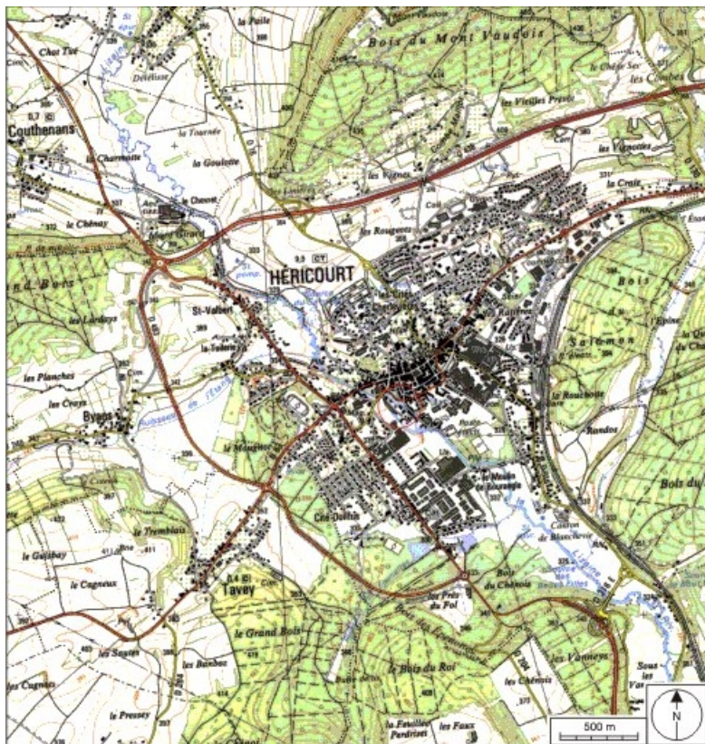
Carte de localisation. Carte topographique au 1:25000, I.G.N., Belfort, 3621 OT. 70, Héricourt, 3 impasse du Breuil