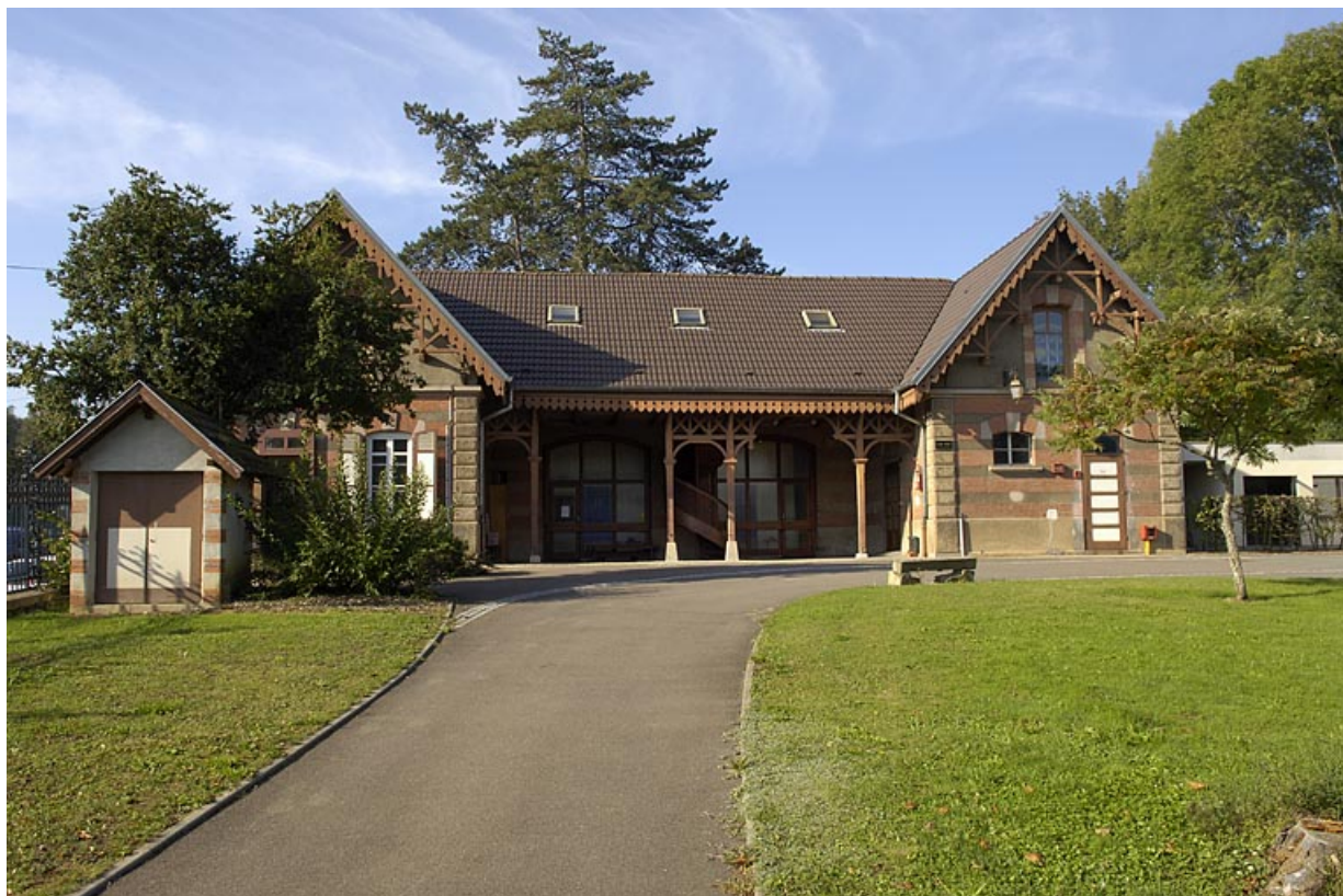
Façade nord de l'ancienne écurie (?). 70, Héricourt, 2 faubourg de Besançon