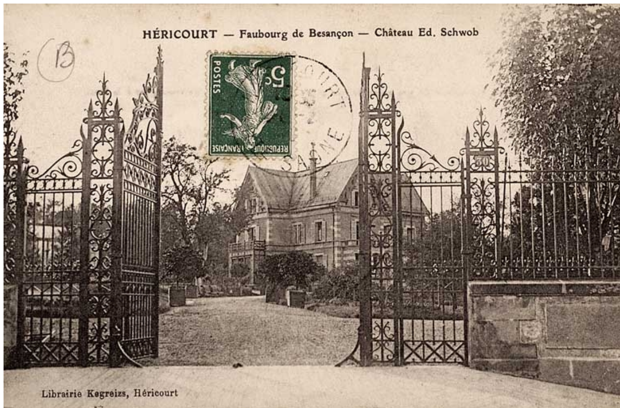
Héricourt - Faubourg de Besançon, château Ed. Schwob. 70, Héricourt, 2 faubourg de Besançon