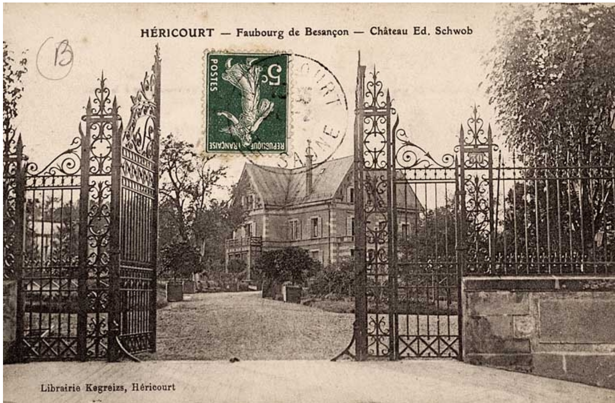
Héricourt - Faubourg de Besançon, château Ed. Schwob. 70, Héricourt, 2 faubourg de Besançon