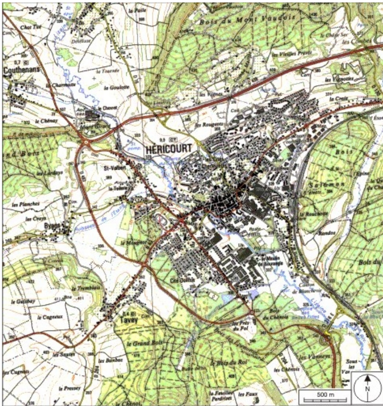
Carte de localisation. Carte topographique au 1:25000, I.G.N., Belfort, 3621 OT. 70, Héricourt, 2 faubourg de Besançon