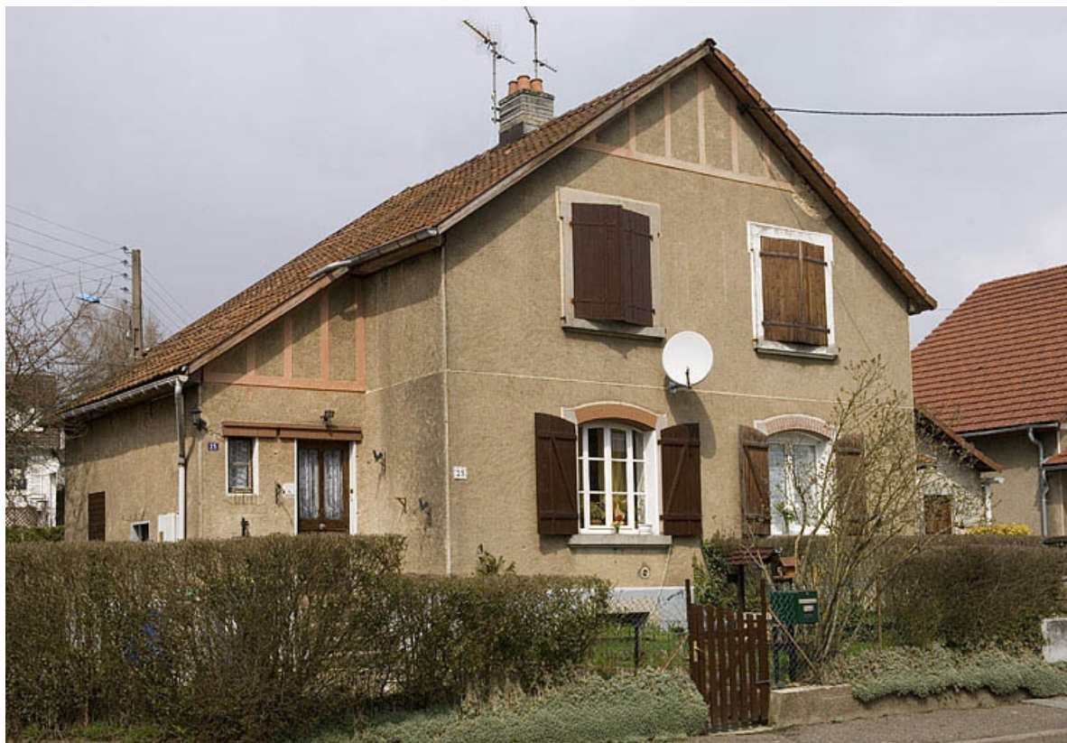
Maison à deux logements (côté impair).