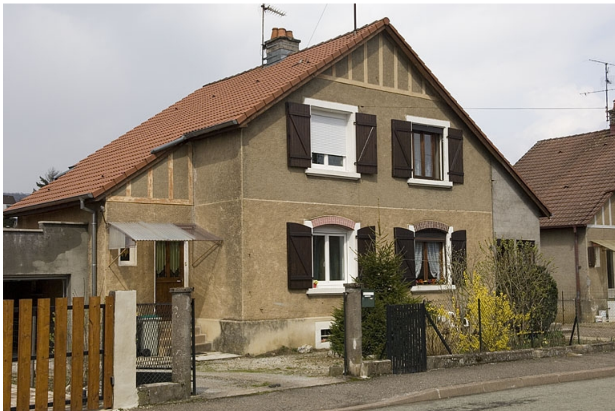
Maison à deux logements vue de trois quarts.