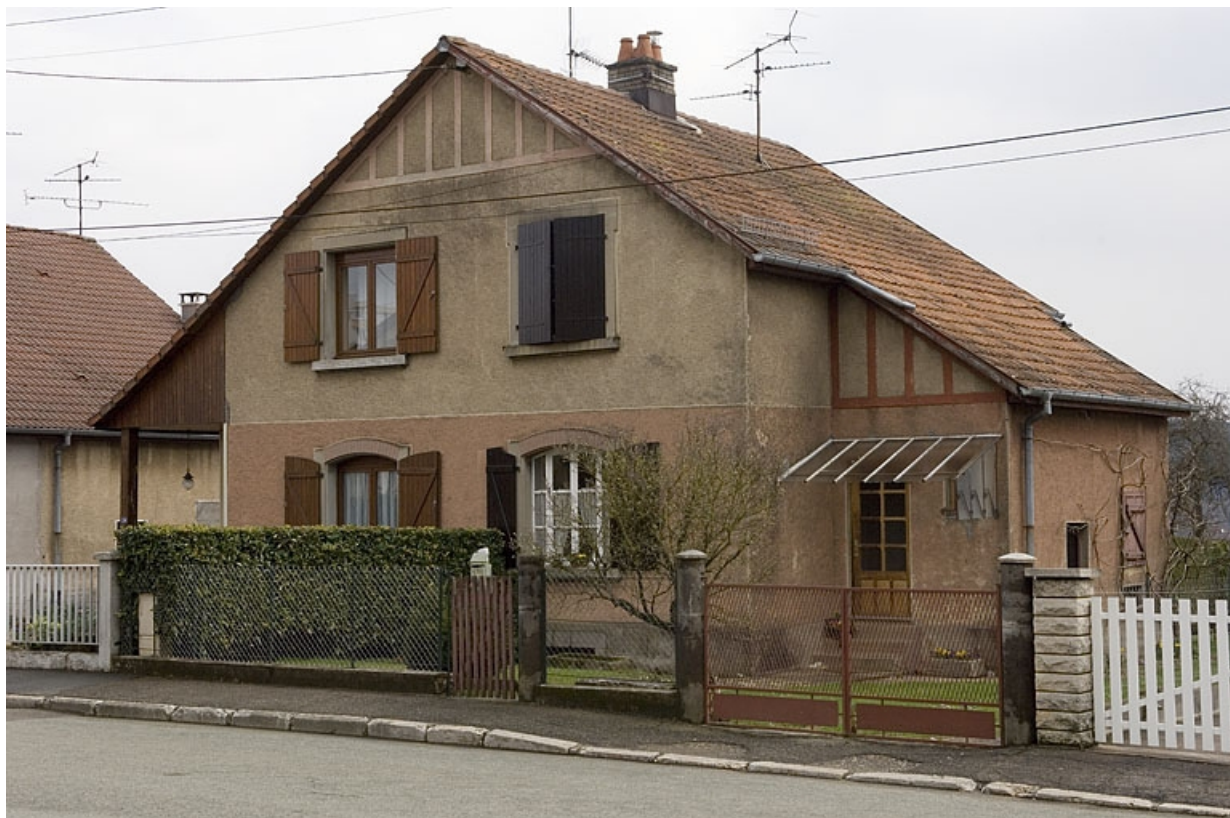
Vue de trois quarts d'une maison à deux logements.