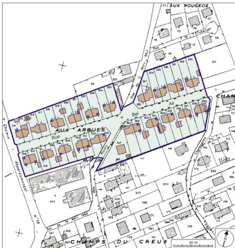
Plan-masse et de situation. Extrait du plan cadastral numérisé, 2005, section AK, 1:1000 réduit à 1:1500. 70, Héricourt rue Bel Air