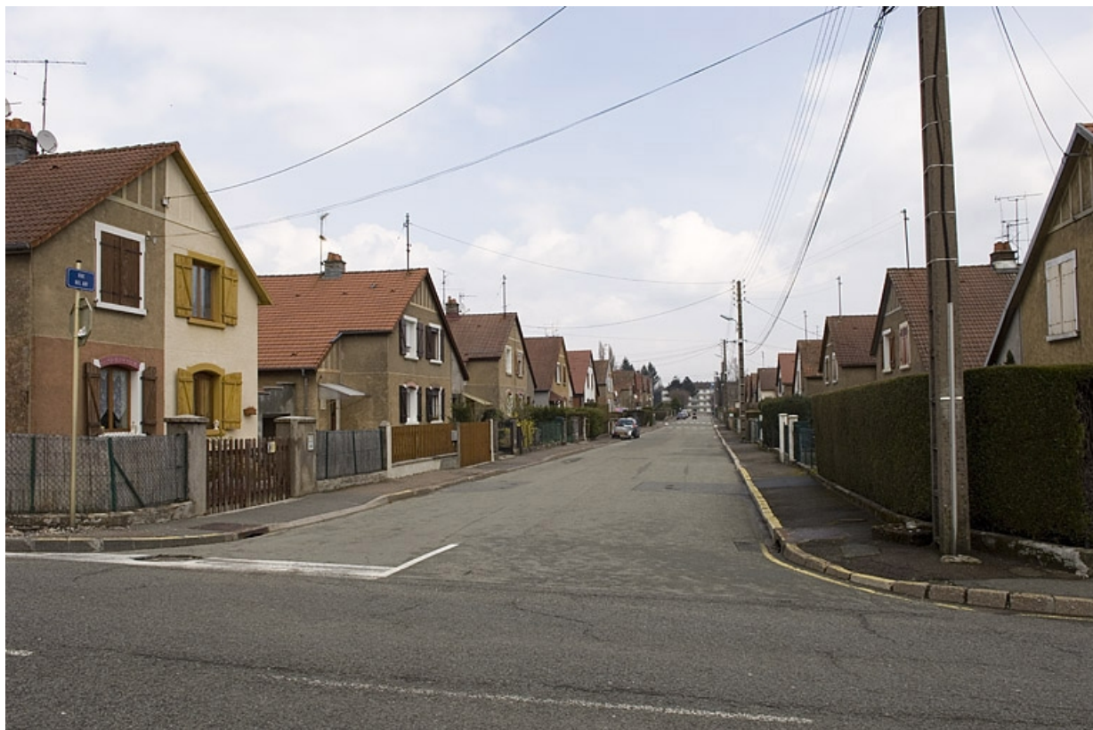
Vue d'ensemble de la rue Bel Air.