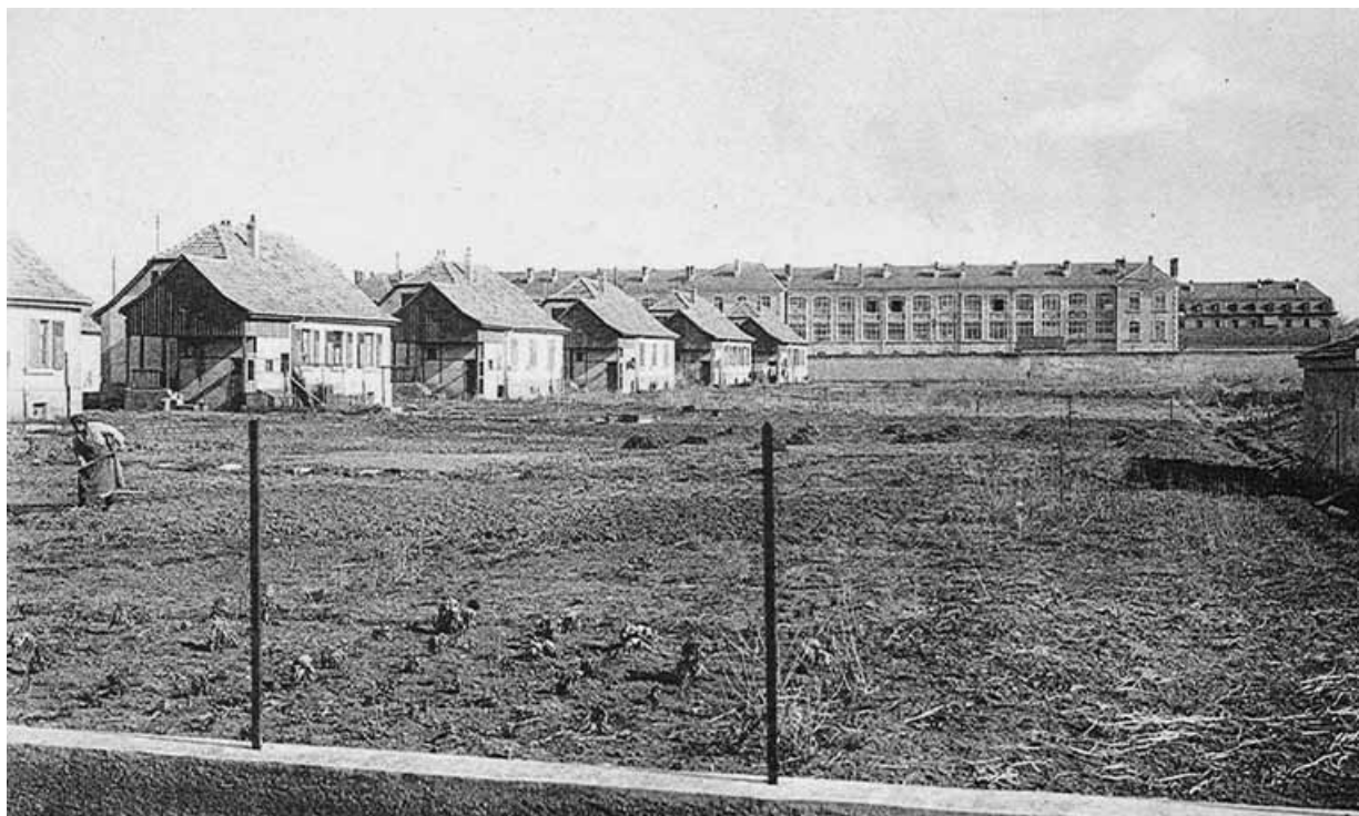
La cité ouvrière des Polognes.