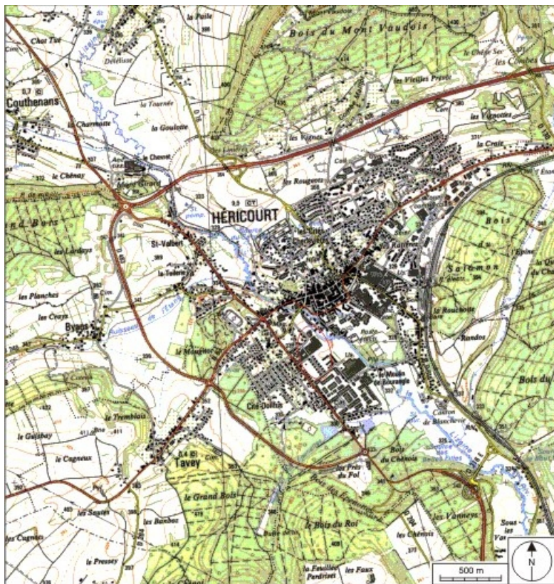
Carte de localisation. Carte topographique au 1:25000, I.G.N., Belfort, 3621 OT. 70, Héricourt rue de la 1 à 13 Tuilerie