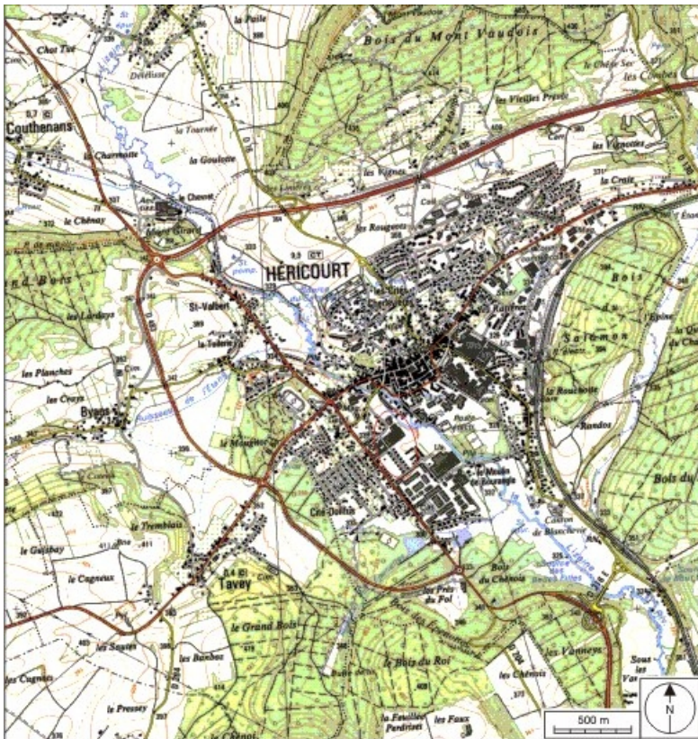
Carte de localisation. Carte topographique au 1:25000, I.G.N., Belfort, 3621 OT. SCAN 25, Licence n°2008CISE29-68. 70, Héricourt rue de la 1 à 13 Tuilerie