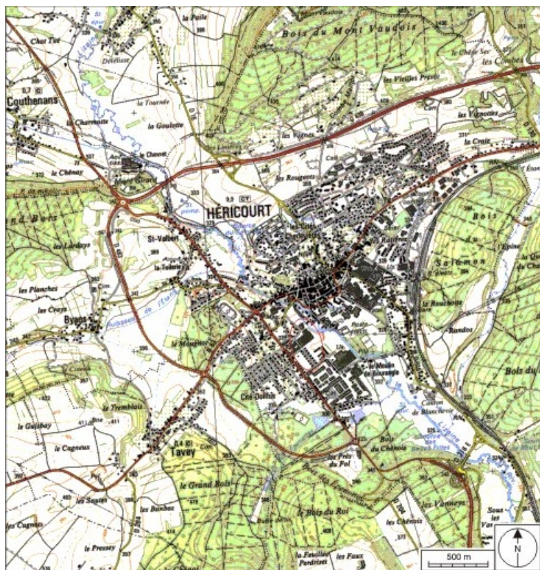
Carte de localisation. Carte topographique au 1:25000, I.G.N., Belfort, 3621 OT. Licence n°2008CISE29-68. 70, Héricourt rue de la 1 à 13 Tuilerie