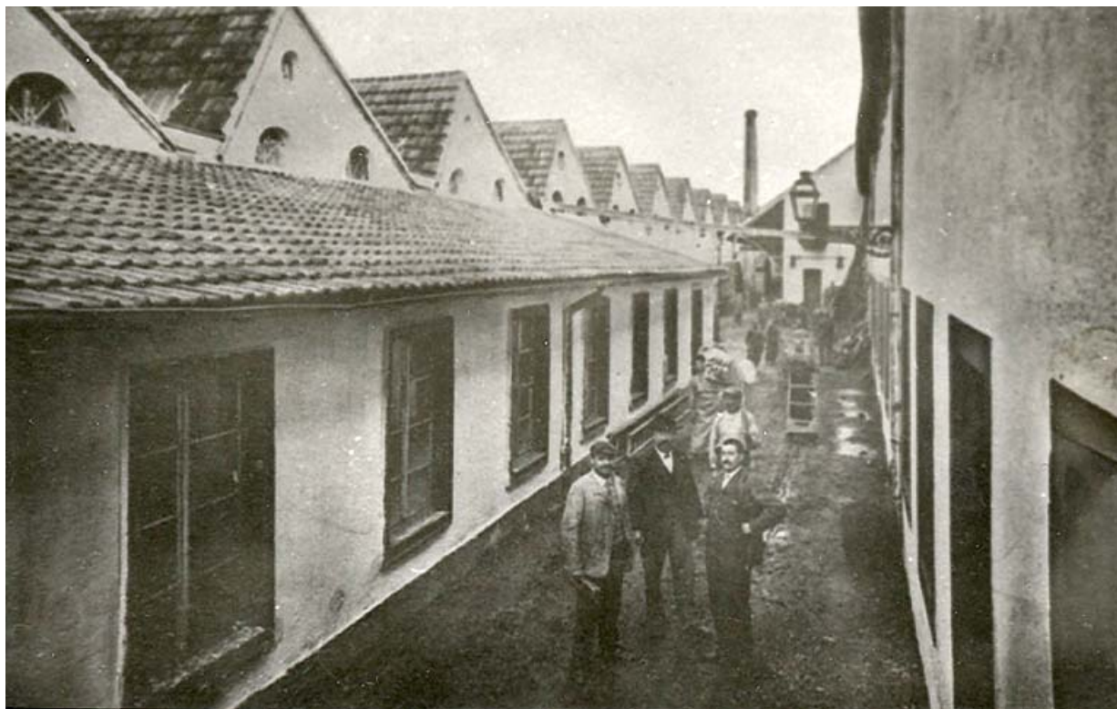
Ateliers de fabrication en rez-de-chaussée.