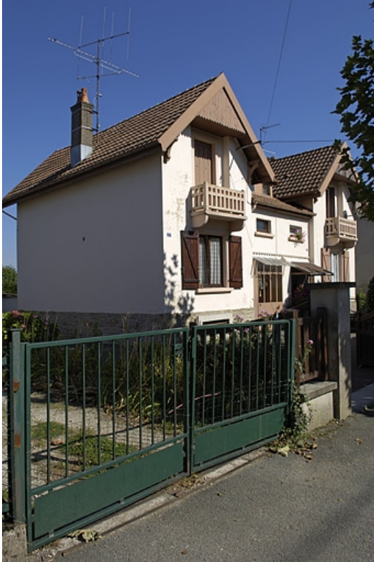
Logement ouvrier double faubourg de Montbéliard.