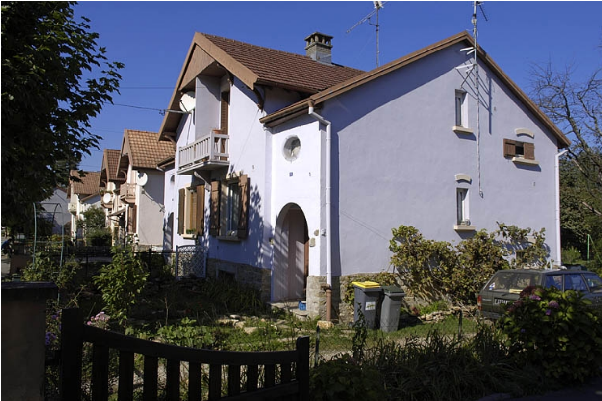
Façades postérieures de logements ouvriers doubles.