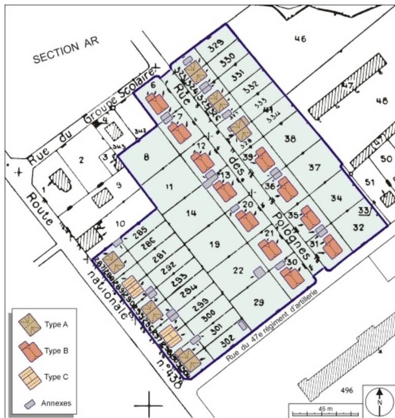
Plan-masse de la cité ouvrière. Extrait du plan cadastral numérisé, 2005, section AP, 1:2000 réduit à 1:1500. 70, Héricourt rue de la 1 à 13 Tuilerie