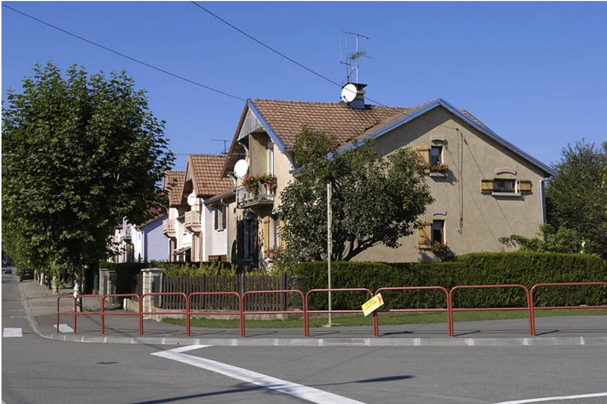
Logements ouvriers faubourg de Montbéliard.