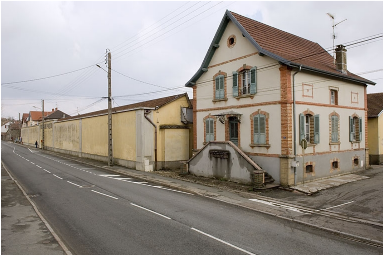
Alignement sur l'avenue Jean Jaurès de l'atelier de tissage et du logement d'entrée. 70, Héricourt rue Marcel Bardot