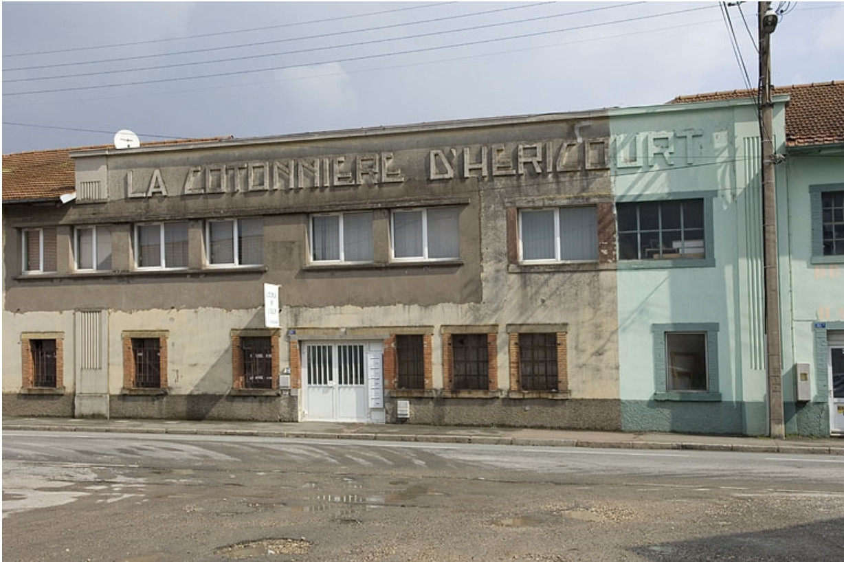
Frontispice La Cotonnière d'Héricourt.