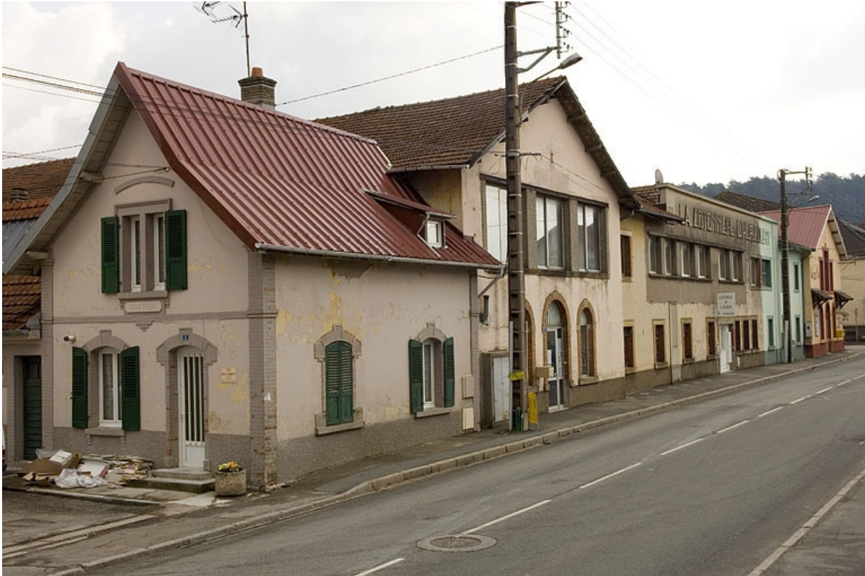
Façades sur l'avenue Jean Jaurès.