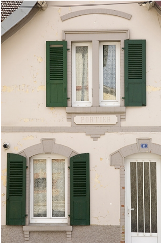
Détail de façade de la conciergerie.