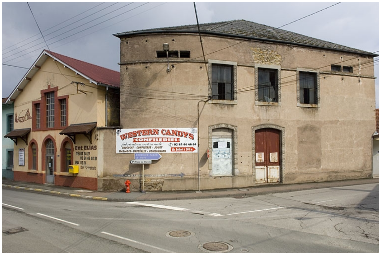
Bâtiments situés à l'intersection de l'avenue Jean Jaurès et de la rue Pasteur. 70, Héricourt rue Marcel Bardot