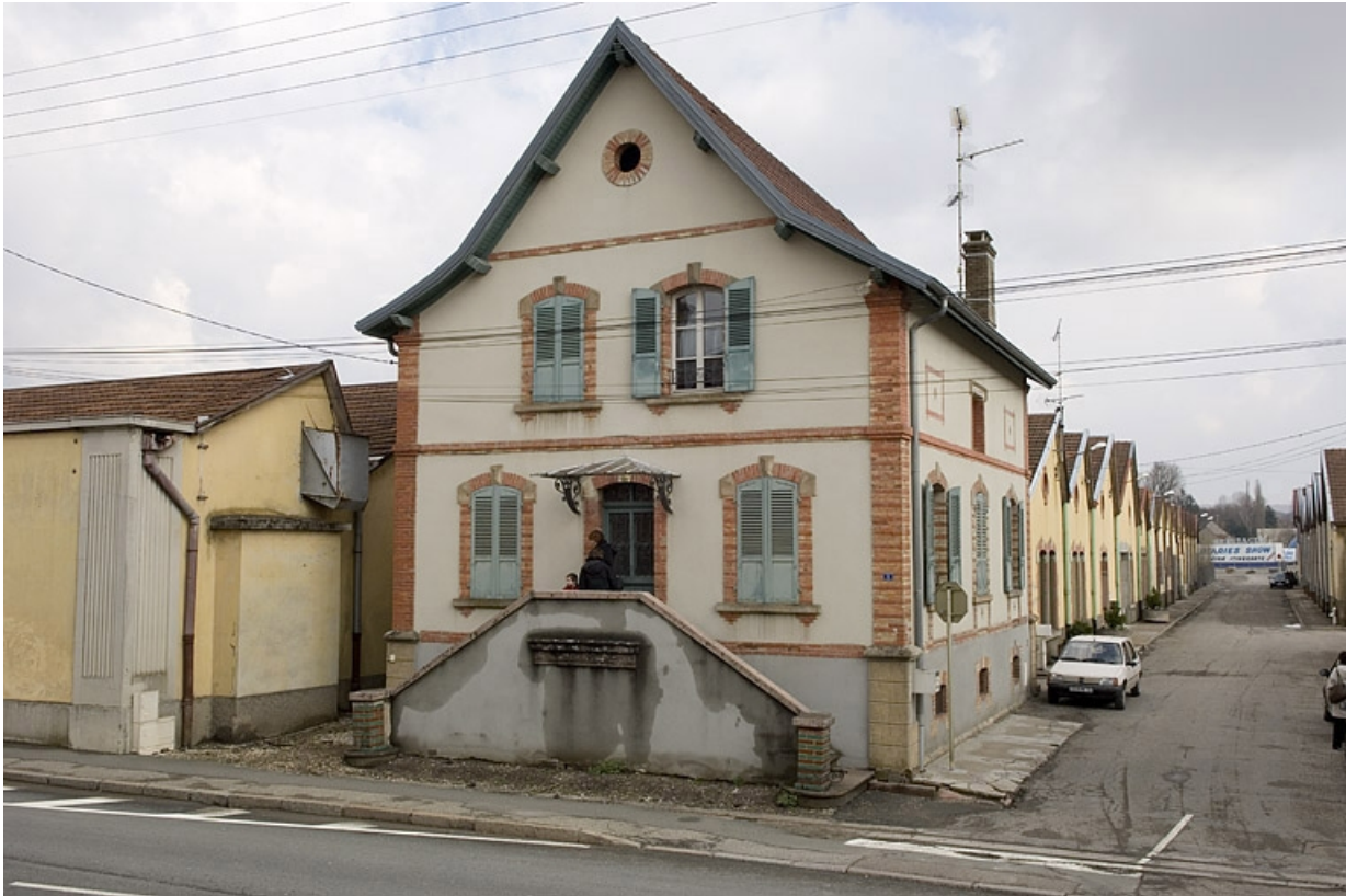
Logement et pignons des sheds sur la rue Marcel Bardot.