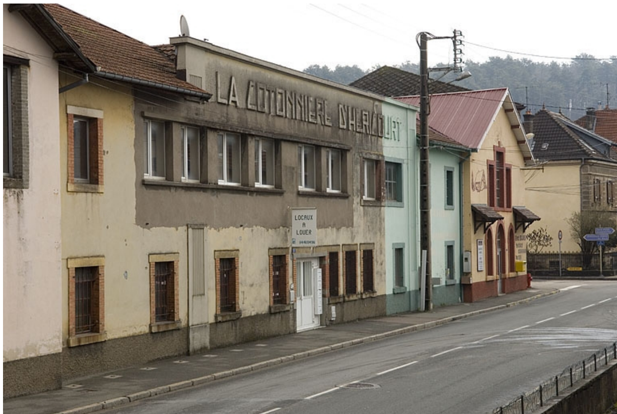
Façades sur l'avenue Jean Jaurès. Détail du frontispice La Cotonnière d'Héricourt. 70, Héricourt rue Marcel Bardot