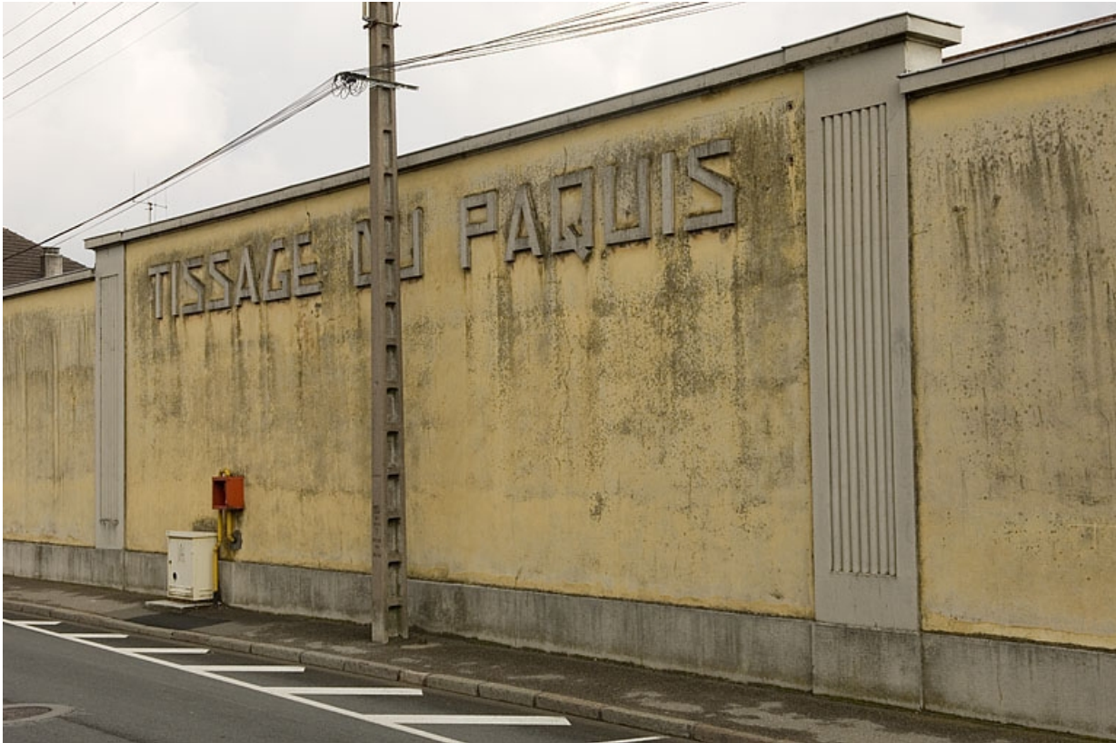
Frontispice Tissage du Paquis.