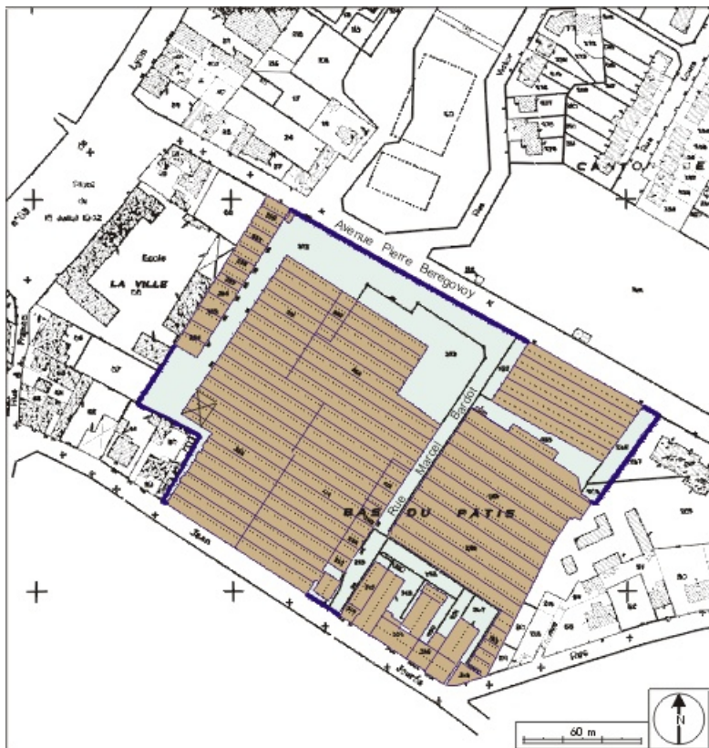
Plan-masse et de situation. Extrait du plan cadastral numérisé, 2005, section AN, 1:1000 réduit à 1:2000. 70, Héricourt rue Marcel Bardot