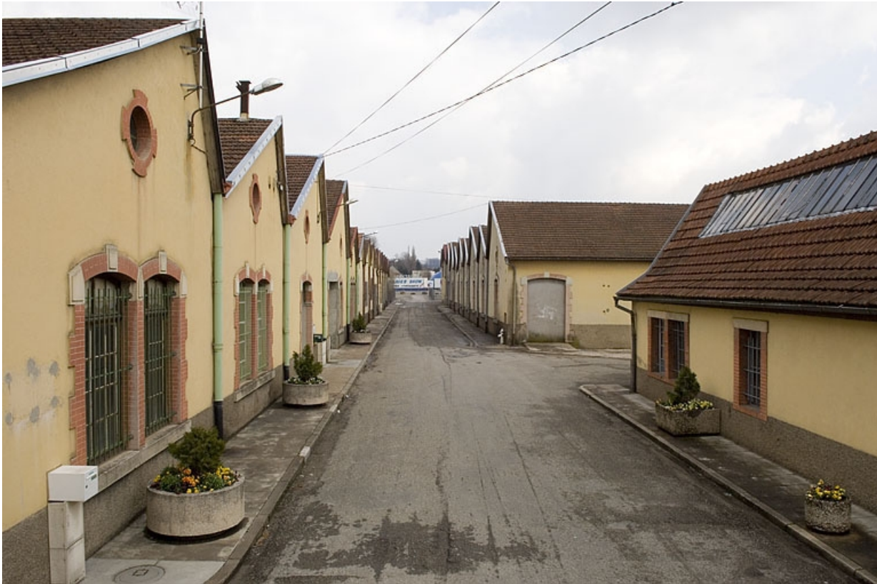
Ateliers de fabrication de part et d'autre de la rue Marcel Bardot. 70, Héricourt rue Marcel Bardot