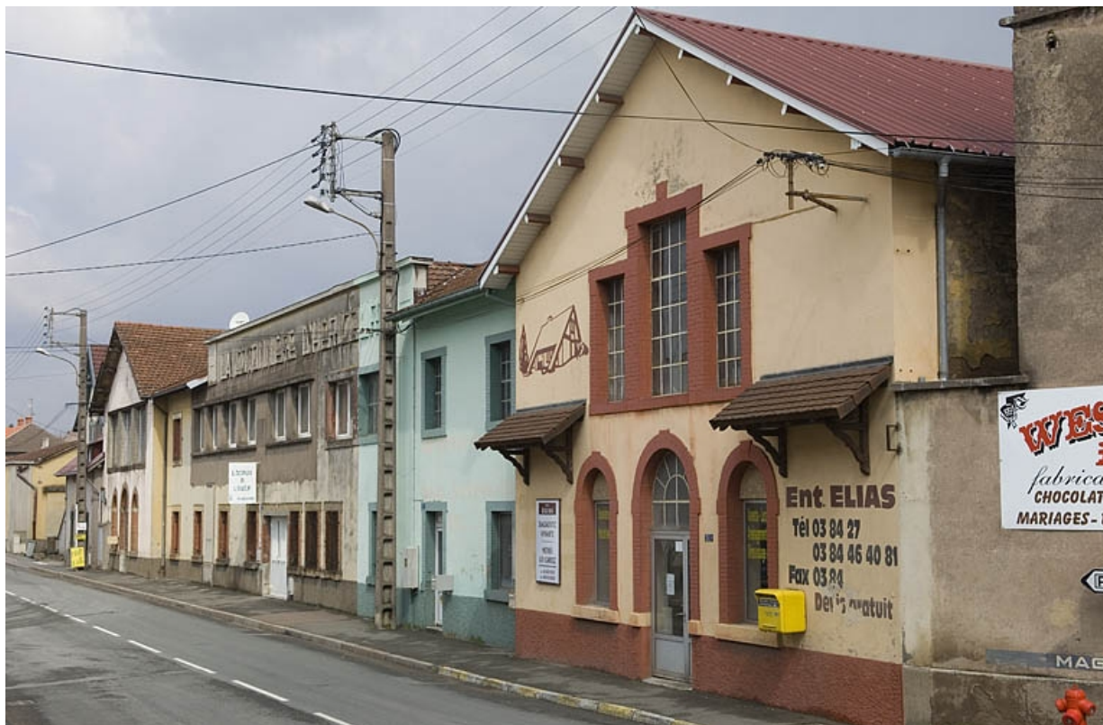
Façades sur l'avenue Jean Jaurès depuis le sud.