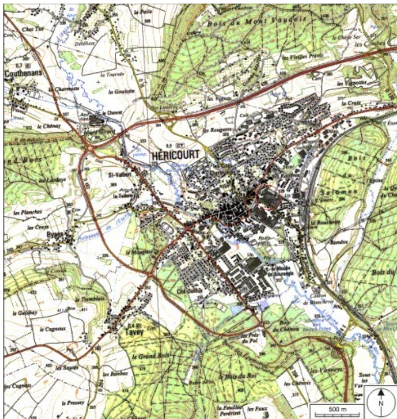
Carte de localisation. Carte topographique au 1:25000, I.G.N., Belfort, 3621 OT. SCAN 25 © IGN - 2008, Licence n°2008CISE29-68. 70, Héricourt rue Marcel Bardot