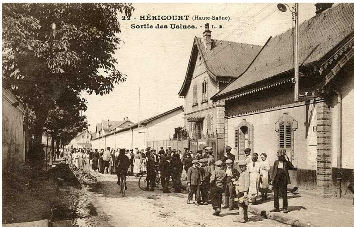
Héricourt (Haute-Saône) - Sortie des Usines.