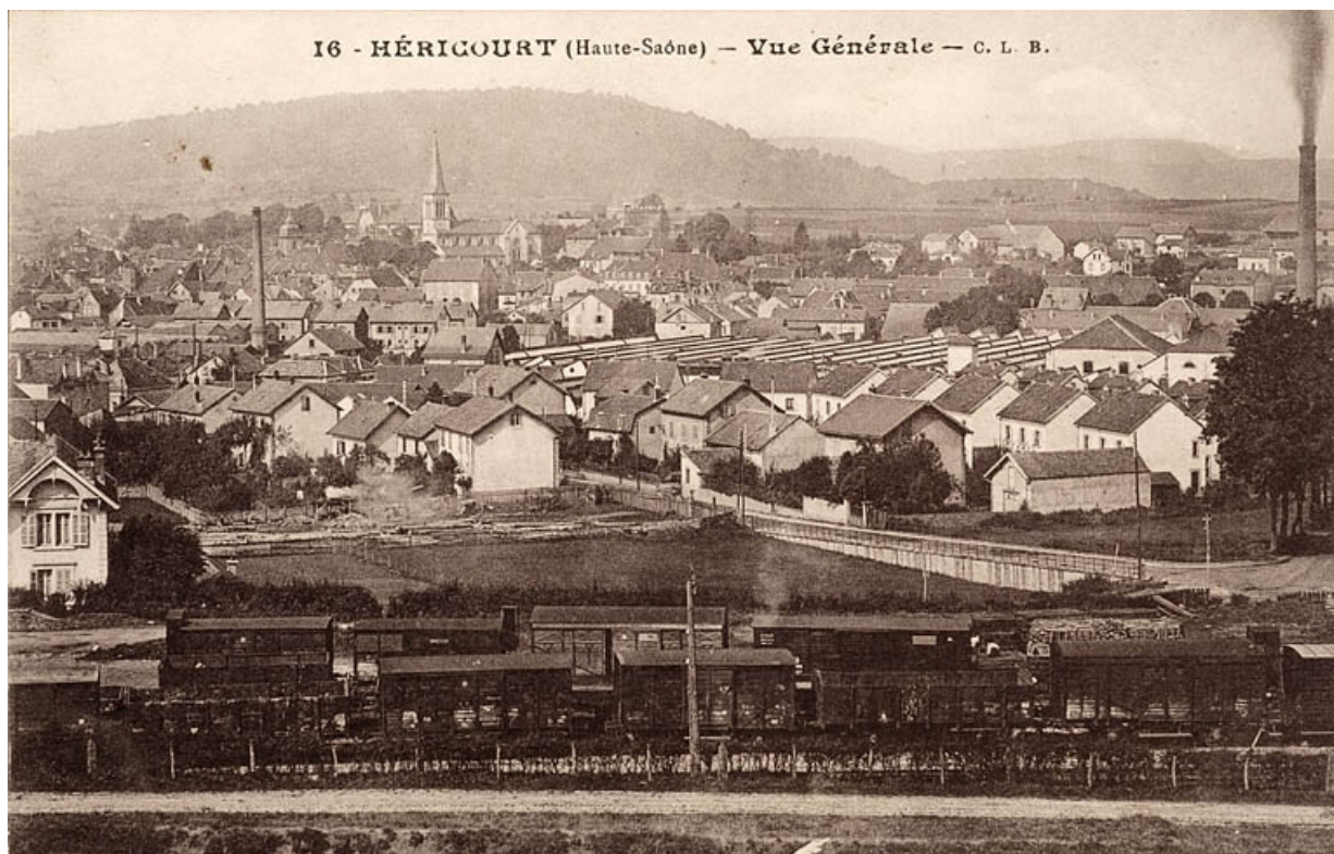
Héricourt (Haute-Saône) - Vue générale.