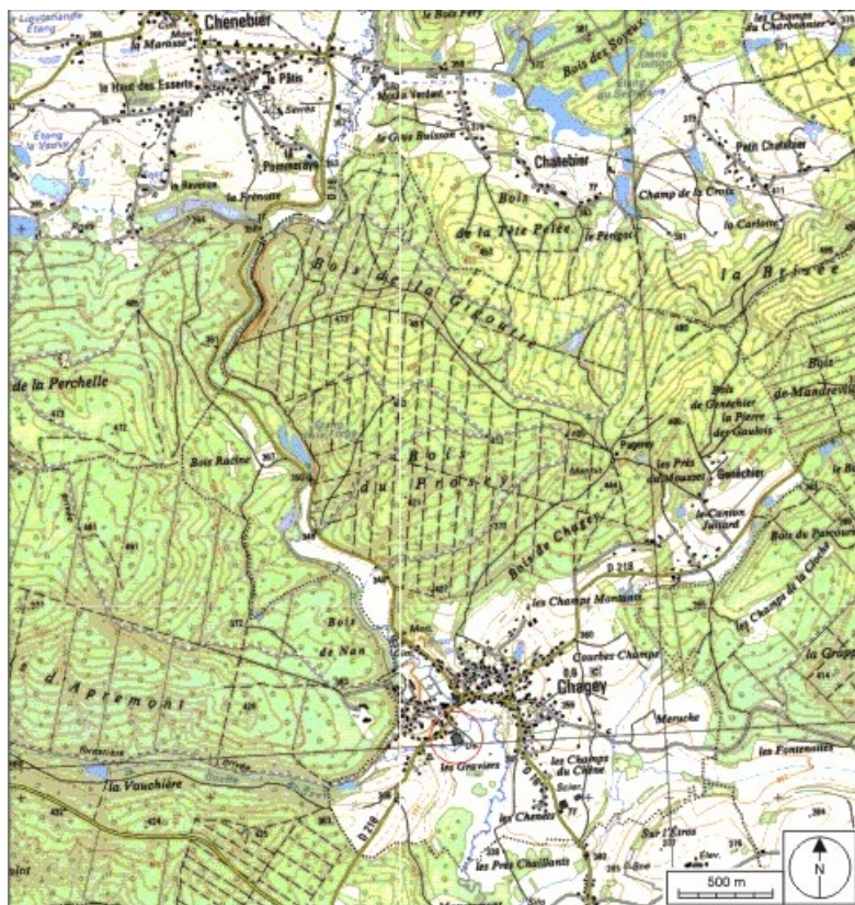
Carte de localisation. Carte topographique au 1:25000, I.G.N., Belfort, 3621 OT. SCAN 25, Licence n°2008CISE29-68. 70, Chagey R.D. 218