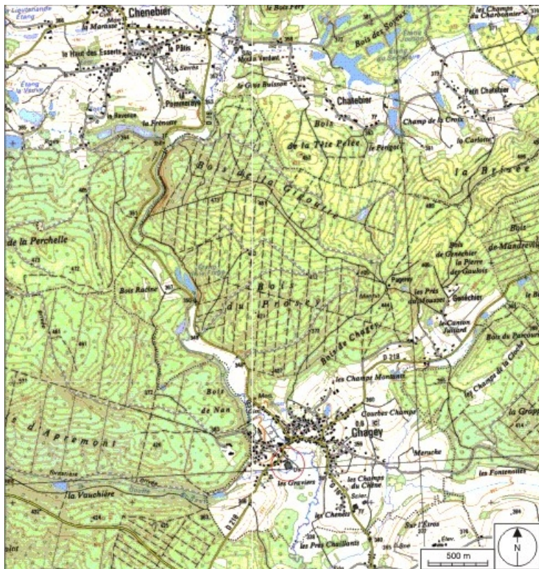
Carte de localisation. Carte topographique au 1:25000, I.G.N., Belfort, 3621 OT. SCAN 25 70, Chagey R.D. 218