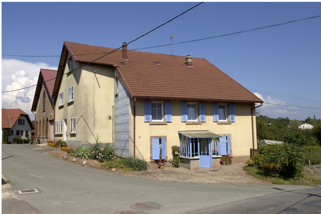
Vue d'ensemble depuis le sud. 70, Chenebier, 2 rue des Combes