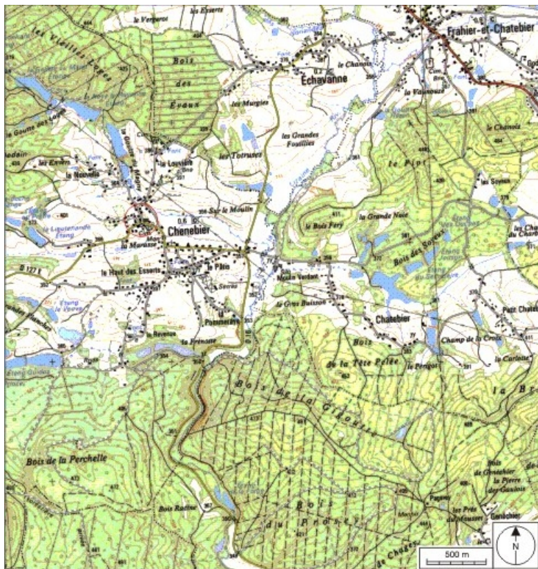
Carte de localisation. Carte topographique au 1:25000, I.G.N., Belfort, 3621 OT. 70, Chenebier, 2 rue des Combes