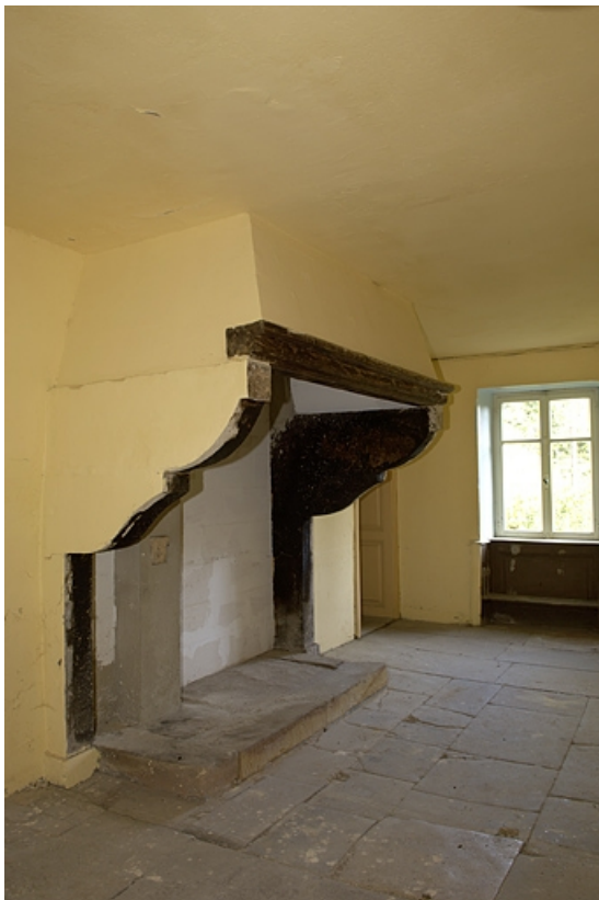
Logement. Cheminée de la cuisine.