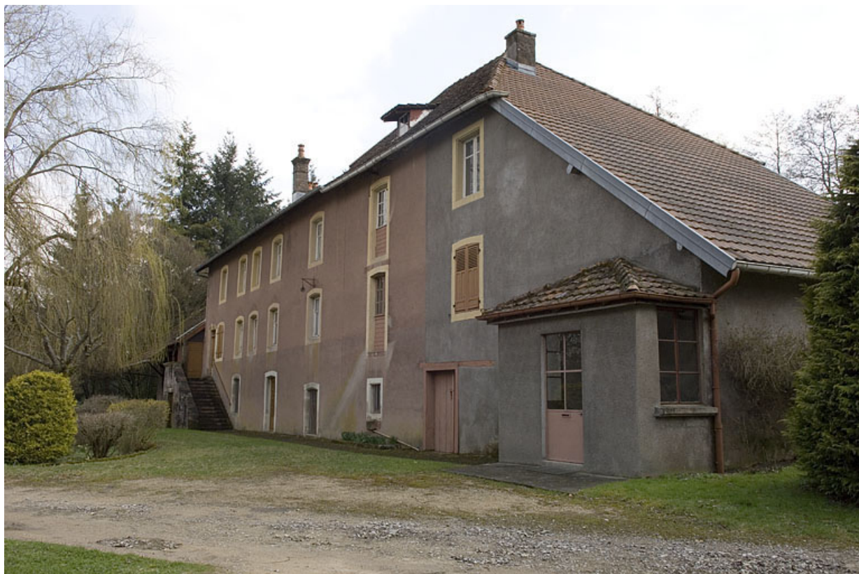
Façade antérieure depuis l'ouest.