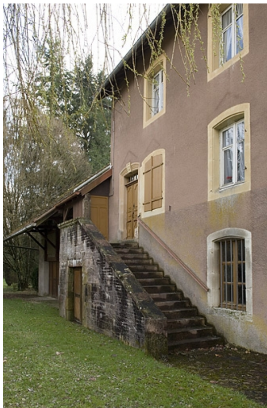
Façade antérieure. Escalier d'accès au logement.