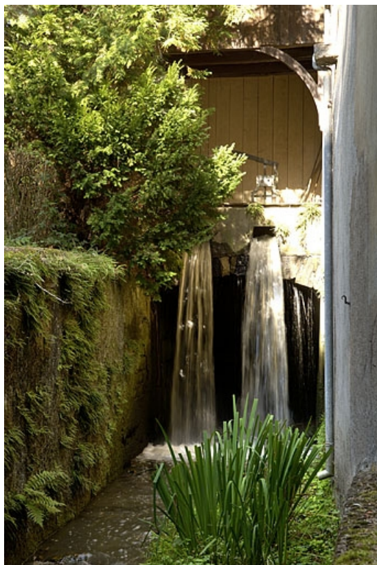
Chute d'eau du bief de dérivation.