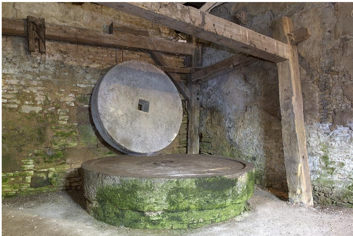
Paire de meule (ribe).