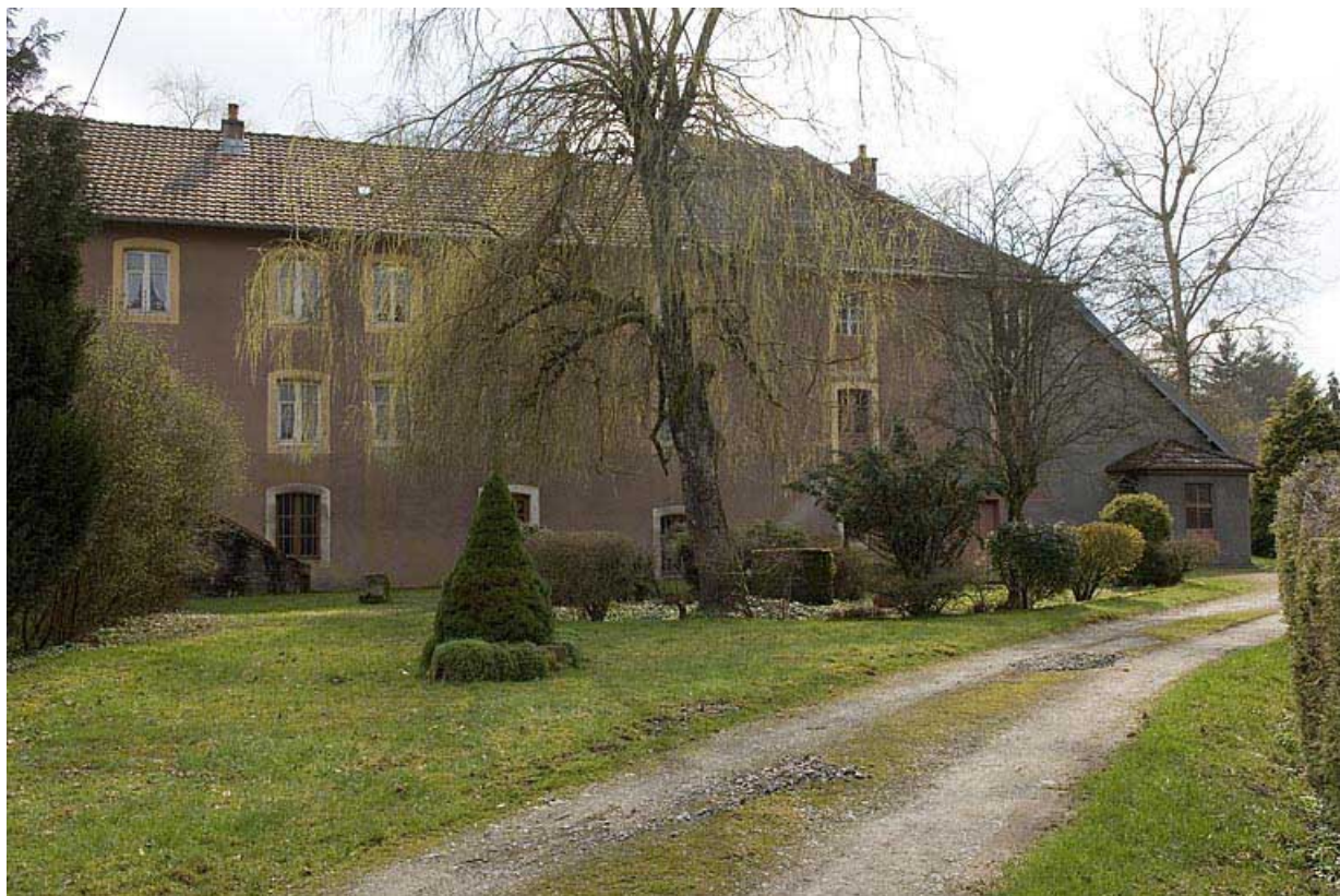
Vue d'ensemble depuis le nord.