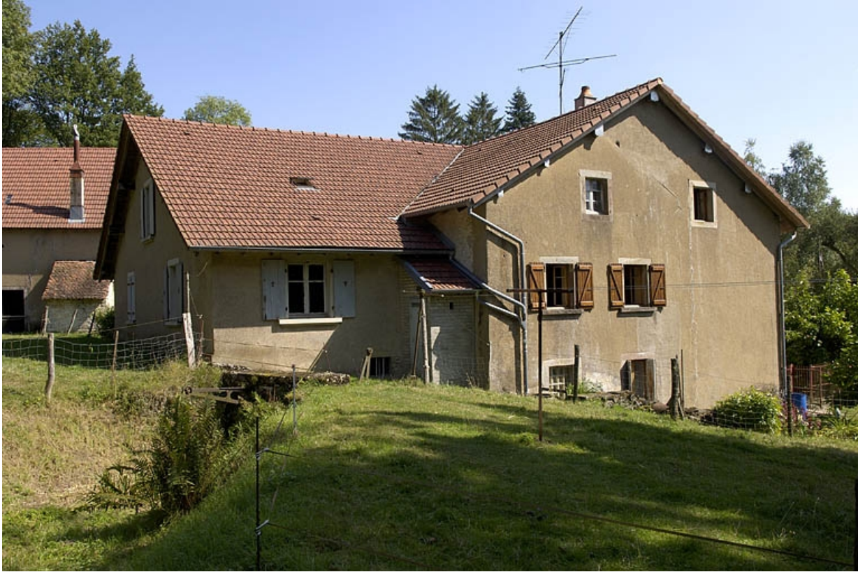
Façade ouest du moulin.

70, Coisevaux Le Moulin de la Cude, lieudit : la Cude