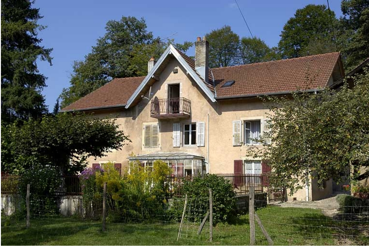
Façade sud du moulin.

70, Coisevaux Le Moulin de la Cude, lieudit : la Cude