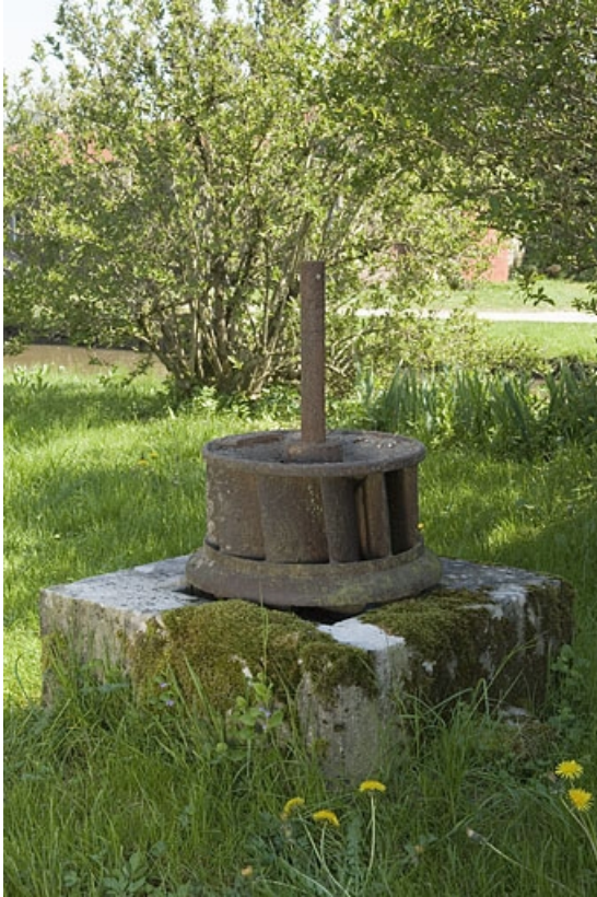
Elément de la turbine (déposé en 1980).

70, Villers-la-Ville, lieudit : le Moulin de Grand-Pierre