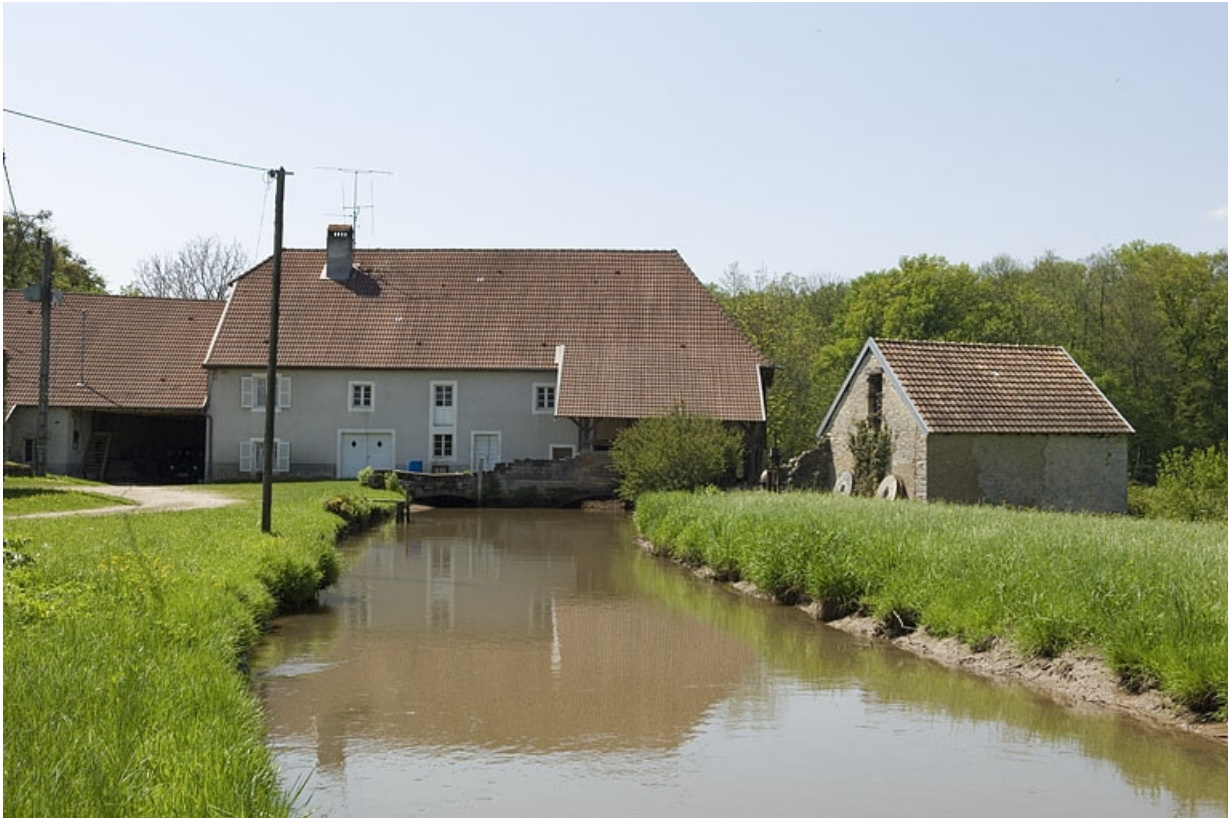
Vue d'ensemble depuis l'amont du bief.

70, Villers-la-Ville, lieudit : le Moulin de Grand-Pierre