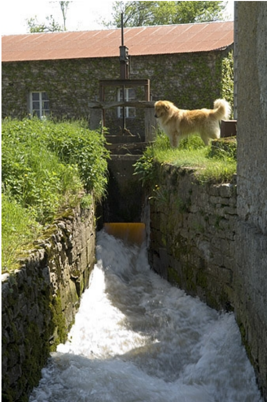
Bief d'amenée du moulin à huile.

70, Villers-la-Ville, lieudit : le Moulin de Grand-Pierre