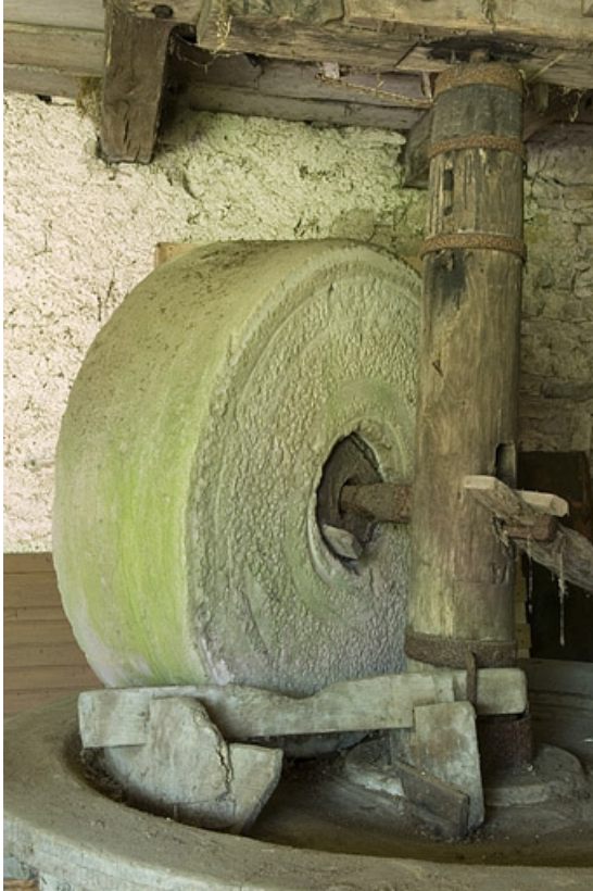
Meules à huile (ribe). Détail.

70, Villers-la-Ville, lieudit : le Moulin de Grand-Pierre