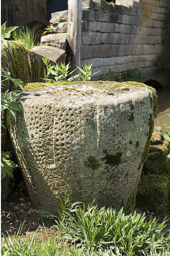
Meule déposée de la ribe (appelée poire).

70, Villers-la-Ville, lieudit : le Moulin de Grand-Pierre