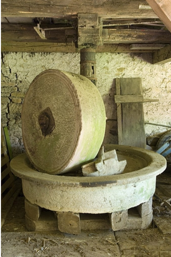
Meules à huile (ribe). Vue d'ensemble.

70, Villers-la-Ville, lieudit : le Moulin de Grand-Pierre