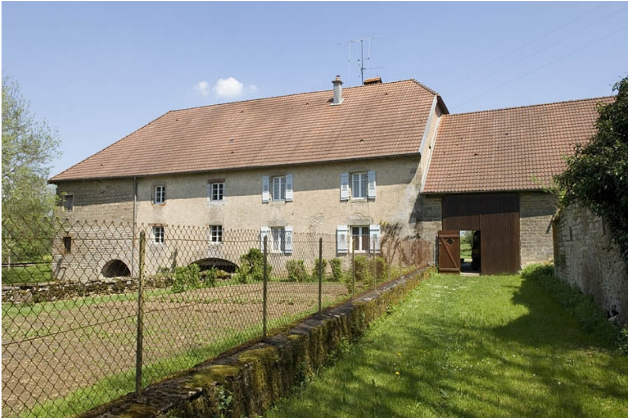
Façade postérieure du moulin.

70, Villers-la-Ville, lieudit : le Moulin de Grand-Pierre