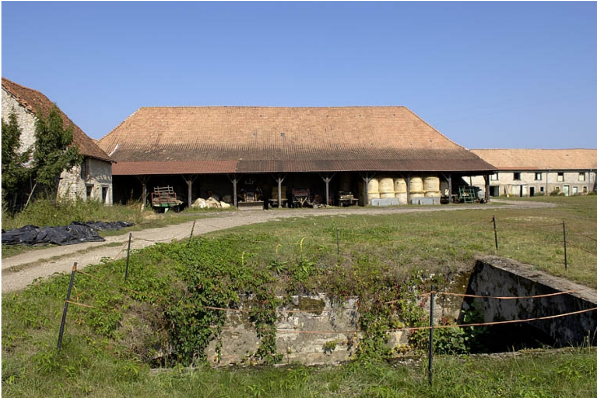
Halle à charbon vue depuis le sud.