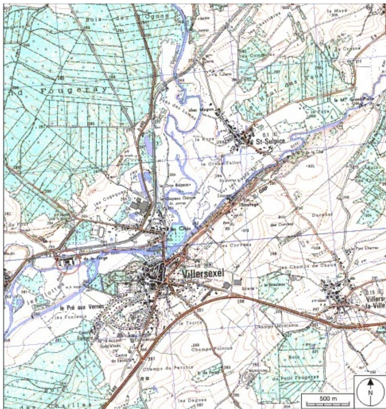
Carte de localisation. Carte topographique au 1:25000, I.G.N., Villersexel, 3421 E. Licence n°2008CISE29-68. 70, Villersexel, lieudit : la Forge