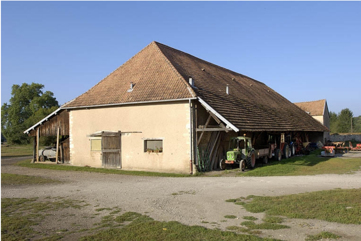
Halle à charbon vue de trois quarts.