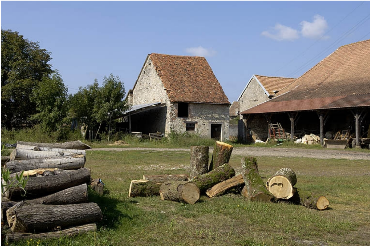
Bâtiments situés à l'ouest de la cour.