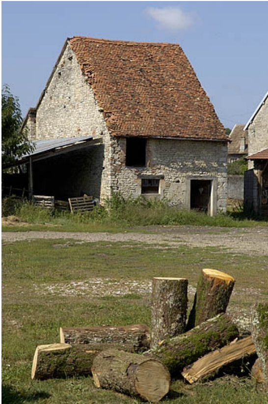
Bâtiment à usage indéterminé.