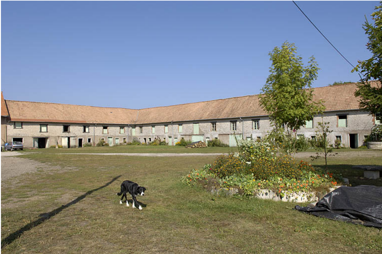
Logements ouvriers vus depuis le sud de la cour.