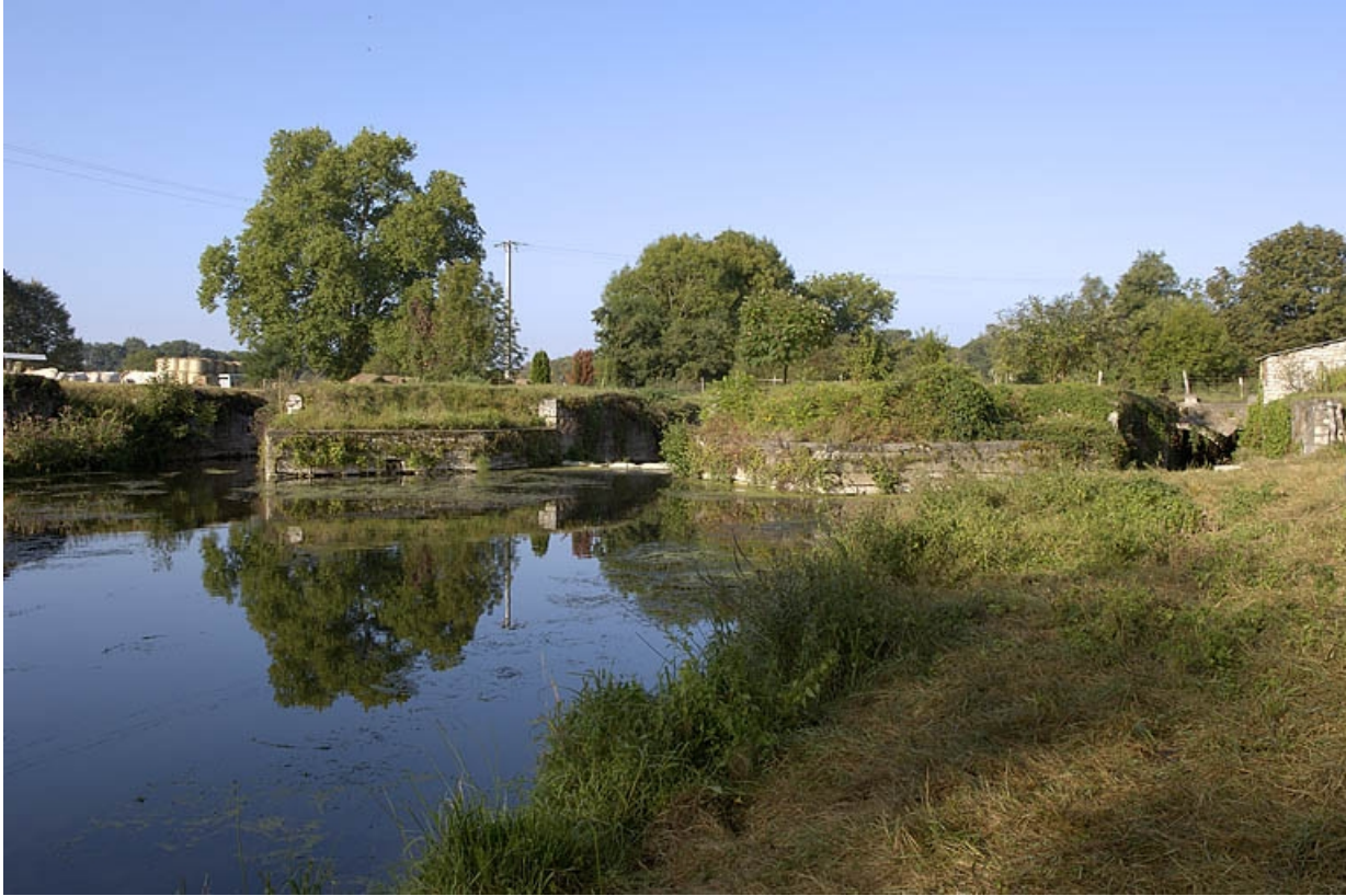
Massifs de maçonnerie, sur le bief d'amenée, où se trouvaient la forge et la fenderie. 70, Villersexel, lieudit : la Forge