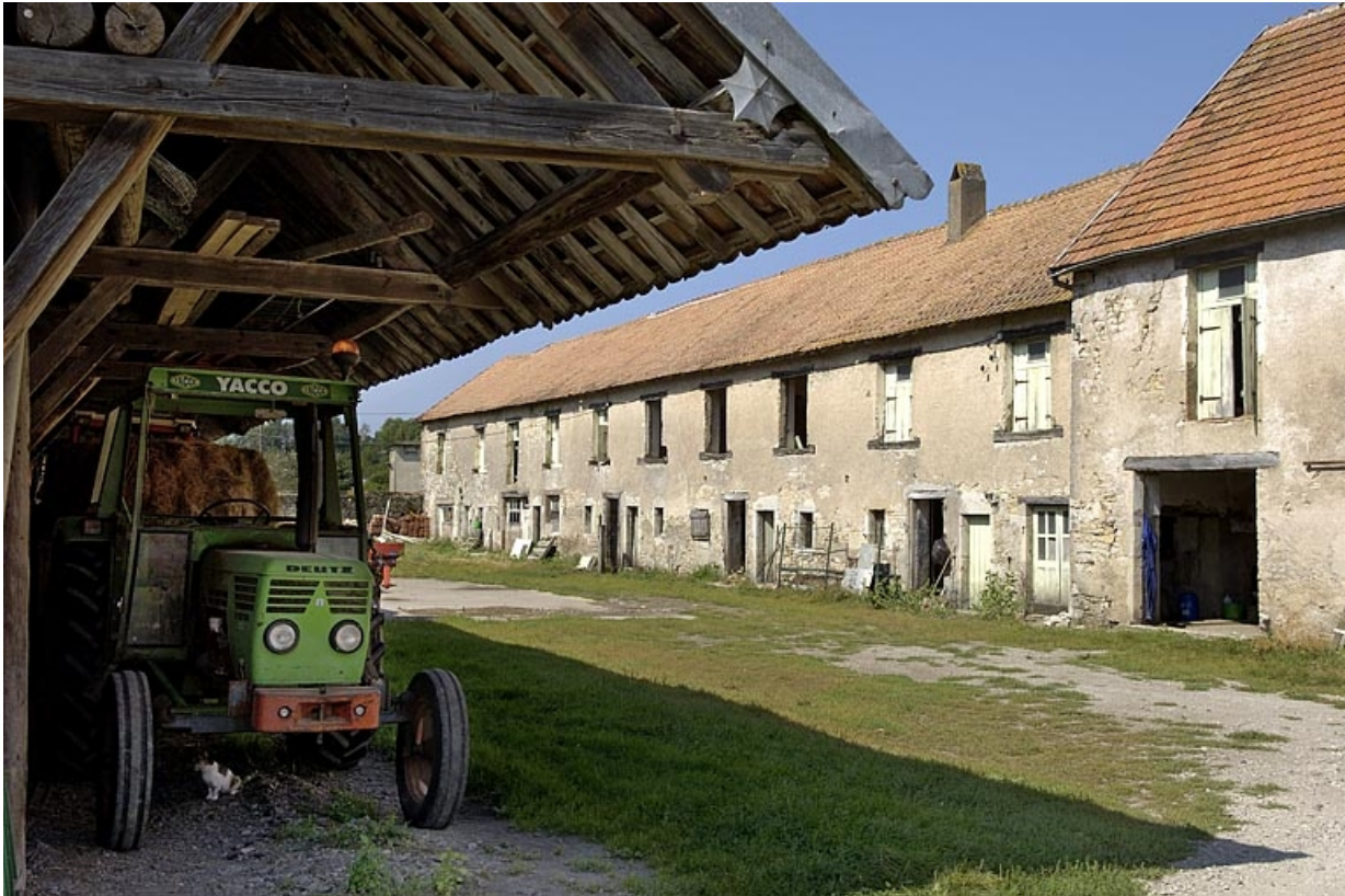
Aile ouest des logements ouvriers.