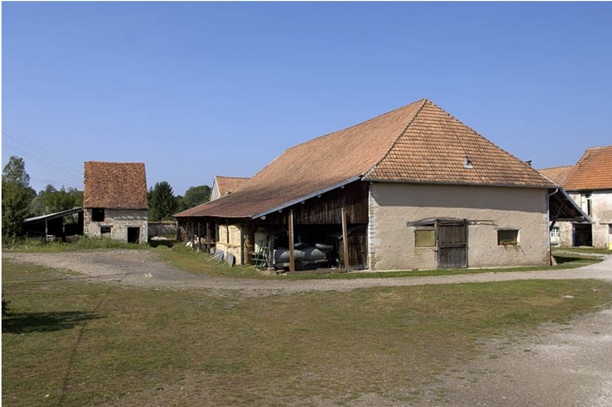
Vue depuis le sud-ouest de la cour.