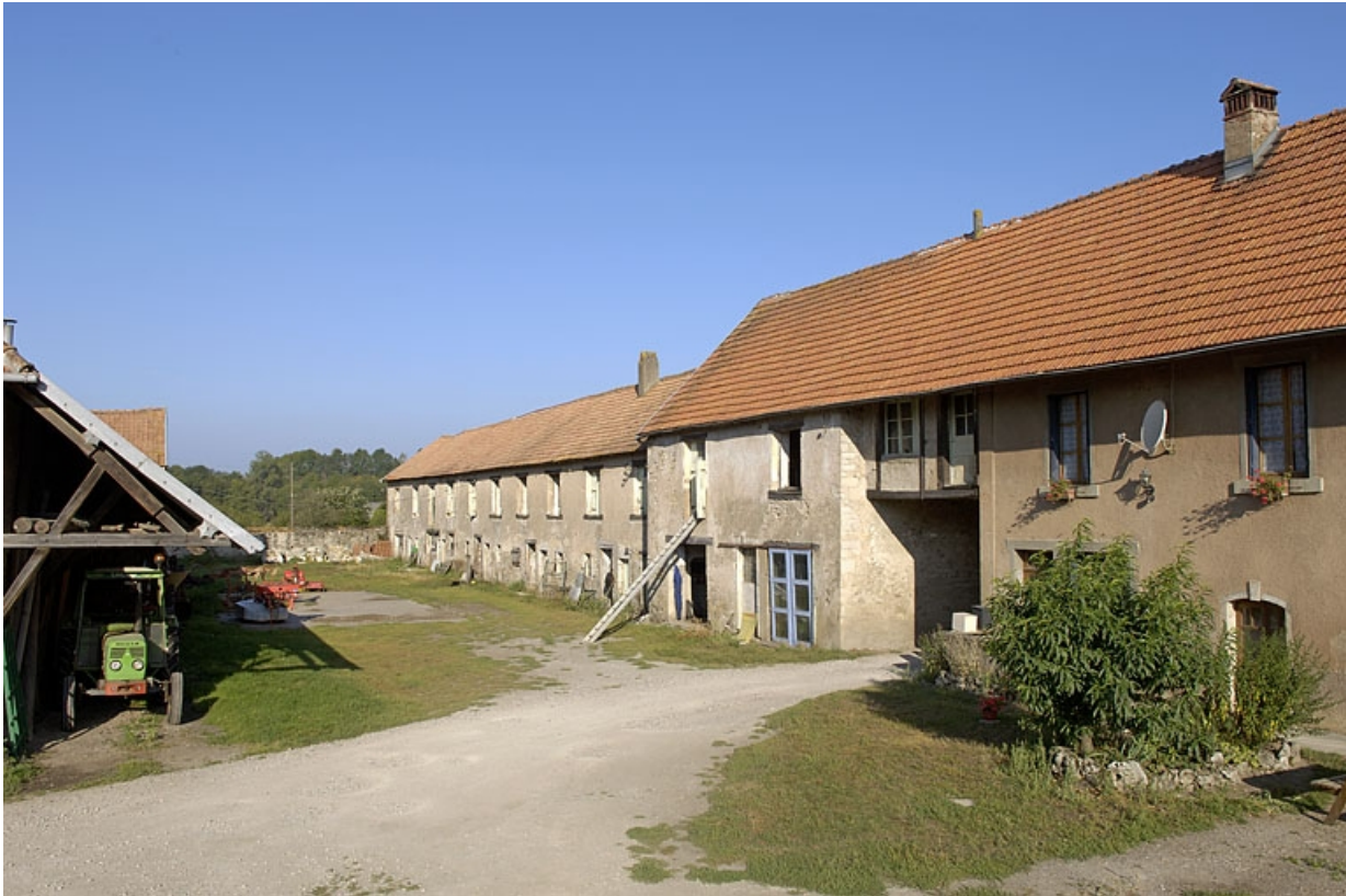
Logements ouvriers ouest et entrée depuis la cour.