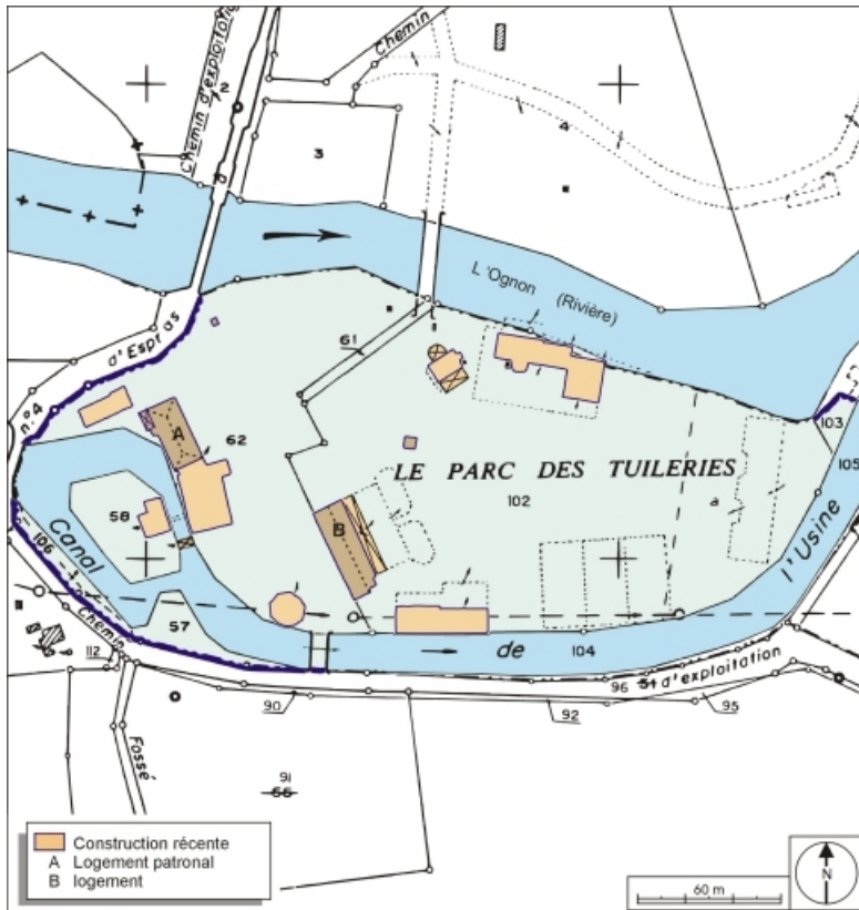
Plan-masse et de situation. Extrait du plan cadastral numérisé, 2006, section ZB, 1:1200. 70, Pont-sur-l'Ognon R.D. 89, lieudit : les Tuileries