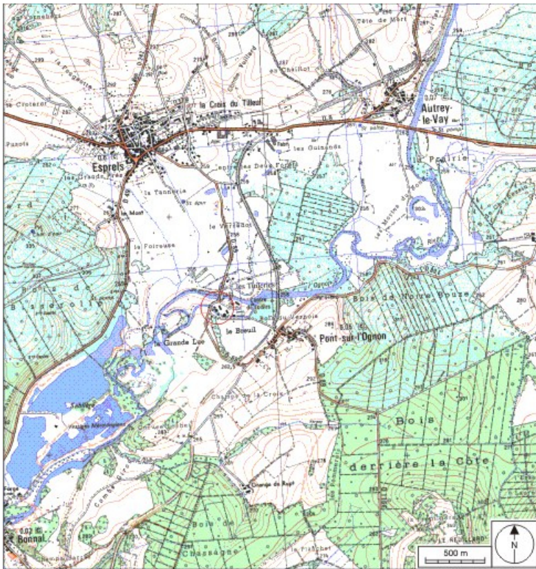
Carte de localisation. Carte topographique au 1:25000, I.G.N., Villersexel, 3421 E. SCAN 25, Licence n°2008CISE29-68. 70, Pont-sur-l'Ognon R.D. 89, lieu-dit : les Tuileries