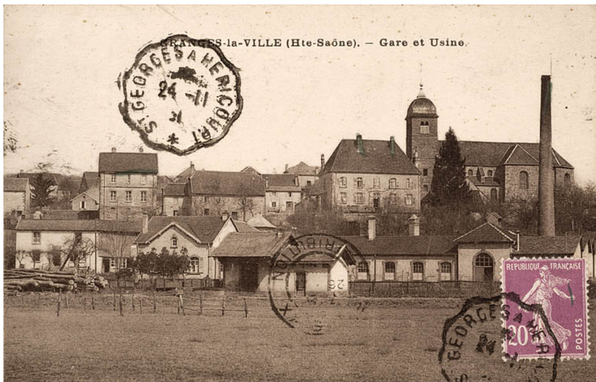
Granges-la-ville (Haute-Saône) - Gare et usine.