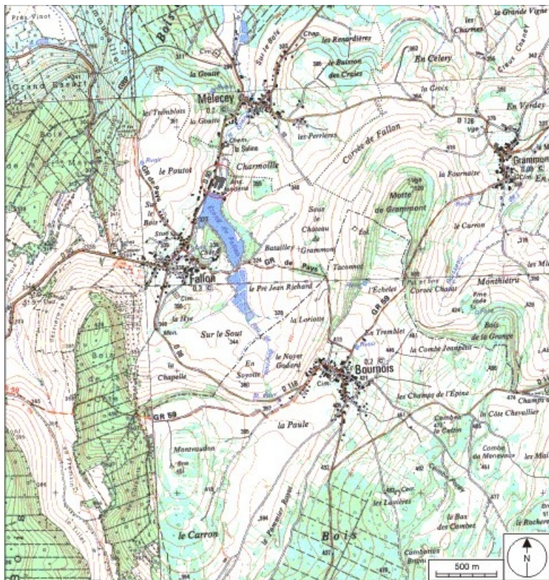
Carte de localisation. Carte topographique au 1:25000, I.G.N., L'Isle-sur-le-Doubs, 3522 O. SCAN 25 © IGN - 2008, Licence n°2008CISE29-68.