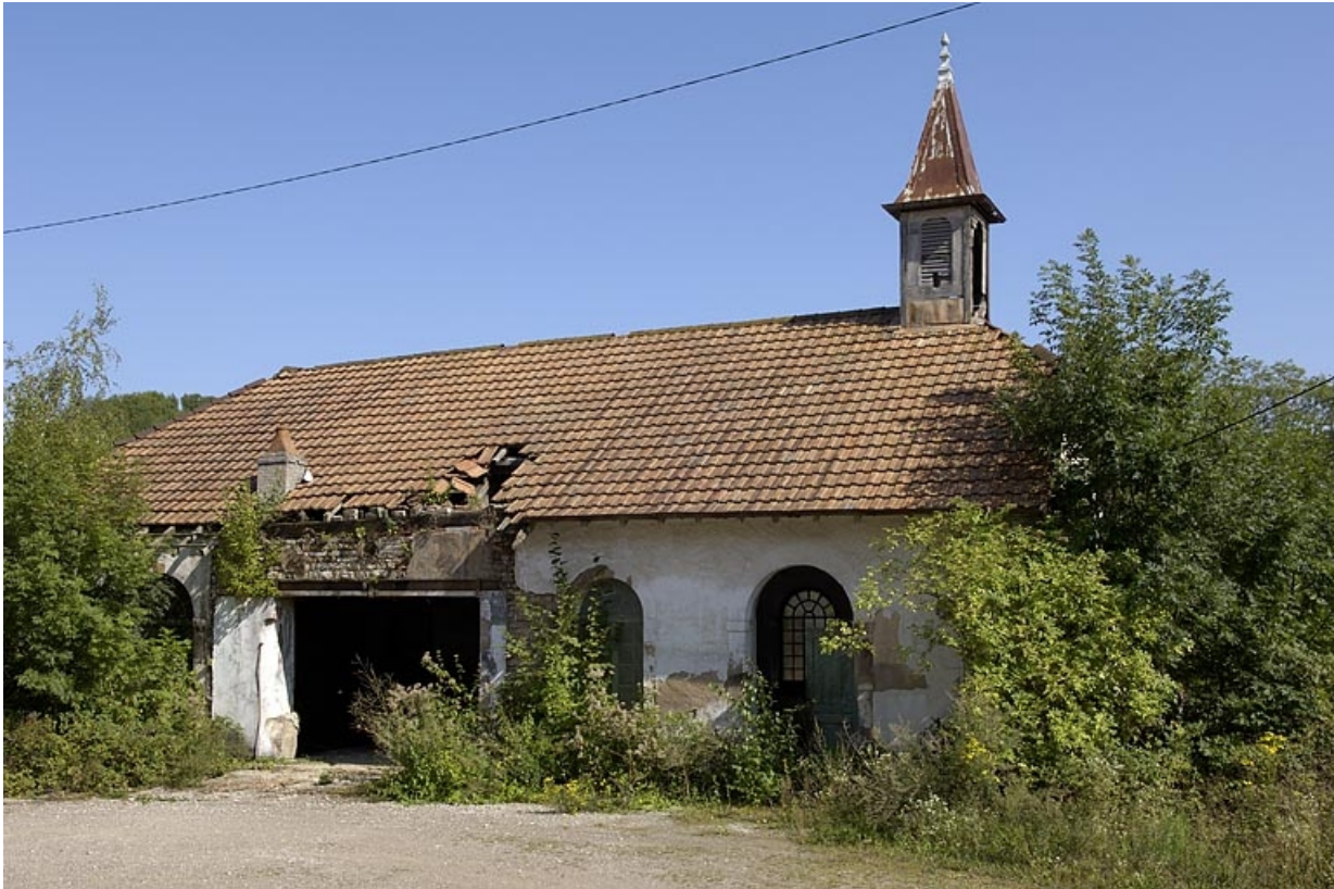
Salle des machines et atelier de réparation. 70, Fallon R.D. 90