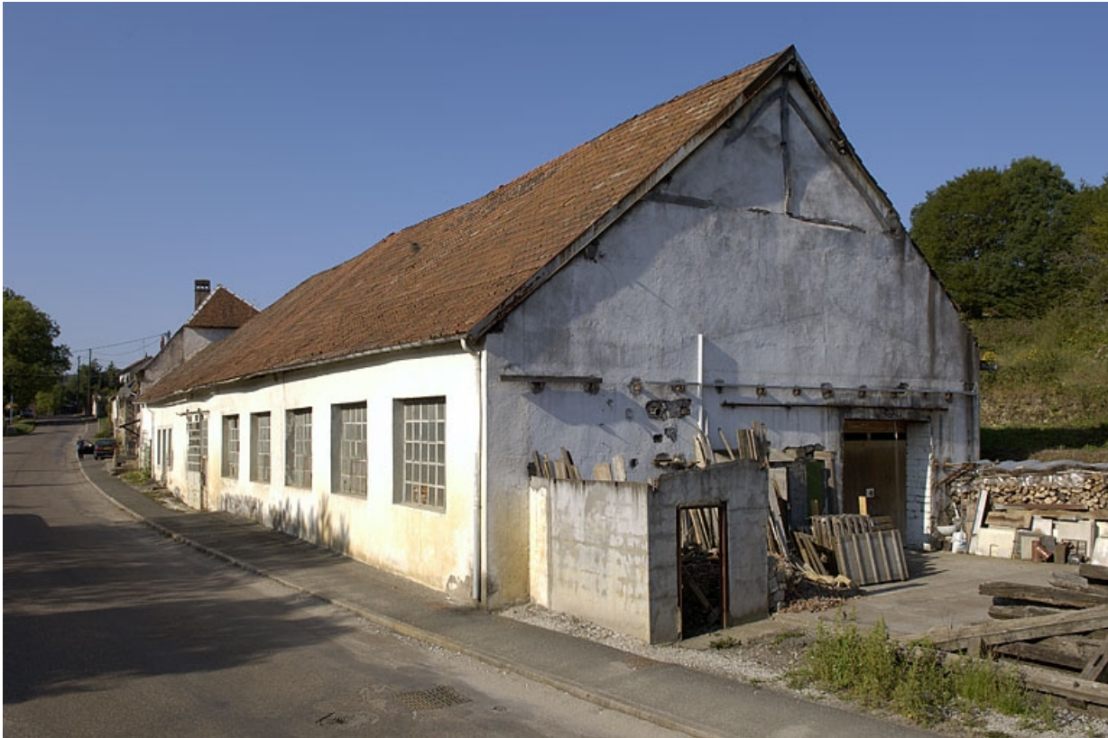
Ancienne halle à charbon.