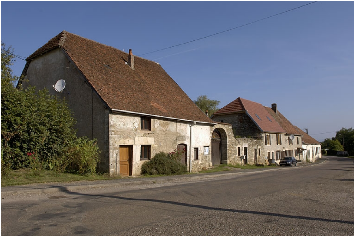
Logements ouvriers vus depuis le sud-est.