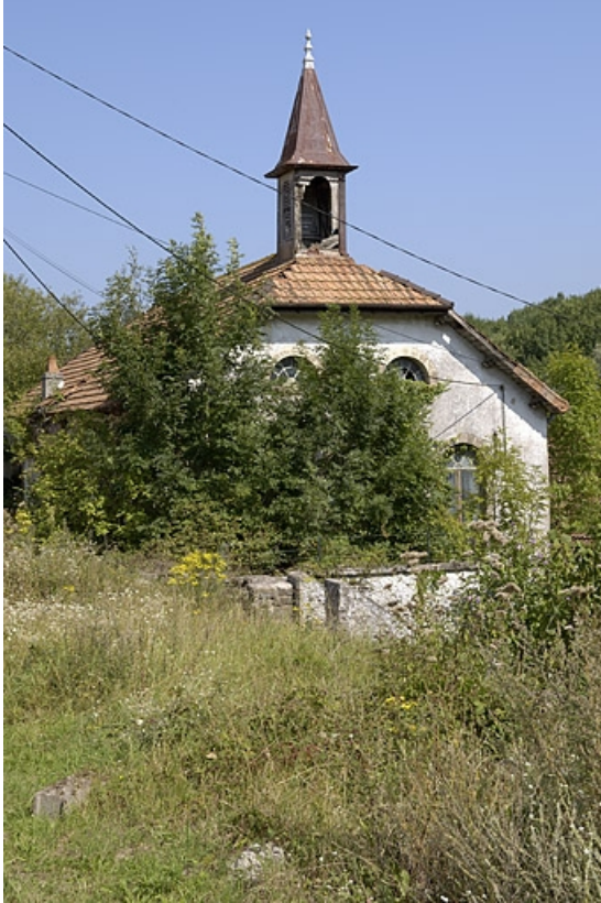
Salle des machines et atelier de réparation vus depuis le sud.