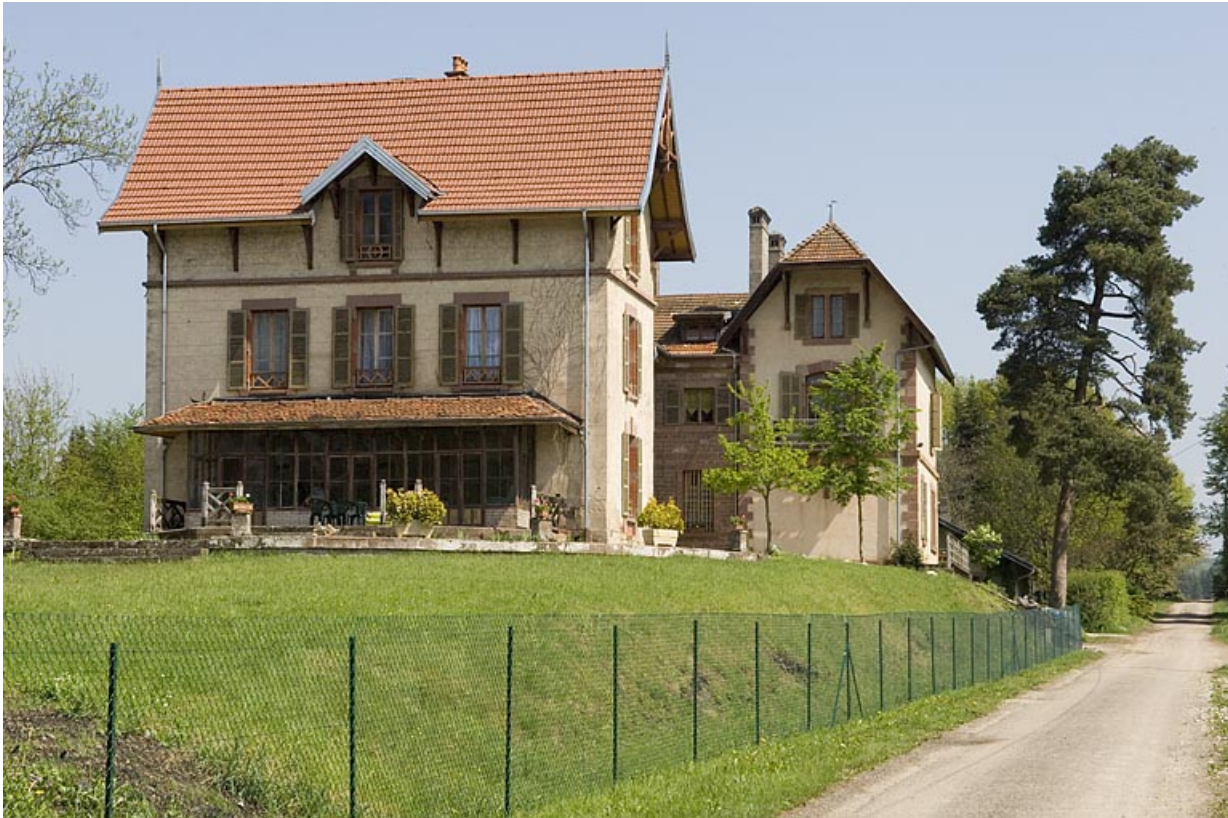
Le rendez-vous de chasse depuis le sud.

70, Athesans-Étroitefontaine, lieudit : Saint-Georges