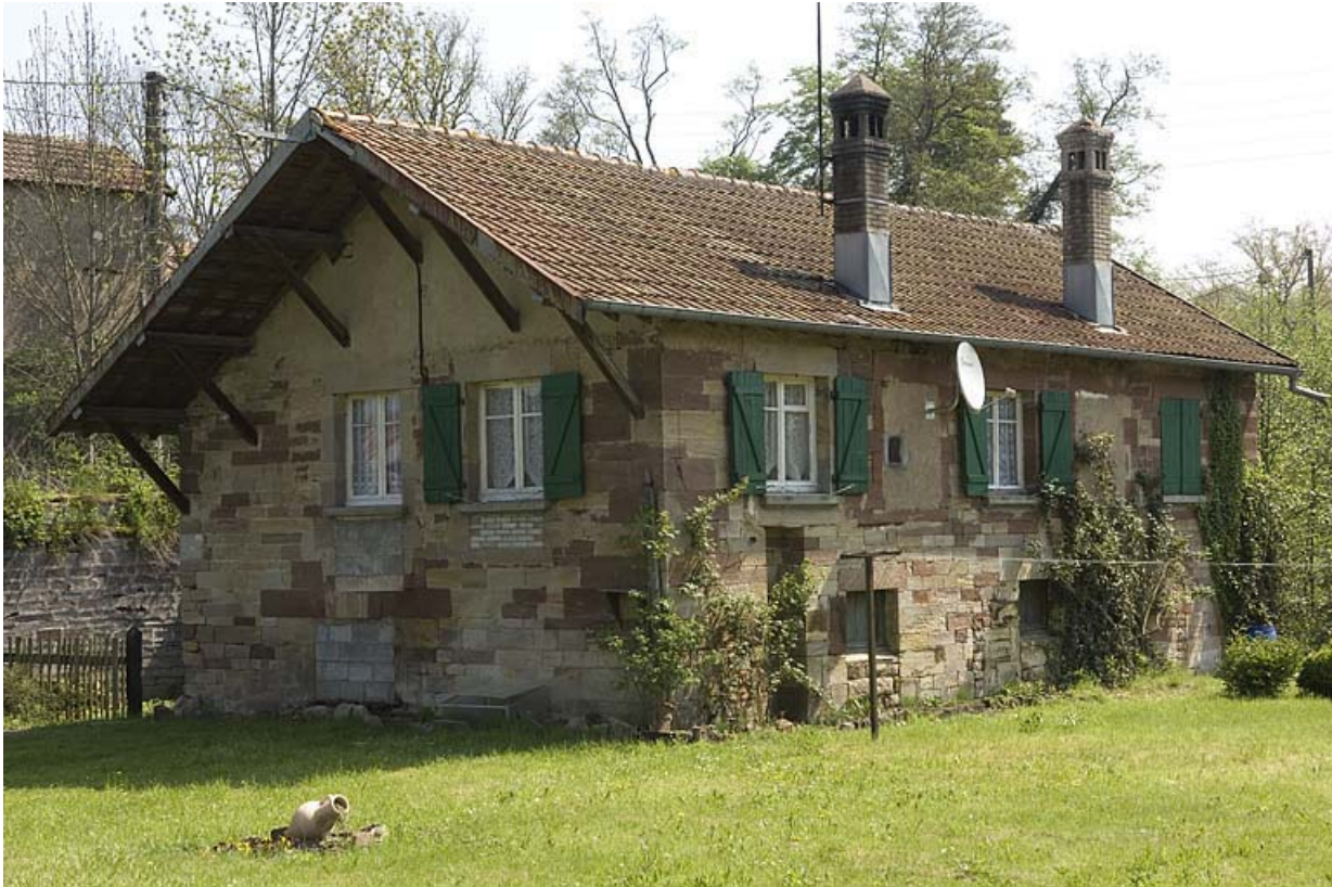
Logement construit à l'emplacement de l'ancienne forge.

70, Athesans-Étroitefontaine, lieudit : Saint-Georges