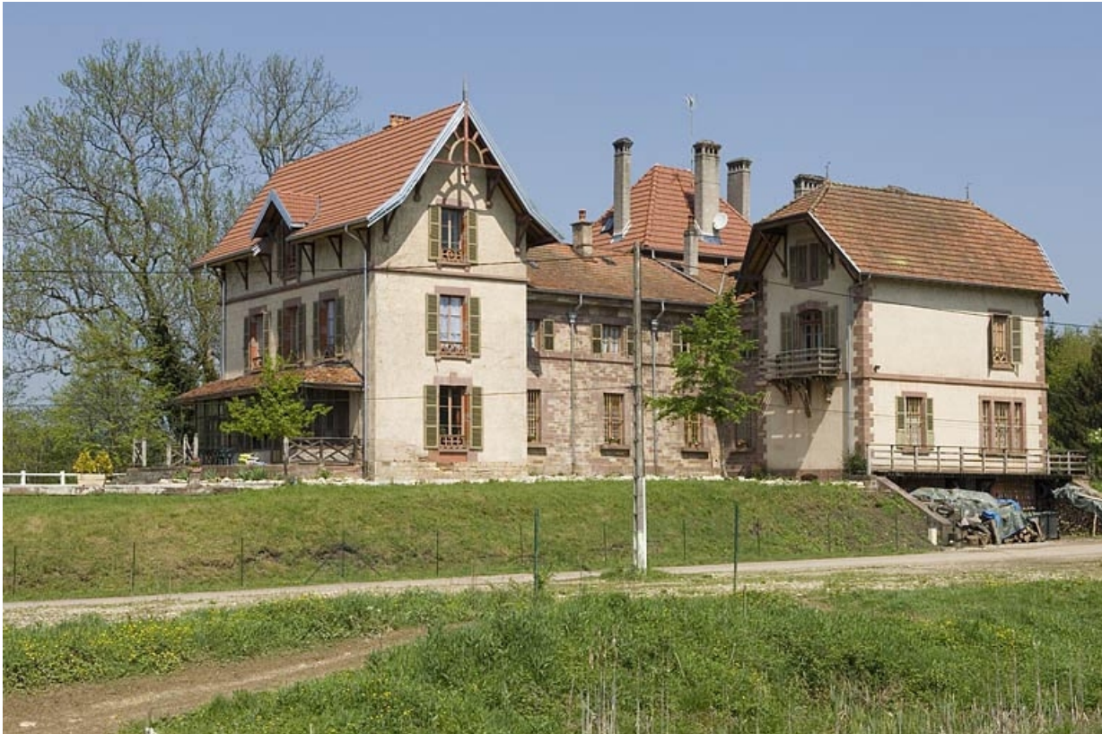
Vue d'ensemble du rendez-vous de chasse.

70, Athesans-Étroitefontaine, lieudit : Saint-Georges