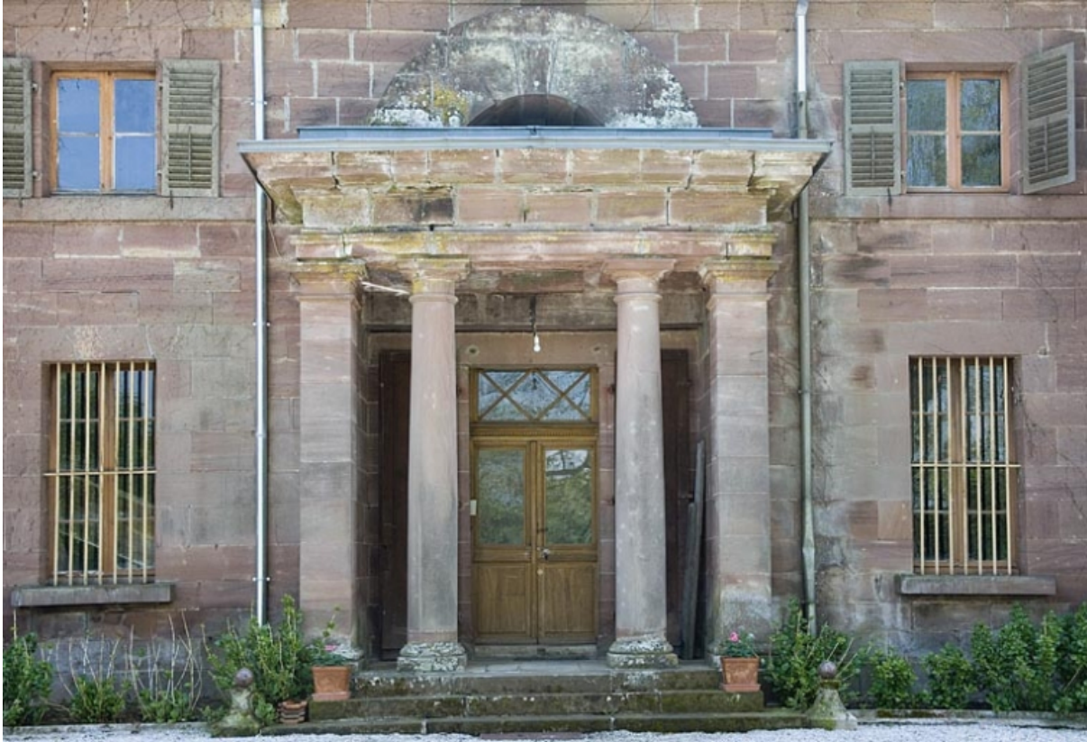
Rendez-vous de chasse. Détail de la façade postérieure.

70, Athesans-Étroitefontaine, lieudit : Saint-Georges