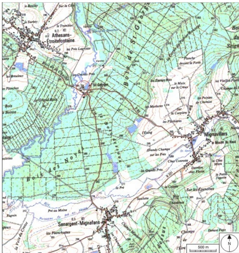
Carte de localisation. Carte topographique au 1:25000, I.G.N., Lure, 3521 O. 70, Athesans-Étroitefontaine, lieu-dit : Saint-Georges