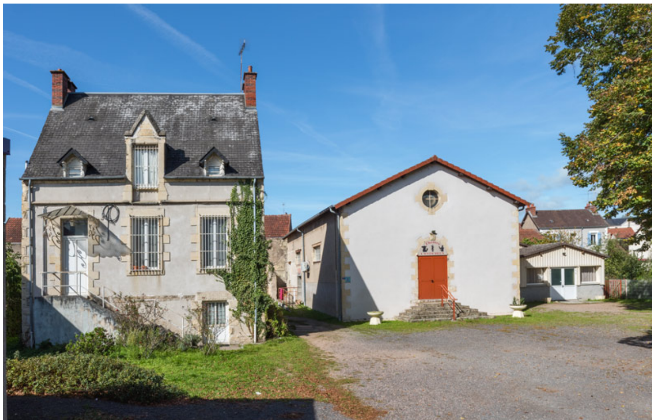
Vue d'ensemble, depuis le sud. A gauche, l'ancien presbytère.