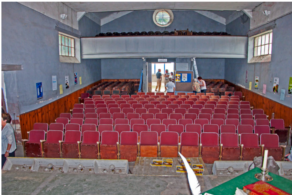
[Salle et balcon, depuis la scène, avant restauration]. S.d. [entre 2006 et 2014]. 58, Imphy, 3 rue de la Cure