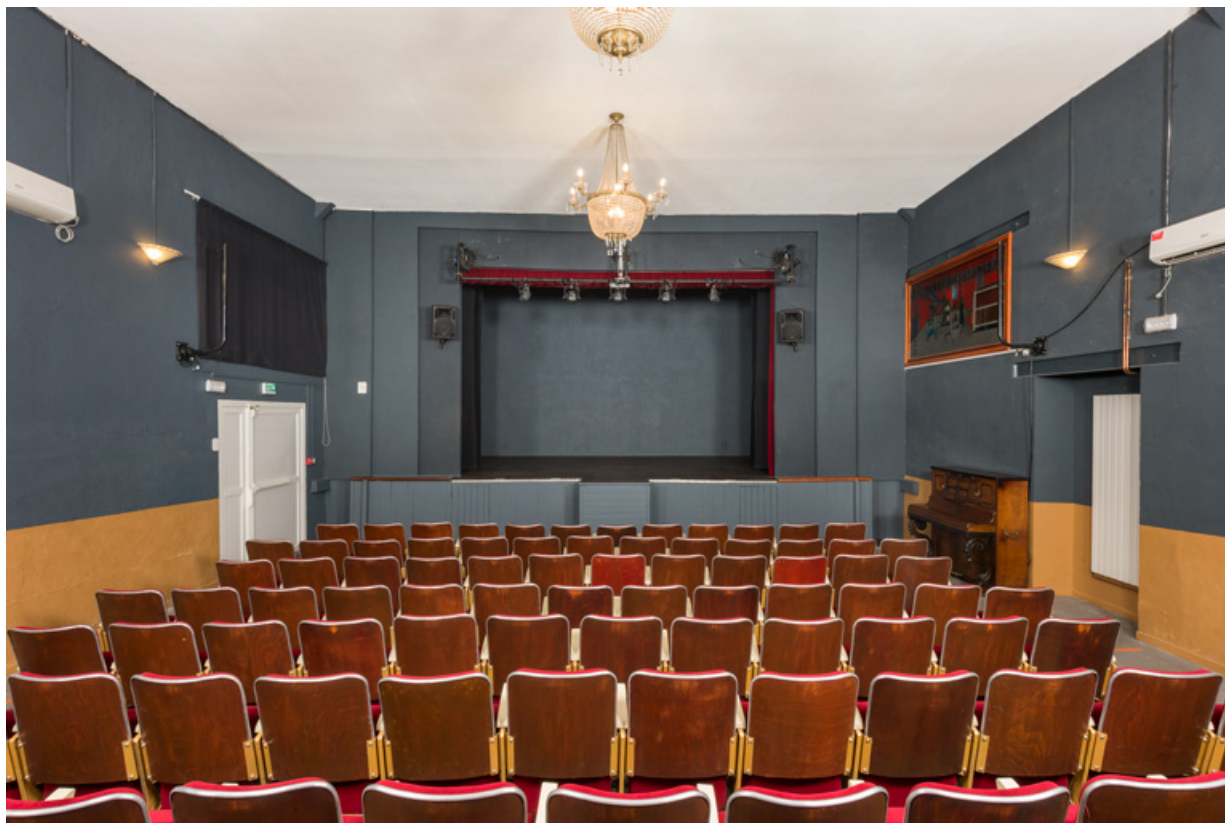
La scène, depuis le fond de la salle.