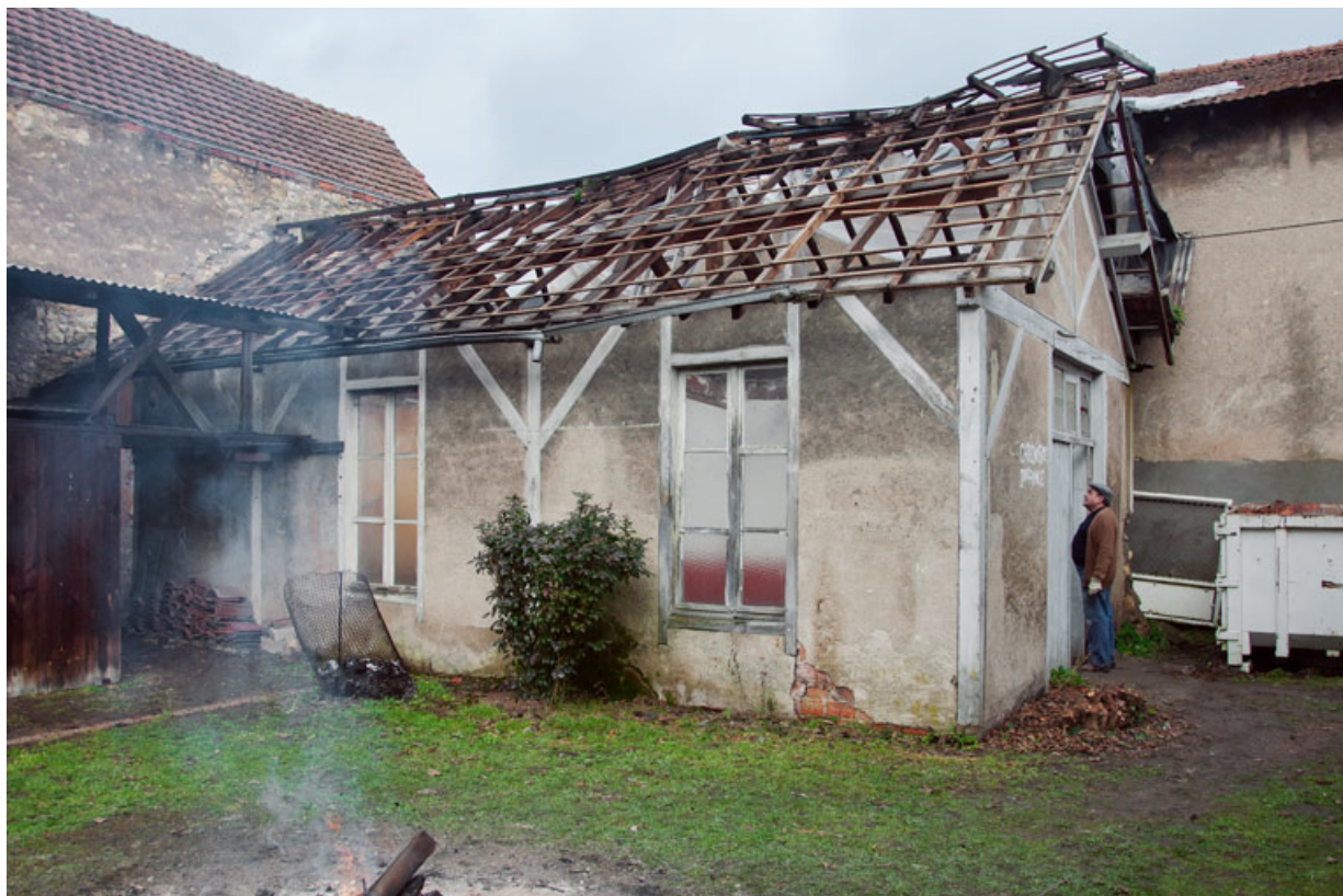
[Destruction de l'annexe (ancienne salle de catéchisme et chapelle privée)]. S.d. [entre 2006 et 2014]. 58, Imphy, 3 rue de la Cure