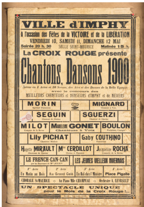
Affiche pour un spectacle dans la salle Saint-Maurice du 10 au 12 mai 1946. 58, Imphy, 3 rue de la Cure