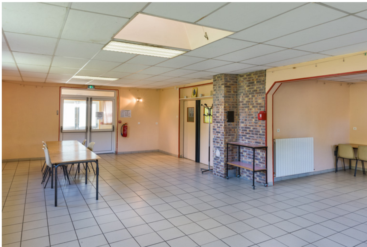
Ancienne salle paroissiale (actuelle salle Parent).