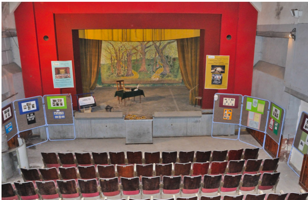
[Vue plongeante sur la scène depuis le balcon, avant restauration]. S.d. [entre 2006 et 2014]. Le décor de fond est en place. 58, Imphy, 3 rue de la Cure