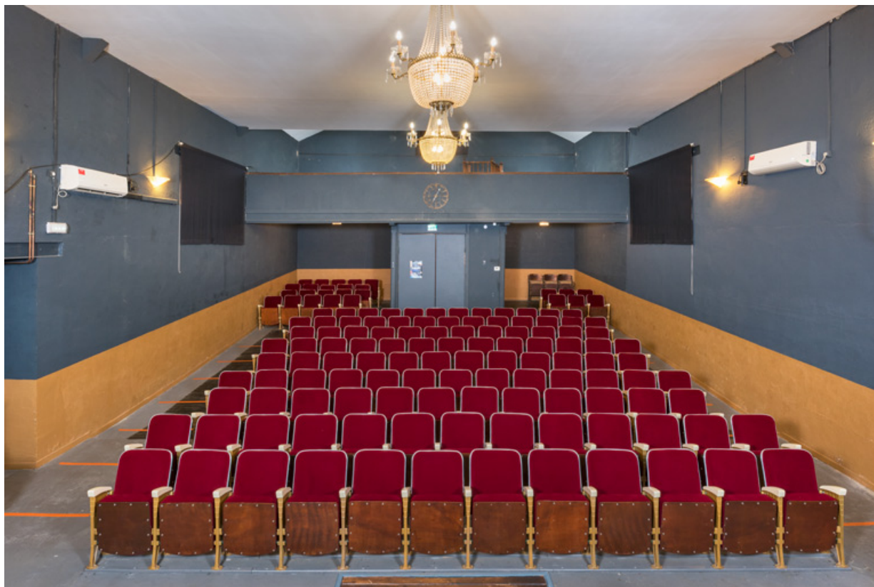
Nièvre, Imphy. Salle paroissiale Saint-Maurice, théâtre de L'Entr'Deux : la salle. 58, Imphy, 3 rue de la Cure