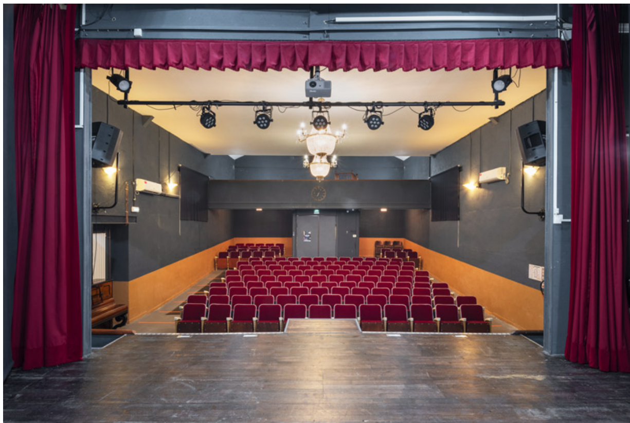
La salle, depuis le fond de la scène.