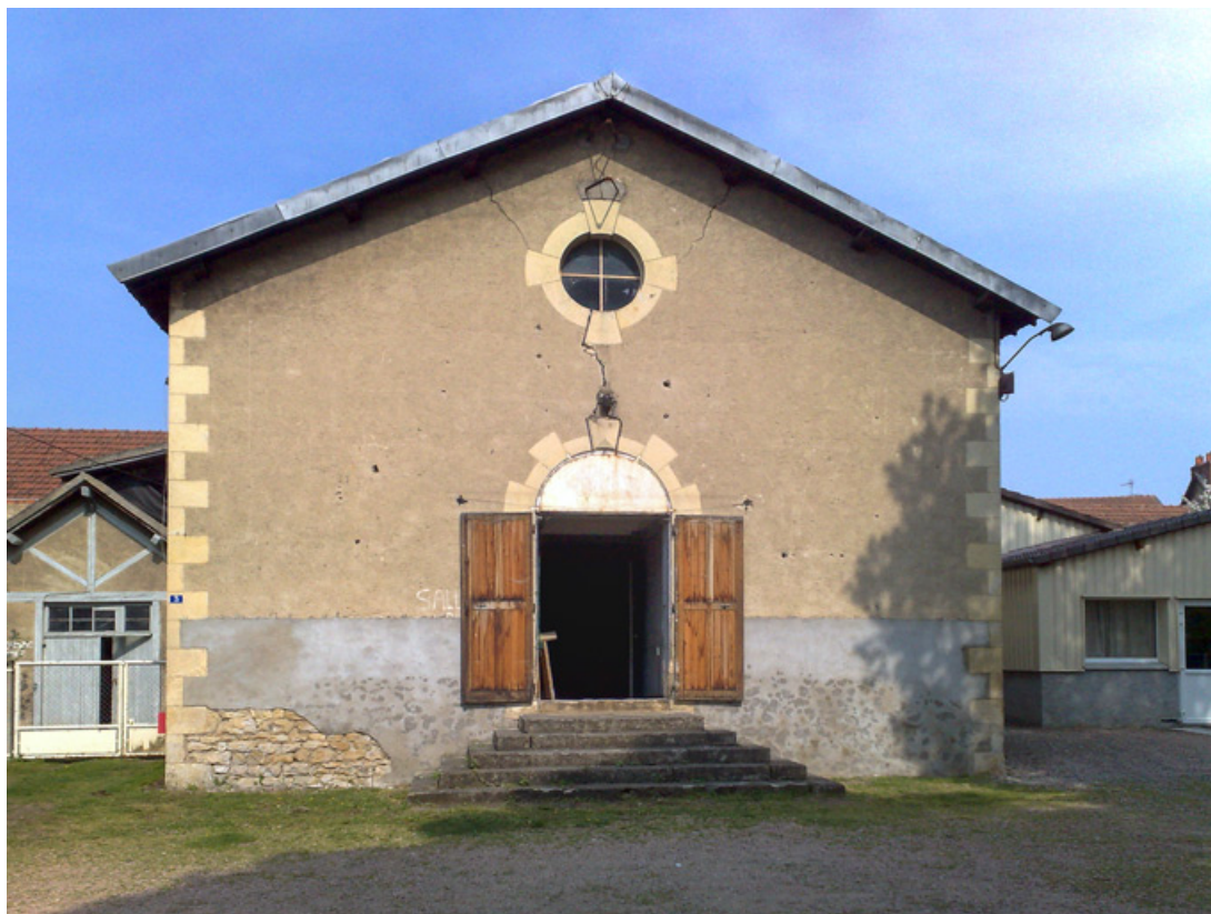
[Façade antérieure avant restauration]. S.d. [entre 2006 et 2014].