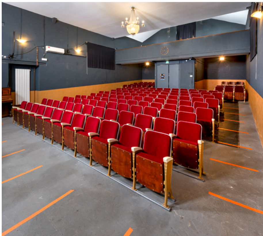
La salle depuis la scène, de trois quarts.