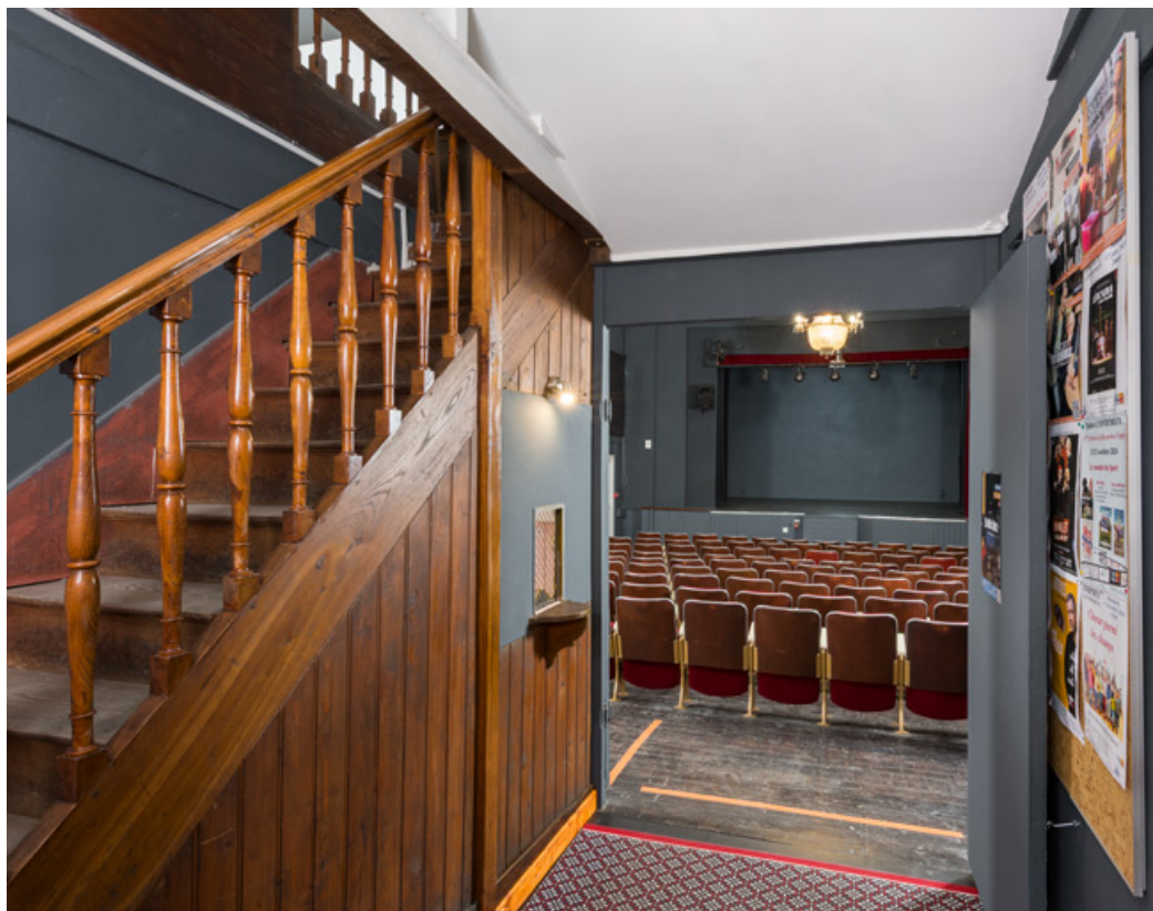
Vestibule. A gauche, l'escalier conduisant au balcon.