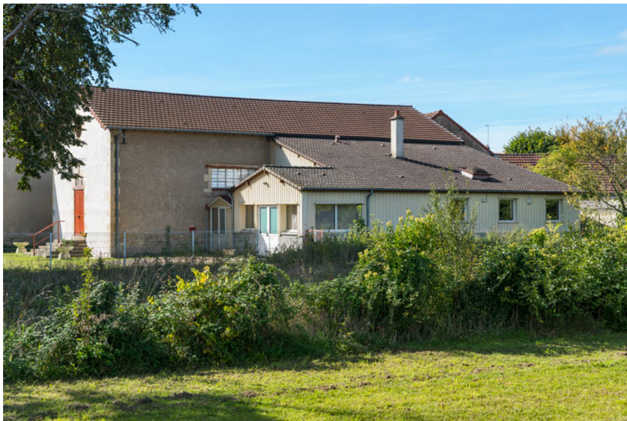
Façade latérale droite, de trois quarts gauche.