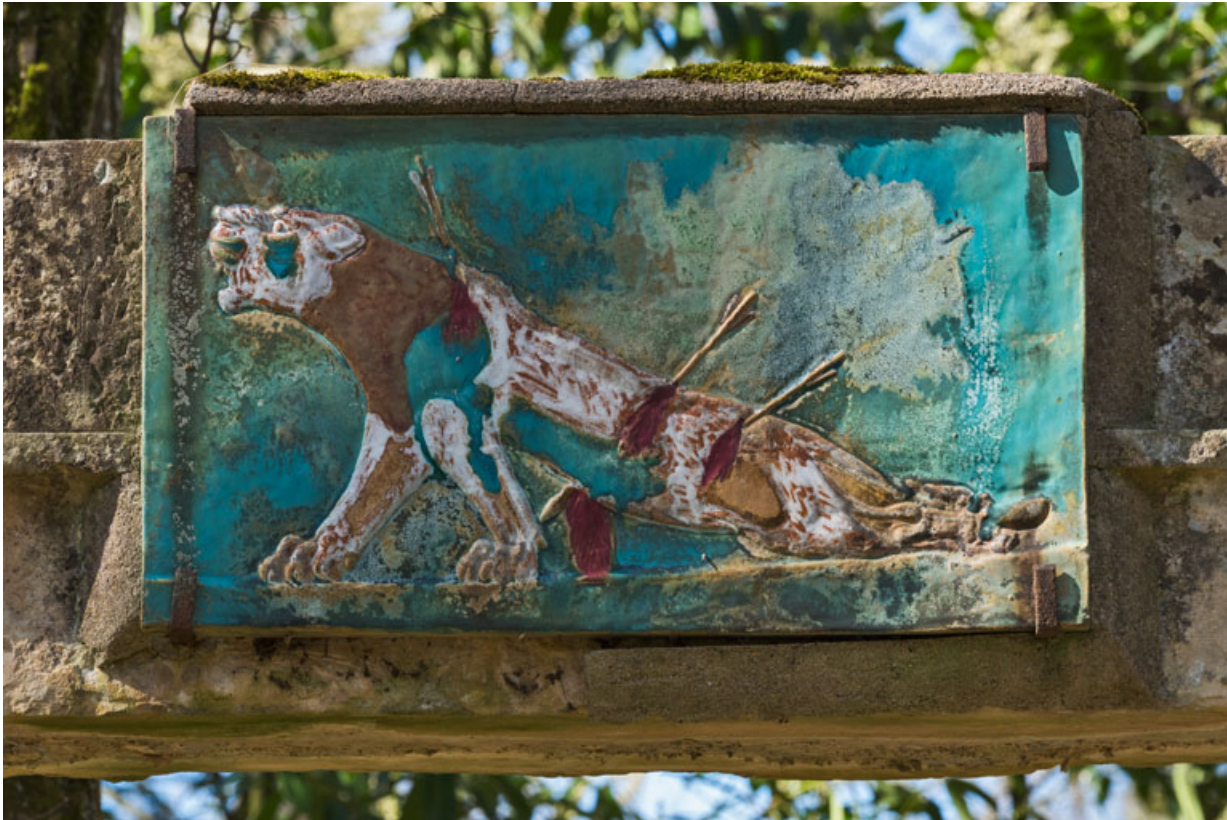
Plaque en céramique : La Lionne blessée, d'après un relief assyrien.

58, Pougues-les-Eaux, 130 avenue de Paris, lieudit : La Montjaie