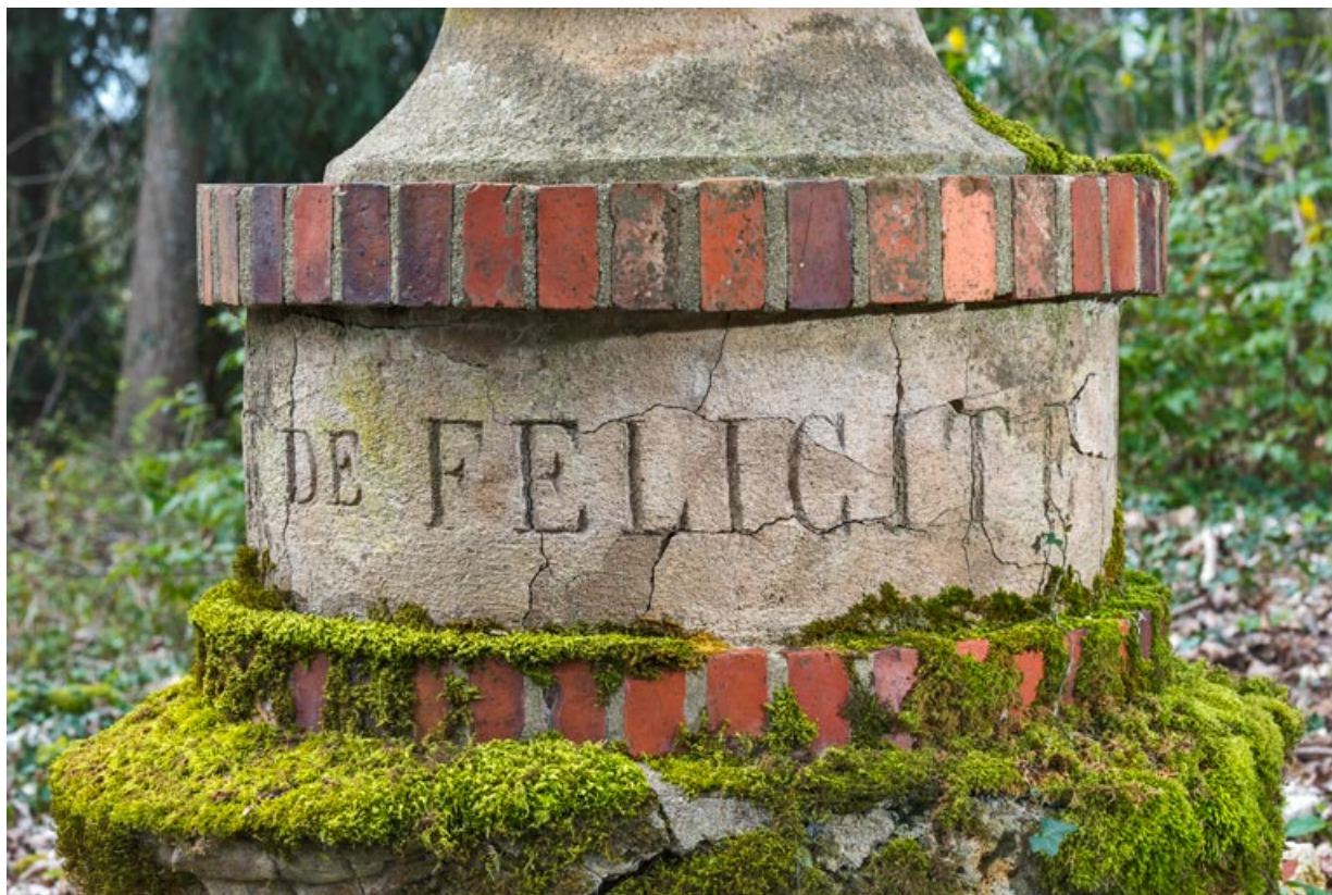
Base, détail : "DE FELICITE".

58, Pougues-les-Eaux, 130 avenue de Paris, lieudit : La Montjaie