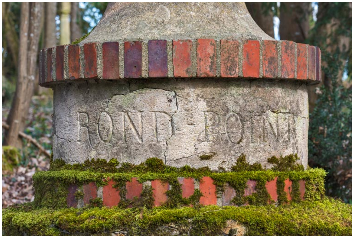
Base, détail : "ROND-POINT".

58, Pougues-les-Eaux, 130 avenue de Paris, lieudit : La Montjaie