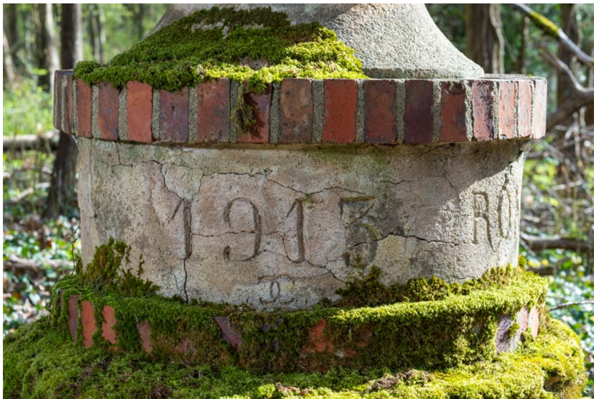
Base, détail : 1913.

58, Pougues-les-Eaux, 130 avenue de Paris, lieudit : La Montjaie