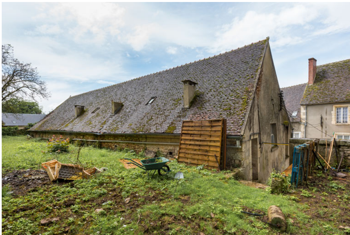
Façades postérieure et latérale gauche.