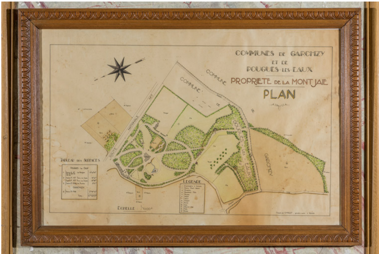
Localisation des "ruines" (9) sur un plan levé en 1912-1913. 58, Pougues-les-Eaux, 130 avenue de Paris, lieudit : La Montjaie