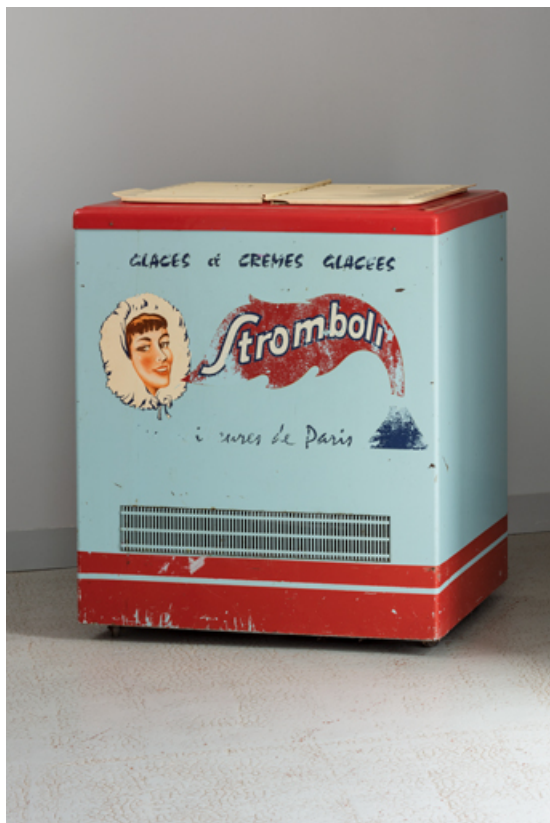
Vestibule : congélateur avec une publicité pour les glaces Stromboli.

58, Saint-Honoré-les-Bains, 18 rue Henri Renaud