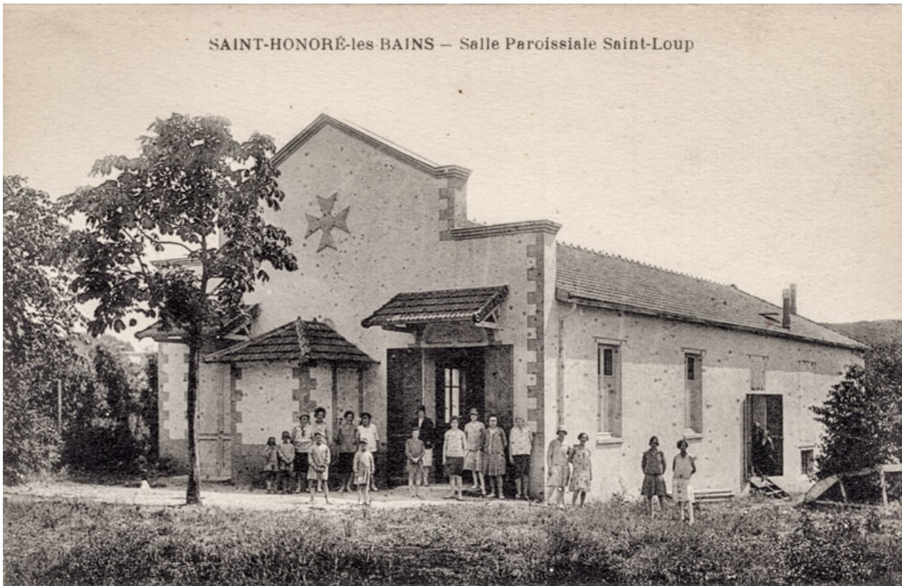
Saint-Honoré-les-Bains - Salle paroissiale Saint-Loup [extérieur]. S.d. [milieu 20e siècle].

58, Saint-Honoré-les-Bains, 18 rue Henri Renaud