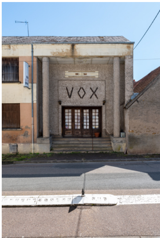
Façade antérieure : entrée avec enseigne.

58, La Machine, 26 rue Louis Henri Roblin