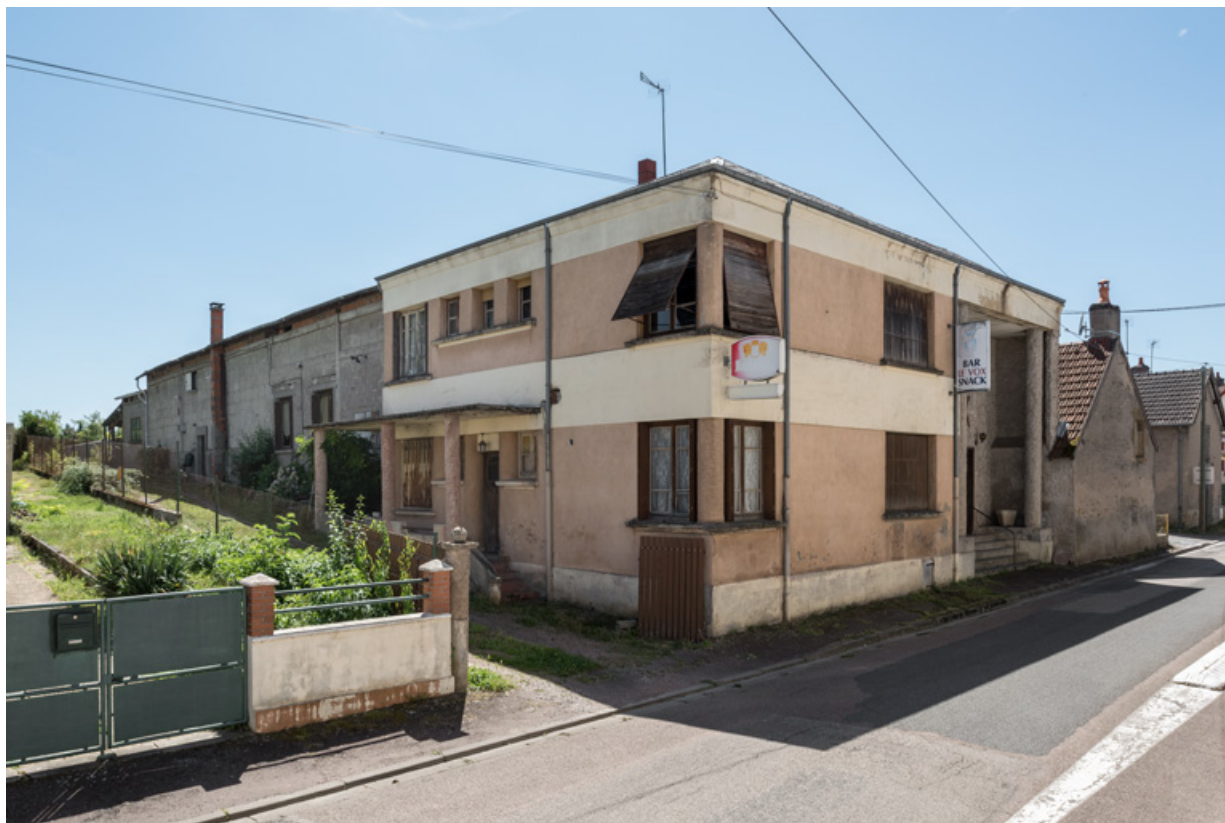
Vue d'ensemble, depuis le nord-est.

58, La Machine, 26 rue Louis Henri Roblin