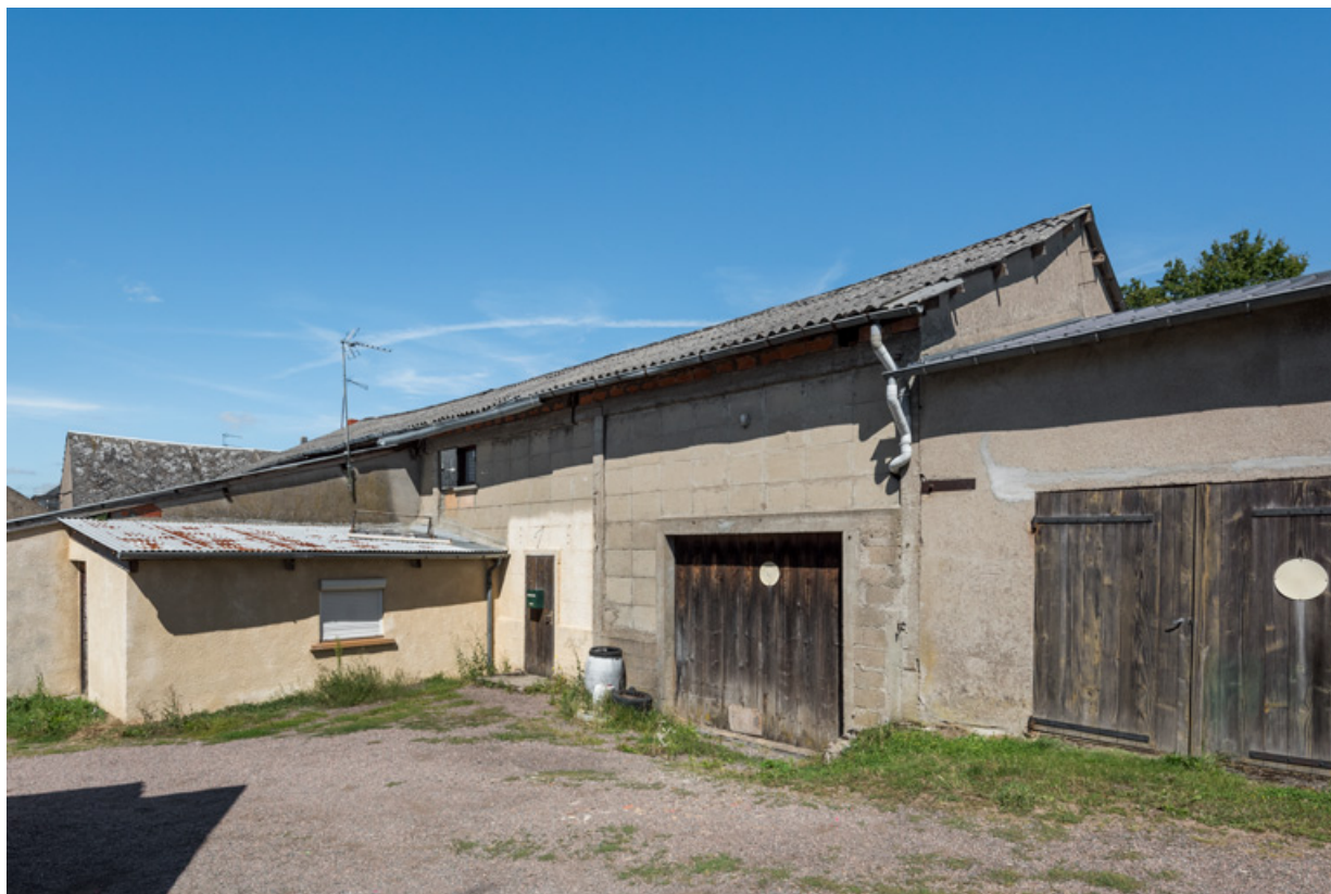
Façades latérale droite et postérieure (la salle).

58, La Machine, 26 rue Louis Henri Roblin