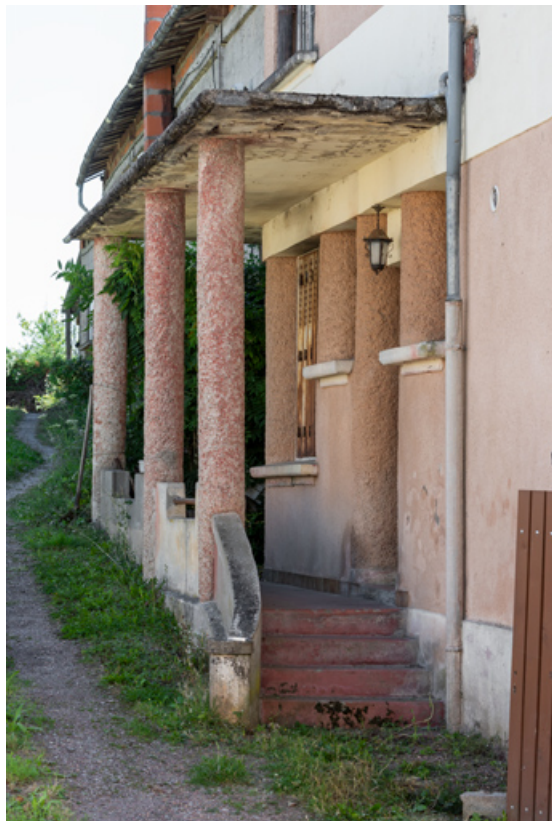
Façade latérale gauche : escalier couvert.

58, La Machine, 26 rue Louis Henri Roblin