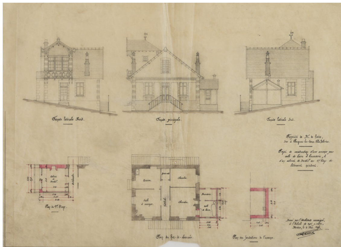
Projet de cabinet de travail dans la lucarne pignon à construire au-dessus de la cuisine, plans et élévations. 58, Pougues-les-Eaux, 93 avenue de Paris