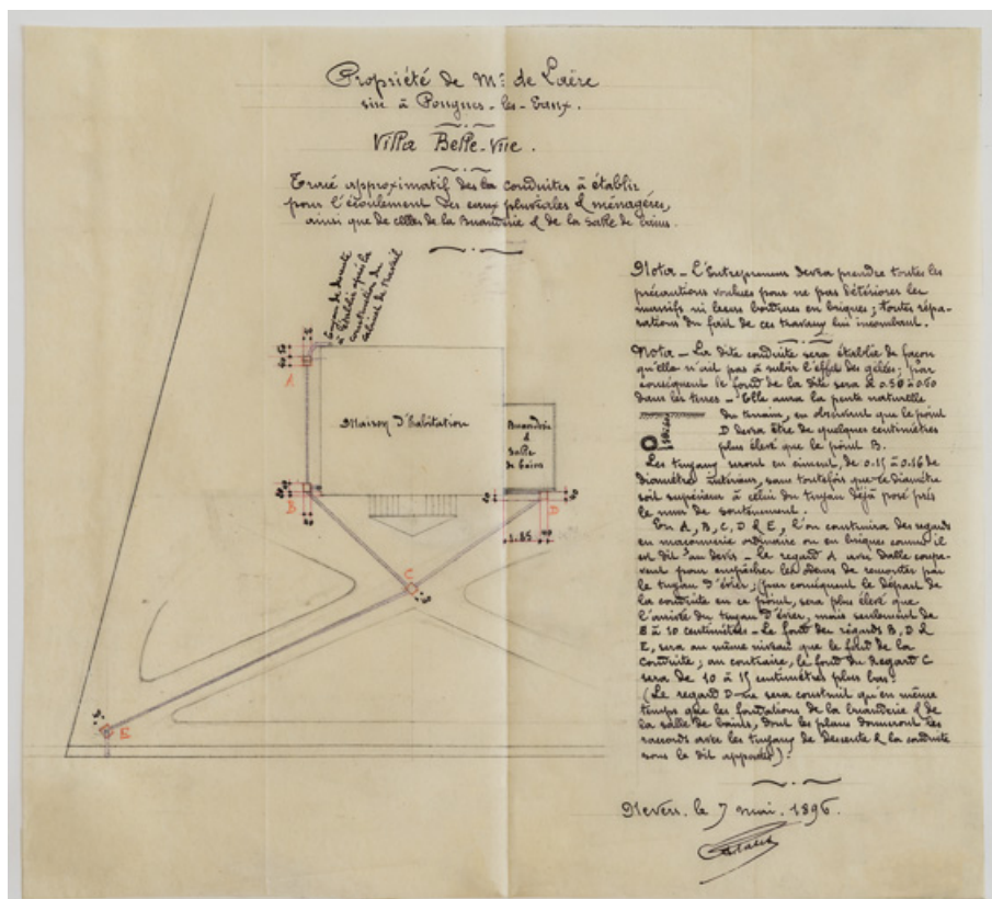
Plan-masse portant un projet de conduites à établir pour l'écoulement des eaux pluviales et ménagères.

58, Pougues-les-Eaux, 93 avenue de Paris