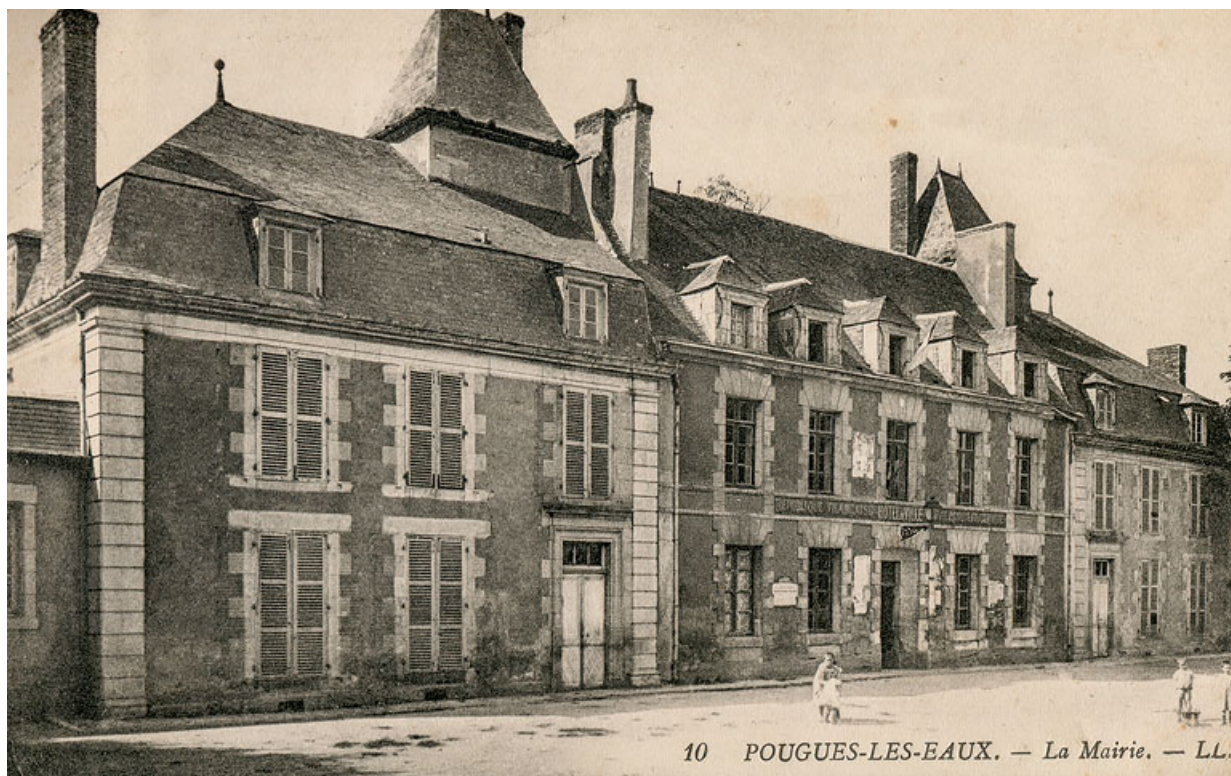
Façade à la fin du 19e siècle ou au début du 20e siècle.

58, Pougues-les-Eaux rue du Docteur Faucher