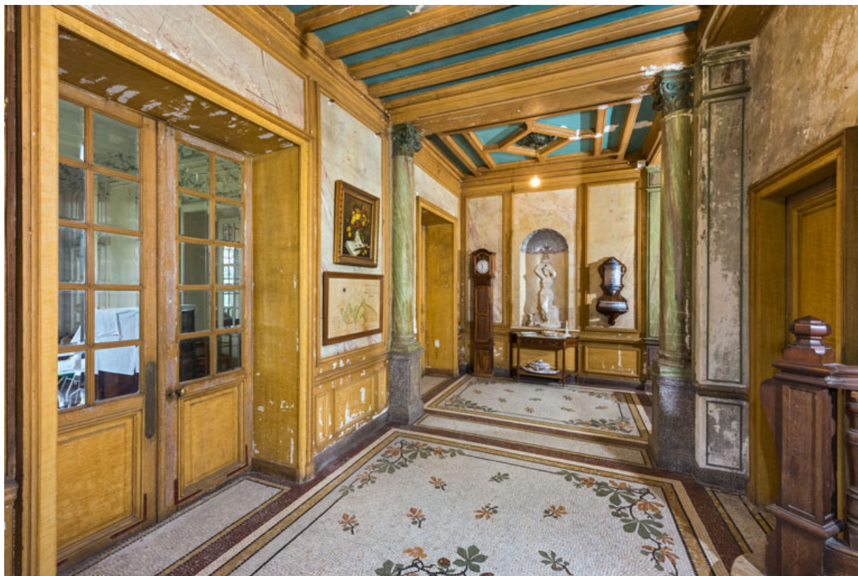
Vestibule au rez-de-chaussée, avec les portes du salon et de la salle à manger (à gauche).

58, Pougues-les-Eaux, 130 avenue de Paris, lieudit : La Montjaie