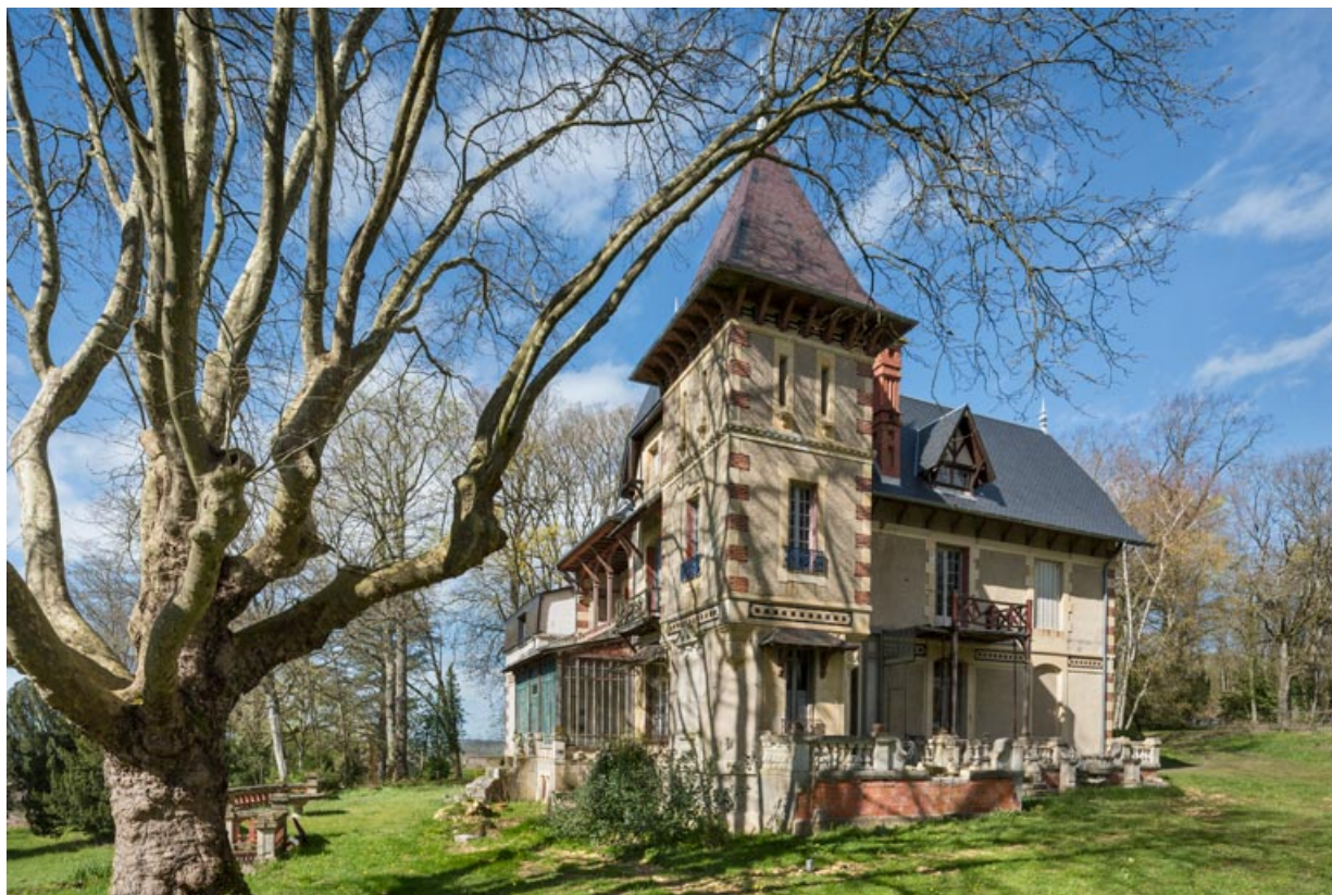
Tour à l'angle des façades ouest et sud.

58, Pougues-les-Eaux, 130 avenue de Paris, lieudit : La Montjaie