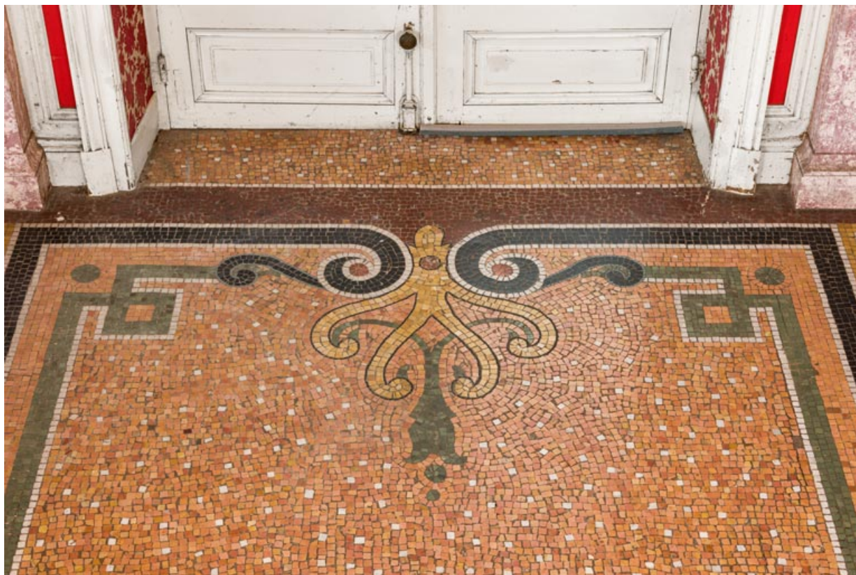
Salle à manger du rez-de-chaussée, mosaïque au sol, détail : palmette.

58, Pougues-les-Eaux, 130 avenue de Paris, lieudit : La Montjaie