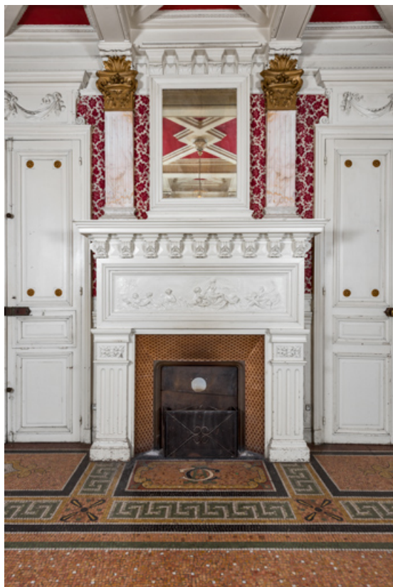
Salle à manger du rez-de-chaussée, cheminée.

58, Pougues-les-Eaux, 130 avenue de Paris, lieudit : La Montjaie