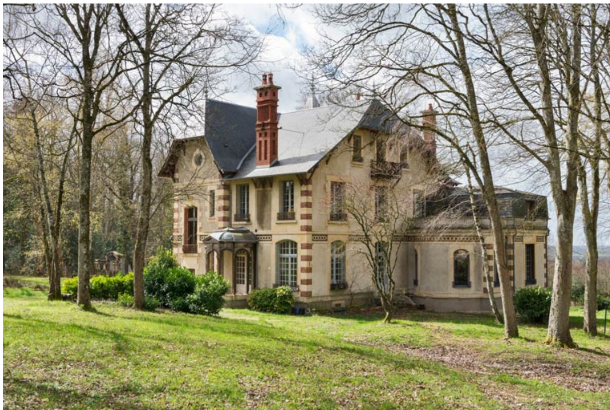
Façades est et nord.

58, Pougues-les-Eaux, 130 avenue de Paris, lieudit : La Montjaie