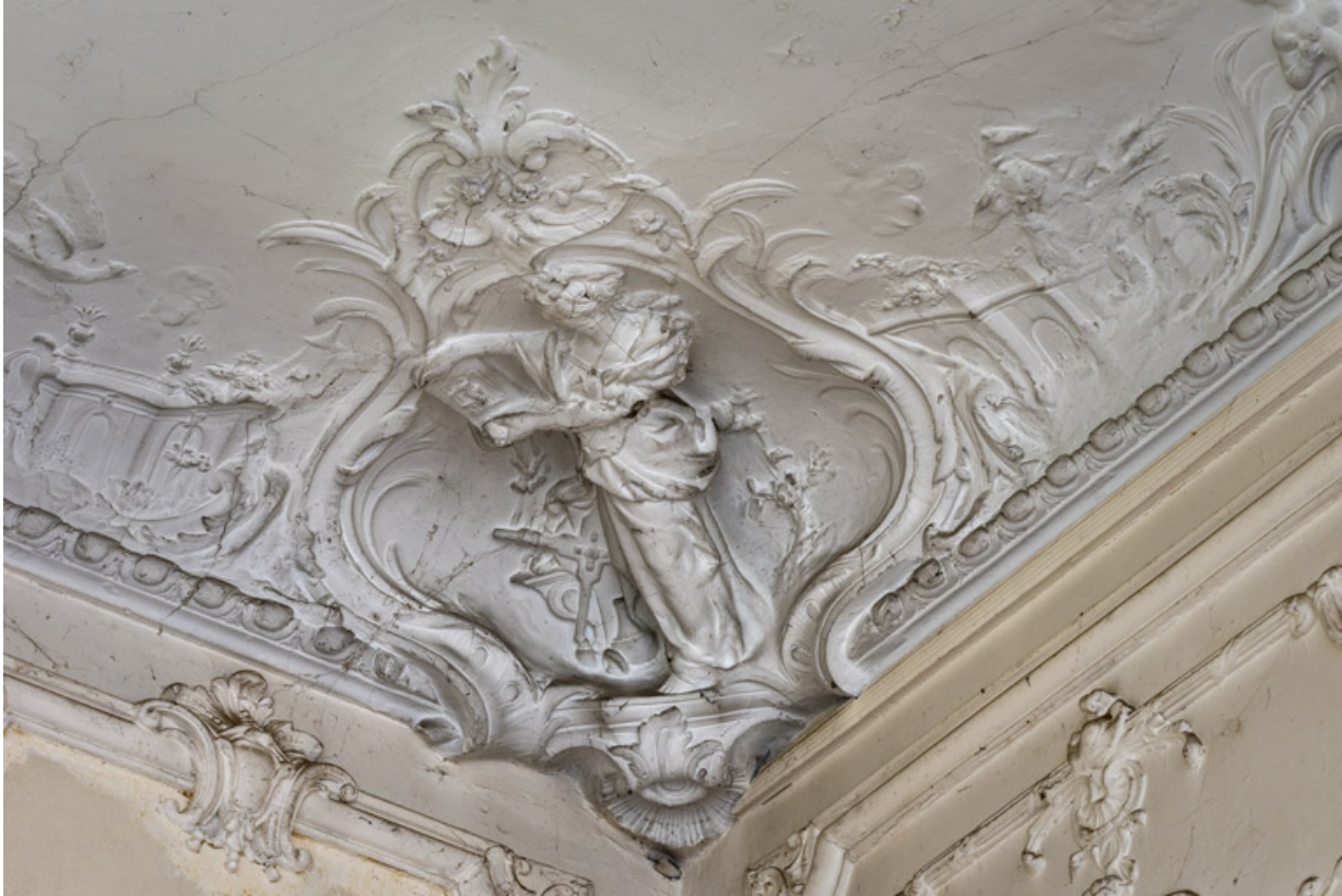
Salon du rez-de-chaussée, plafond, décor sculpté, détail : la Gravure.

58, Pougues-les-Eaux, 130 avenue de Paris, lieudit : La Montjaie