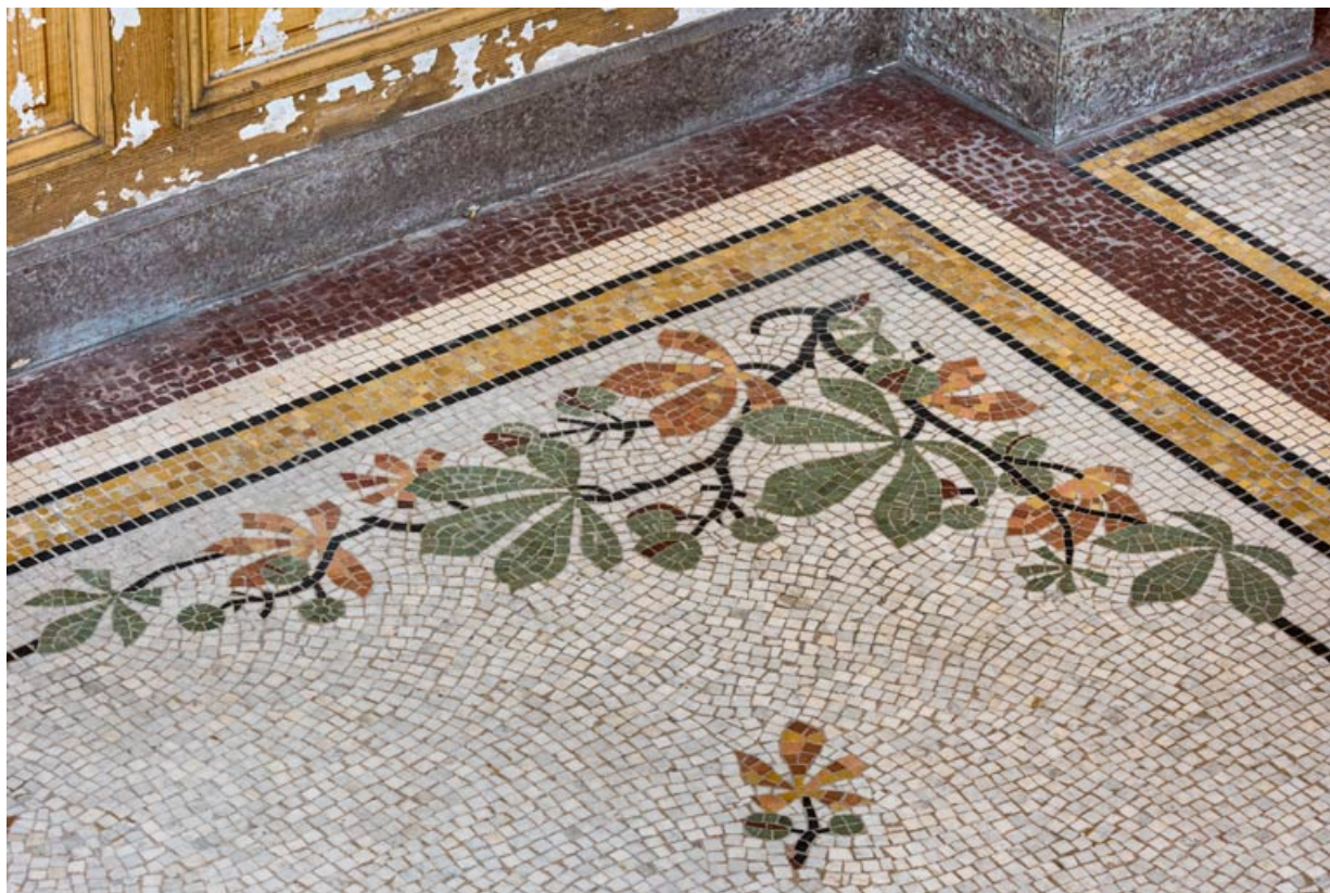
Vestibule du rez-de-chaussée, mosaïque au sol, détail : décor floral.

58, Pougues-les-Eaux, 130 avenue de Paris, lieudit : La Montjaie