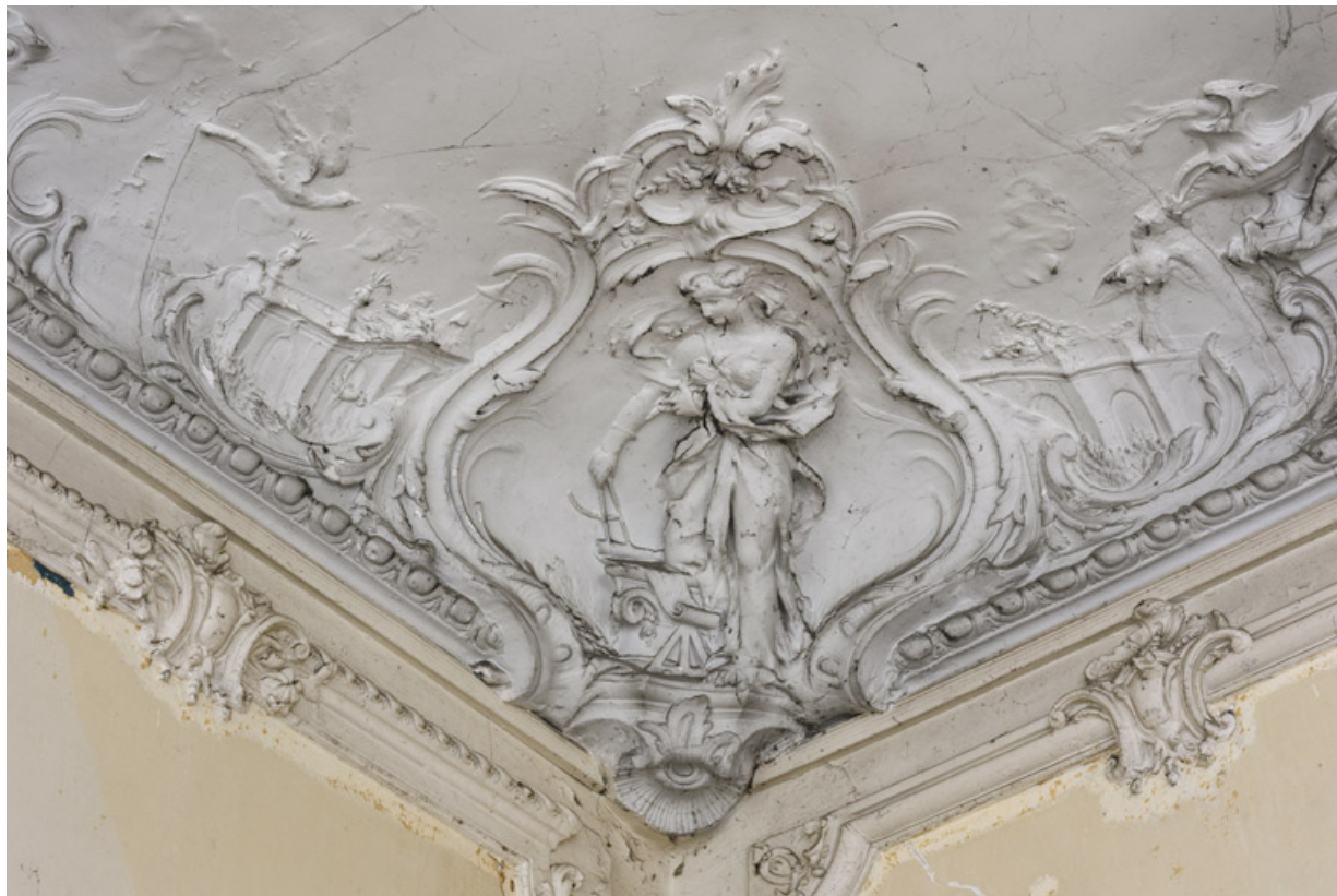
Salon du rez-de-chaussée, plafond, décor sculpté, détail : l'Architecture.

58, Pougues-les-Eaux, 130 avenue de Paris, lieudit : La Montjaie