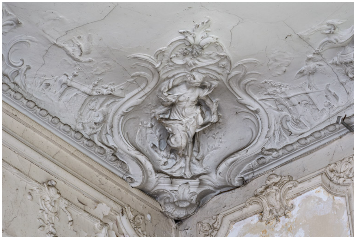
Salon du rez-de-chaussée, plafond, décor sculpté, détail : la Peinture.

58, Pougues-les-Eaux, 130 avenue de Paris, lieudit : La Montjaie