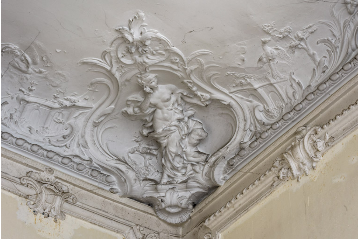
Salon du rez-de-chaussée, plafond, décor sculpté, détail : la Sculpture.

58, Pougues-les-Eaux, 130 avenue de Paris, lieudit : La Montjaie