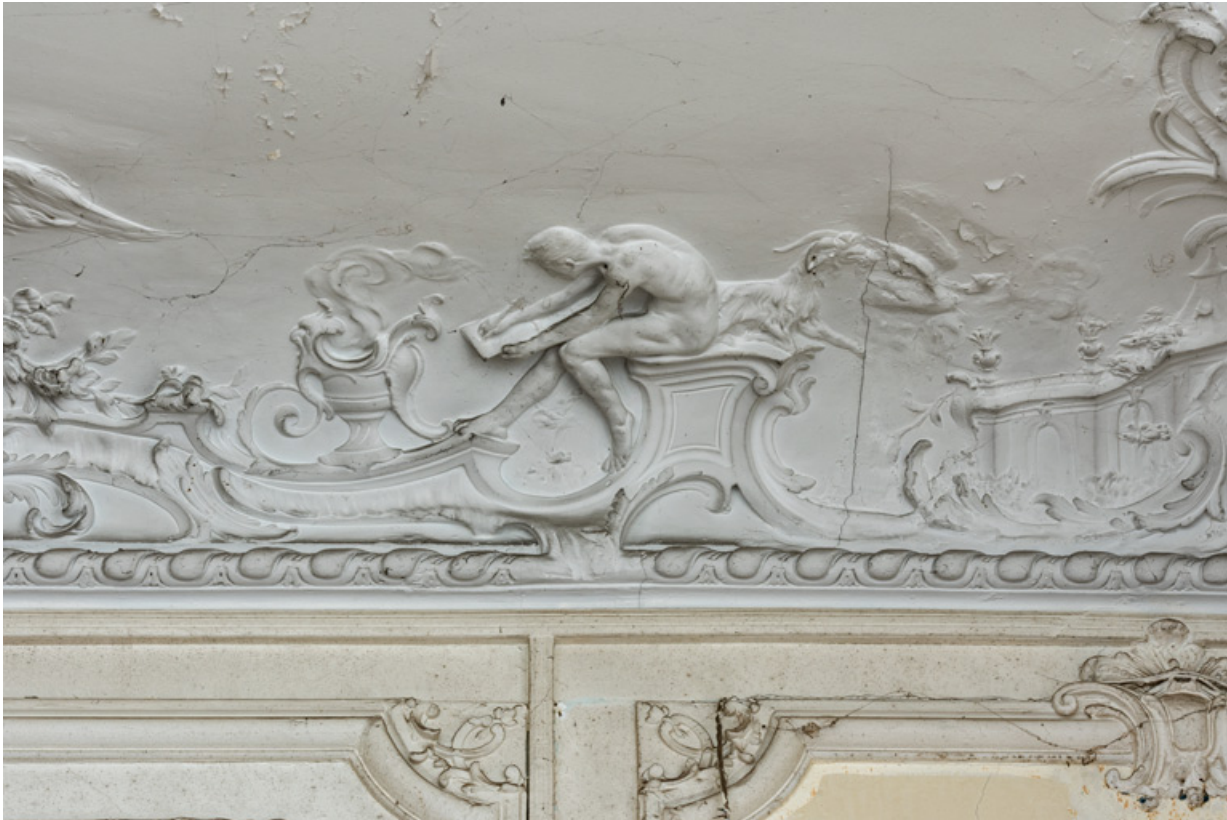
Salon du rez-de-chaussée, plafond, décor sculpté, détail : dessinateur.

58, Pougues-les-Eaux, 130 avenue de Paris, lieudit : La Montjaie