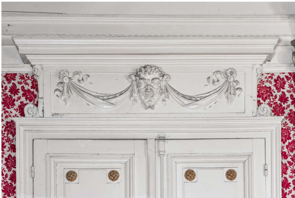
Salle à manger du rez-de-chaussée, portes de la cuisine et du vestibule, détail : masque et draperies en feston. 58, Pougues-les-Eaux, 130 avenue de Paris, lieudit : La Montjaie