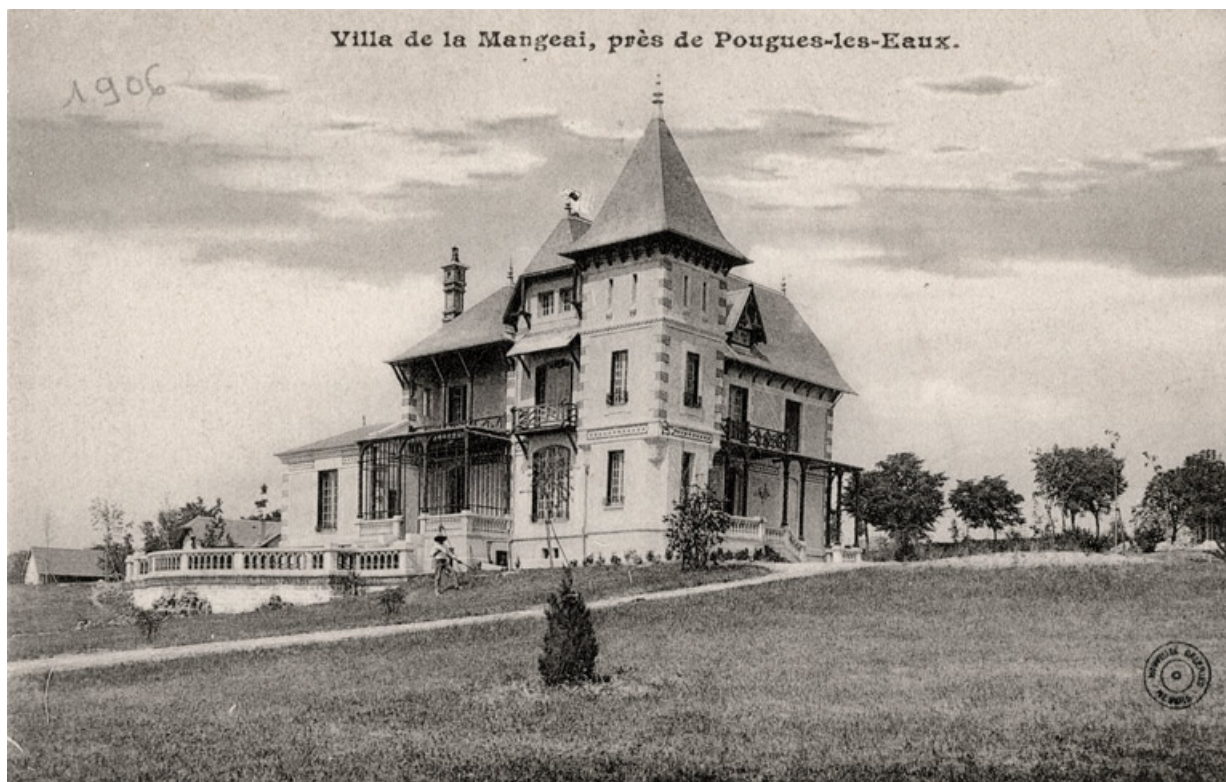
Façades ouest et sud.

58, Pougues-les-Eaux, 130 avenue de Paris, lieudit : La Montjaie