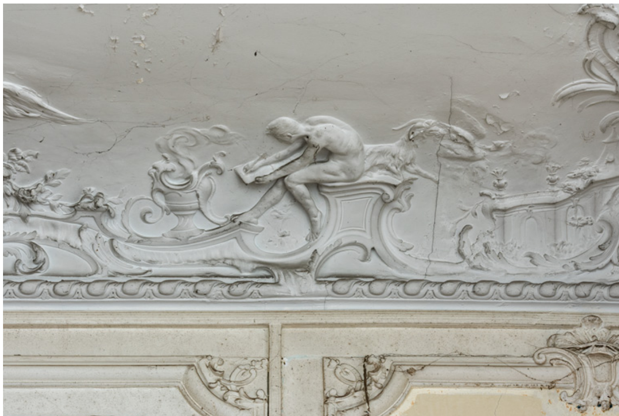
Salon du rez-de-chaussée, plafond, décor sculpté, détail : dessinateur.

58, Pougues-les-Eaux, 130 avenue de Paris, lieudit : La Montjaie