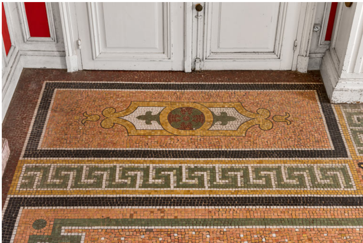
Salle à manger du rez-de-chaussée, mosaïque au sol, détail : rose, fleurons et grecques.

58, Pougues-les-Eaux, 130 avenue de Paris, lieudit : La Montjaie