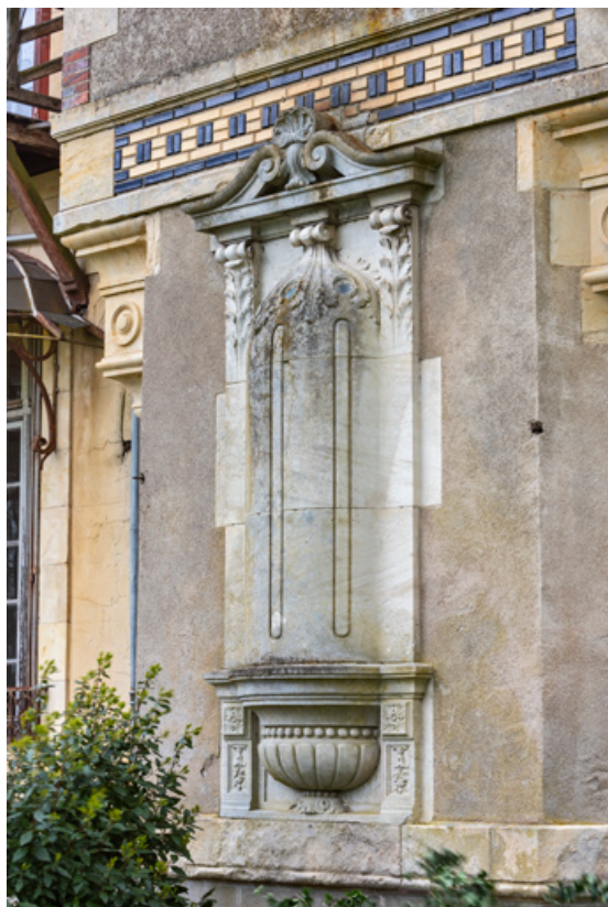
Tour à l'angle des façades ouest et sud, détail : ressaut correspondant à une niche intérieure remplaçant une baie. 58, Pougues-les-Eaux, 130 avenue de Paris, lieudit : La Montjaie