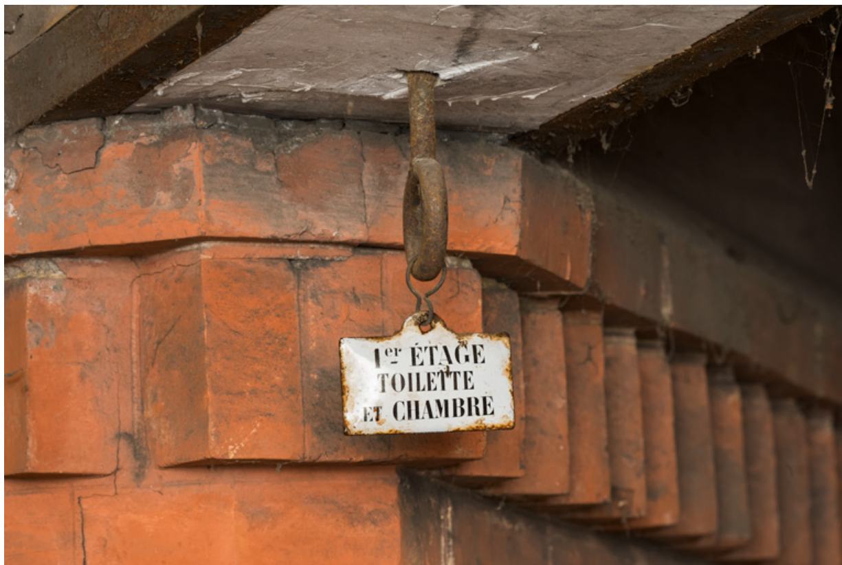
Calorifère au sous-sol, détail : étiquette suspendue à un conduit ("1er étage toilette et chambre"). 58, Pougues-les-Eaux, 130 avenue de Paris, lieudit : La Montjaie