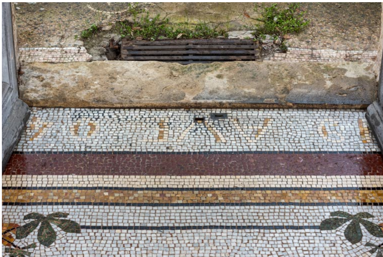
Vestibule du rez-de-chaussée, mosaïque au sol, détail : inscription "19 AVE 04".

58, Pougues-les-Eaux, 130 avenue de Paris, lieudit : La Montjaie