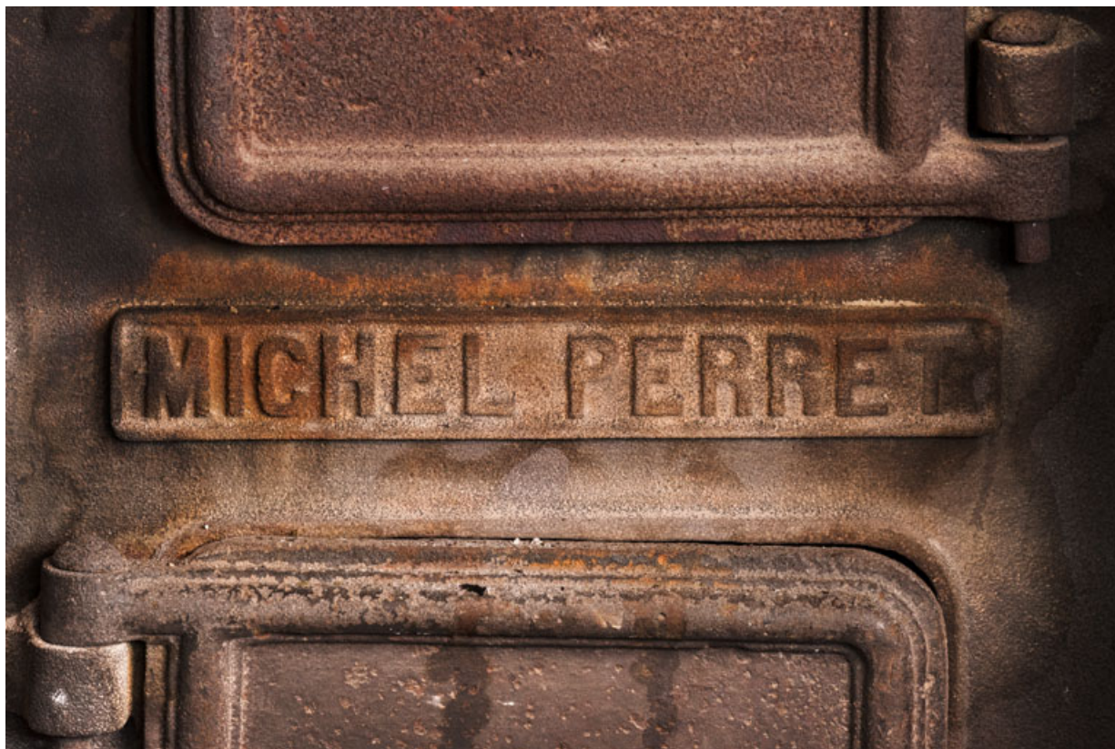
Calorifère au sous-sol, détail : plaque de firme ("Michel Perret").

58, Pougues-les-Eaux, 130 avenue de Paris, lieudit : La Montjaie