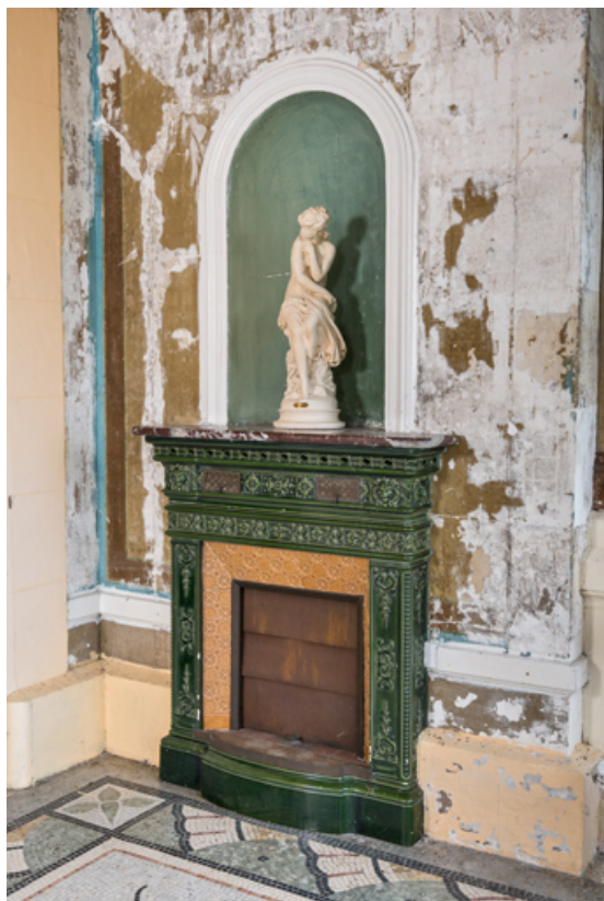
Véranda, manteau de cheminée en céramique surmonté d'une niche.

58, Pougues-les-Eaux, 130 avenue de Paris, lieudit : La Montjaie