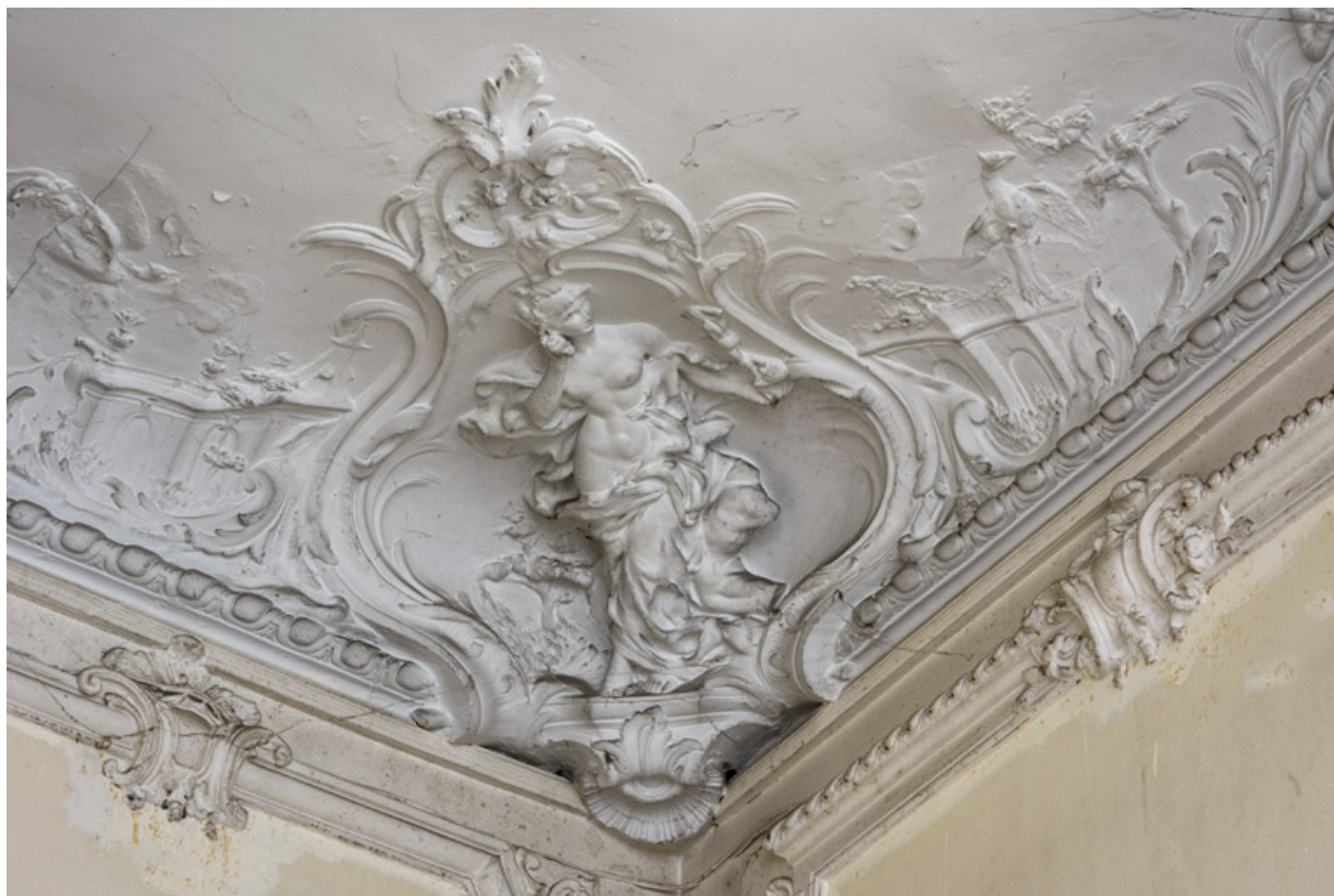
Salon du rez-de-chaussée, plafond, décor sculpté, détail : la Sculpture.

58, Pougues-les-Eaux, 130 avenue de Paris, lieudit : La Montjaie