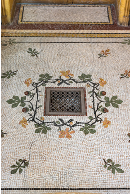
Vestibule du rez-de-chaussée, grille de chauffage au sol.

58, Pougues-les-Eaux, 130 avenue de Paris, lieudit : La Montjaie