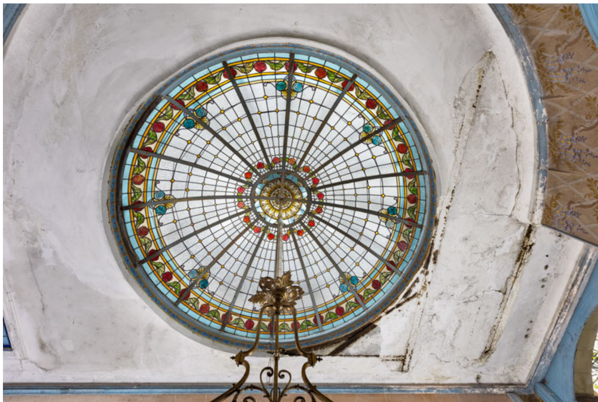
Salle de billard au rez-de-chaussée, verrière en couverture.

58, Pougues-les-Eaux, 130 avenue de Paris, lieudit : La Montjaie