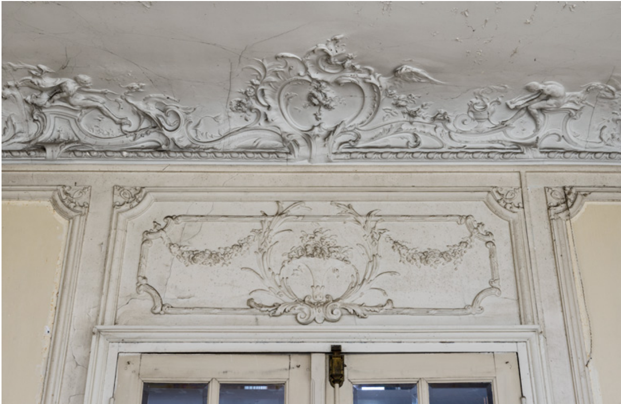
Salon du rez-de-chaussée, dessus-de-porte.

58, Pougues-les-Eaux, 130 avenue de Paris, lieudit : La Montjaie