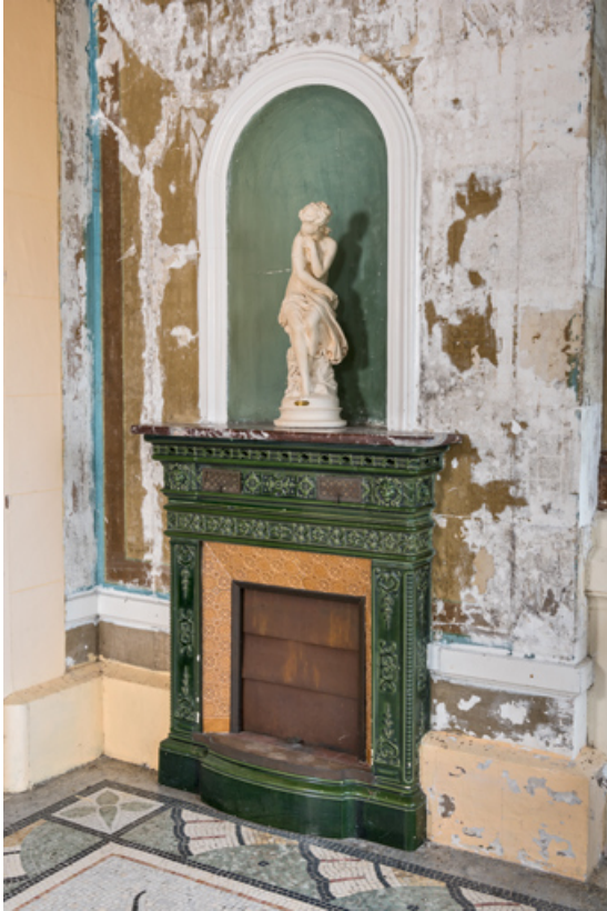
Véranda, manteau de cheminée en céramique surmonté d'une niche.

58, Pougues-les-Eaux, 130 avenue de Paris, lieudit : La Montjaie