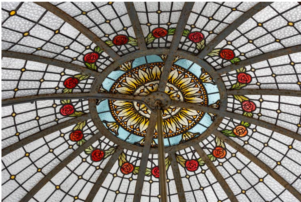
Salle de billard au rez-de-chaussée, verrière en couverture, détail : fleurs.

58, Pougues-les-Eaux, 130 avenue de Paris, lieudit : La Montjaie