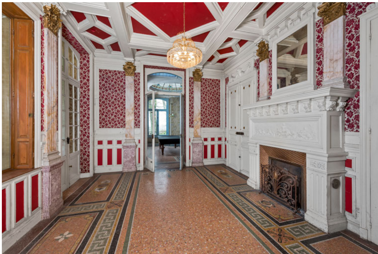
Salle à manger du rez-de-chaussée (vue en direction de la salle de billard).

58, Pougues-les-Eaux, 130 avenue de Paris, lieudit : La Montjaie