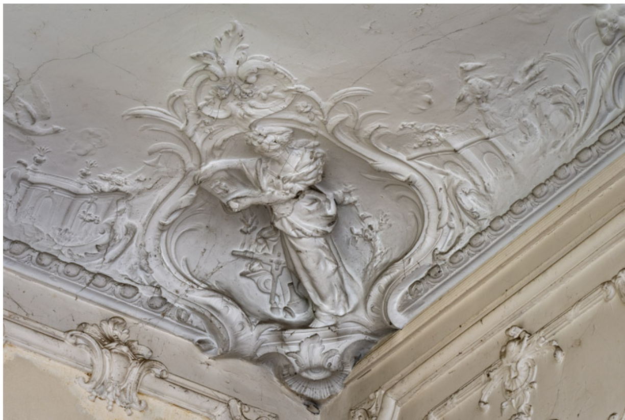
Salon du rez-de-chaussée, plafond, décor sculpté, détail : la Gravure.

58, Pougues-les-Eaux, 130 avenue de Paris, lieudit : La Montjaie