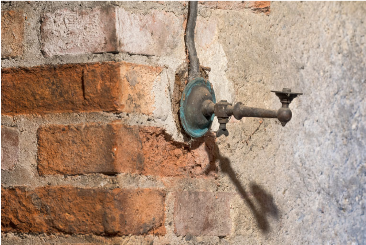
Luminaire d'applique au sous-sol.

58, Pougues-les-Eaux, 130 avenue de Paris, lieudit : La Montjaie