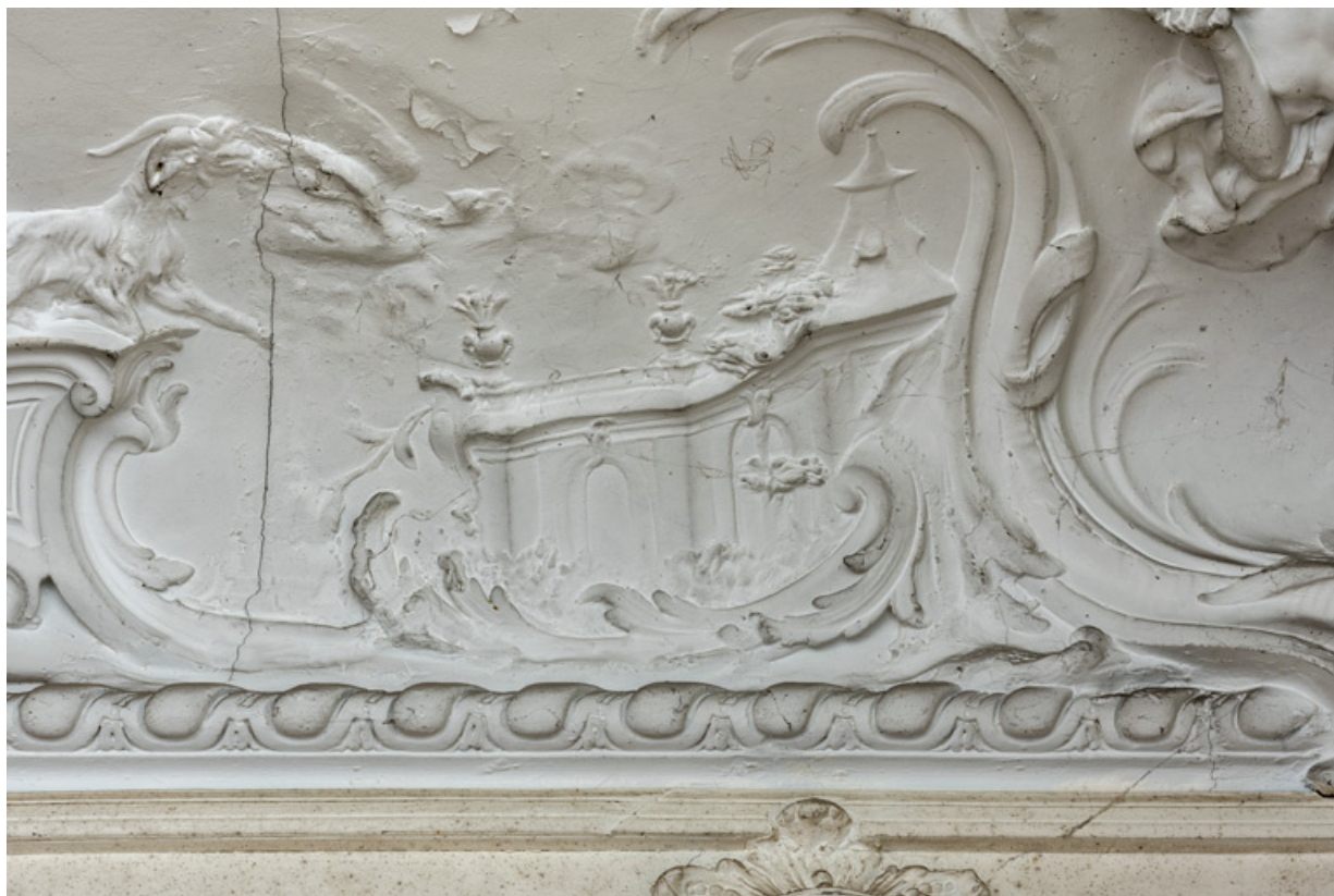
Salon du rez-de-chaussée, plafond, décor sculpté, détail : édifice.

58, Pougues-les-Eaux, 130 avenue de Paris, lieudit : La Montjaie