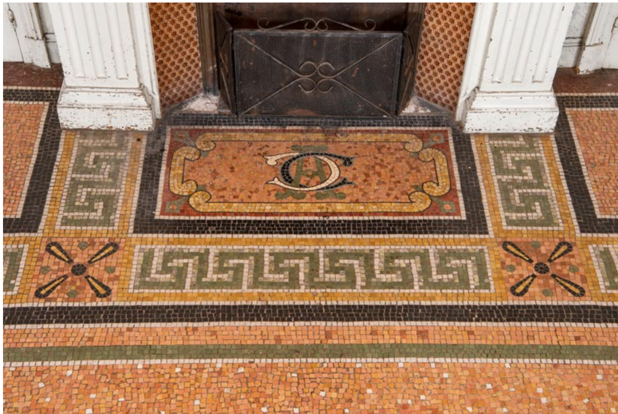
Salle à manger du rez-de-chaussée, mosaïque au sol, détail : chiffre du propriétaire (lettres C et A).

58, Pougues-les-Eaux, 130 avenue de Paris, lieudit : La Montjaie