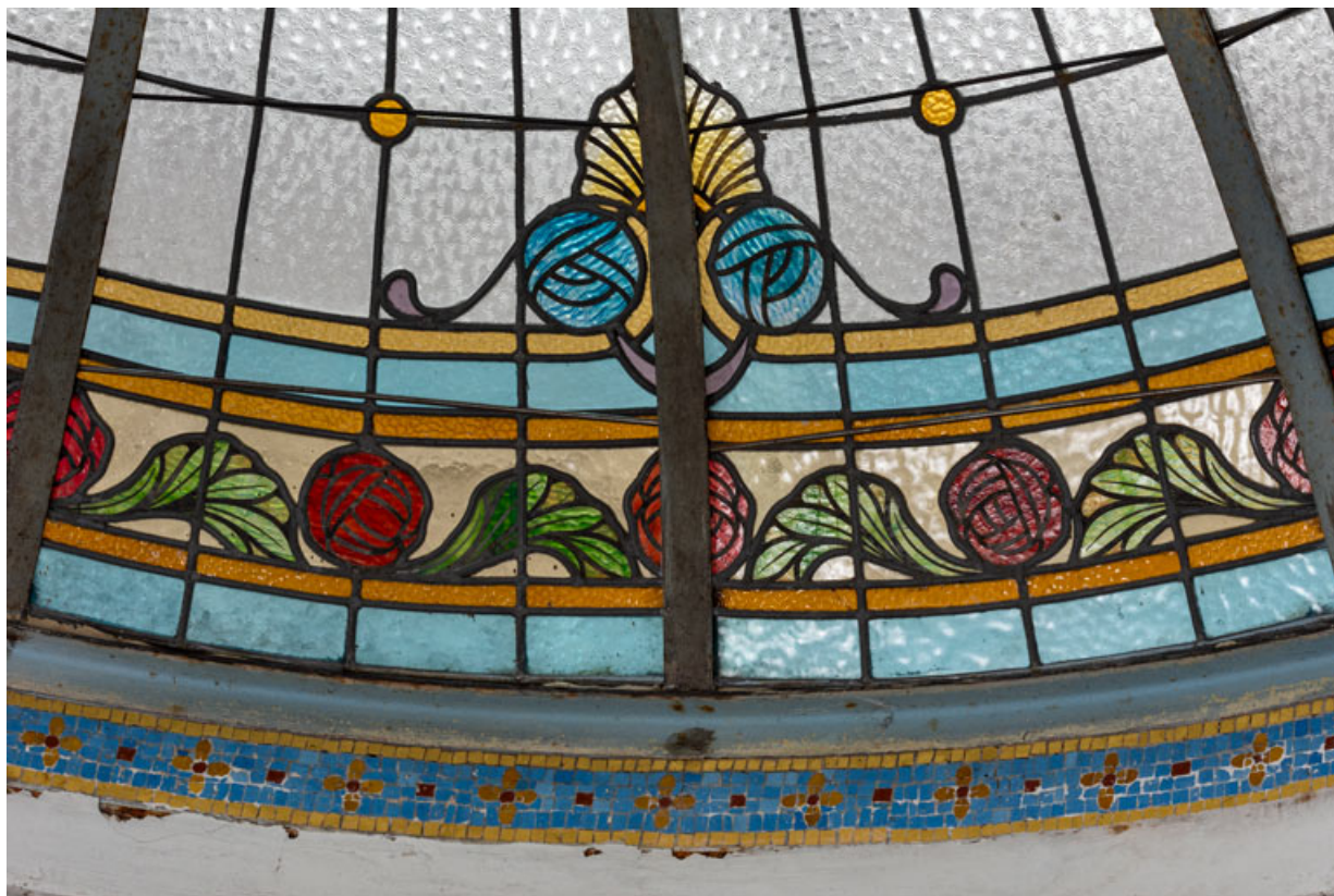
Salle de billard au rez-de-chaussée, verrière en couverture, détail : fleurs.

58, Pougues-les-Eaux, 130 avenue de Paris, lieudit : La Montjaie