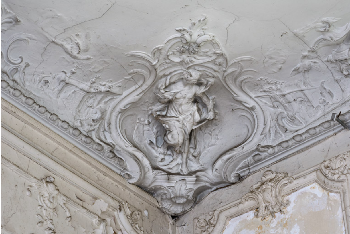
Salon du rez-de-chaussée, plafond, décor sculpté, détail : la Peinture.

58, Pougues-les-Eaux, 130 avenue de Paris, lieudit : La Montjaie