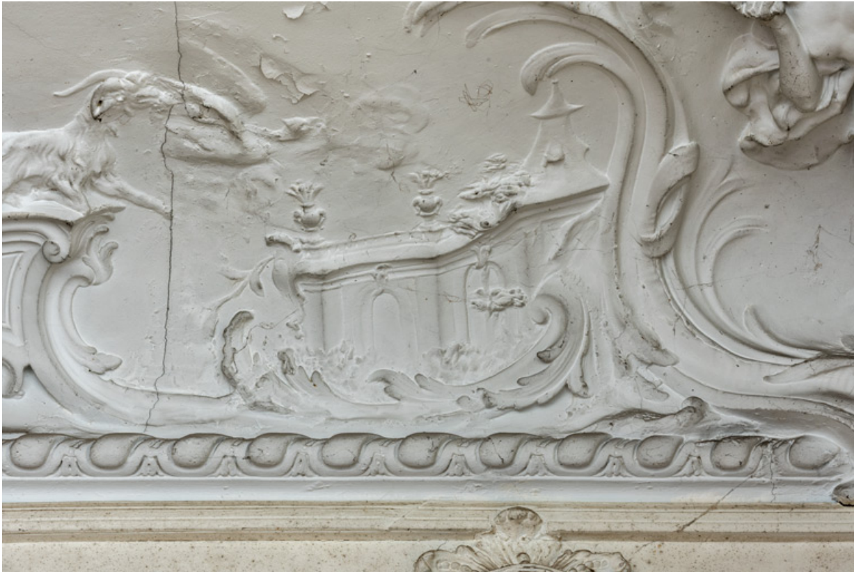
Salon du rez-de-chaussée, plafond, décor sculpté, détail : édifice.

58, Pougues-les-Eaux, 130 avenue de Paris, lieudit : La Montjaie