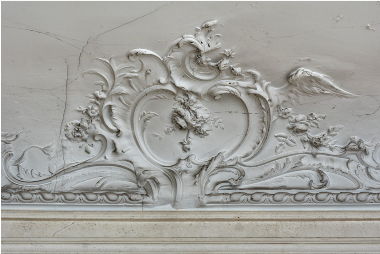
Salon du rez-de-chaussée, plafond, décor sculpté, détail : bouquet. 58, Pougues-les-Eaux, 130 avenue de Paris, lieudit : La Montjaie