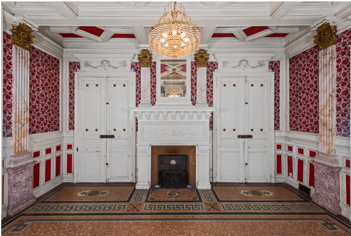
Salle à manger du rez-de-chaussée, portes de la cuisine et du vestibule.

58, Pougues-les-Eaux, 130 avenue de Paris, lieudit : La Montjaie