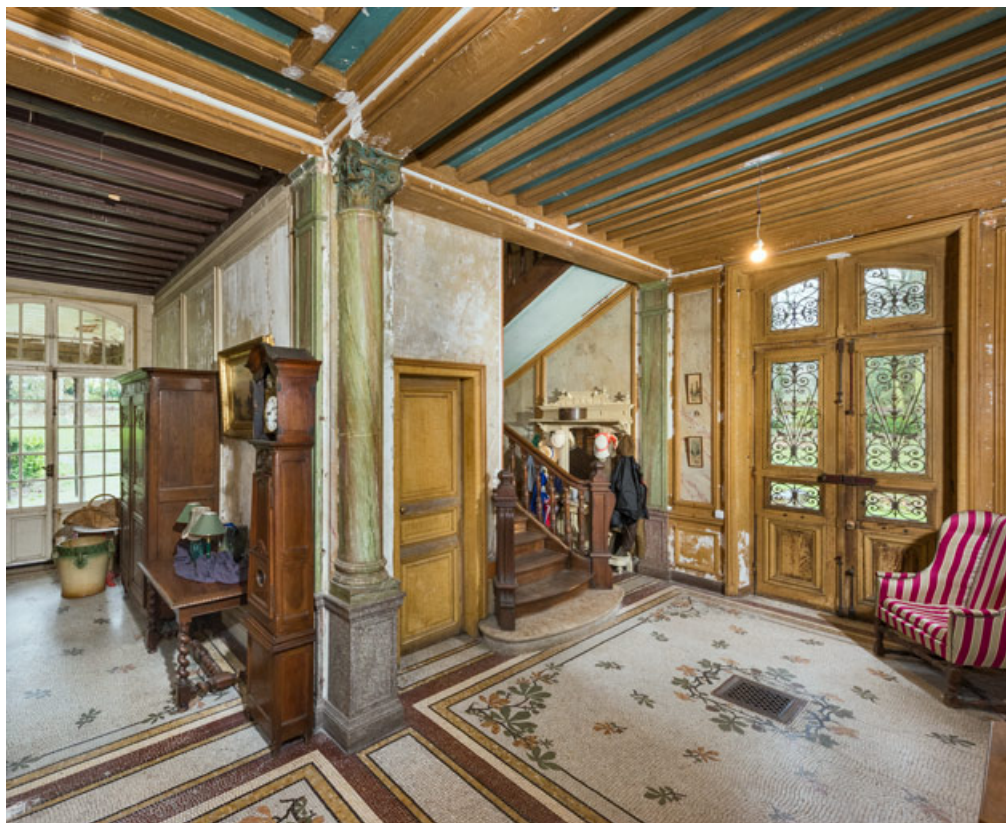
Vestibule au rez-de-chaussée, avec les portes des entrées sud (à droite) et est (à gauche). 58, Pougues-les-Eaux, 130 avenue de Paris, lieudit : La Montjaie