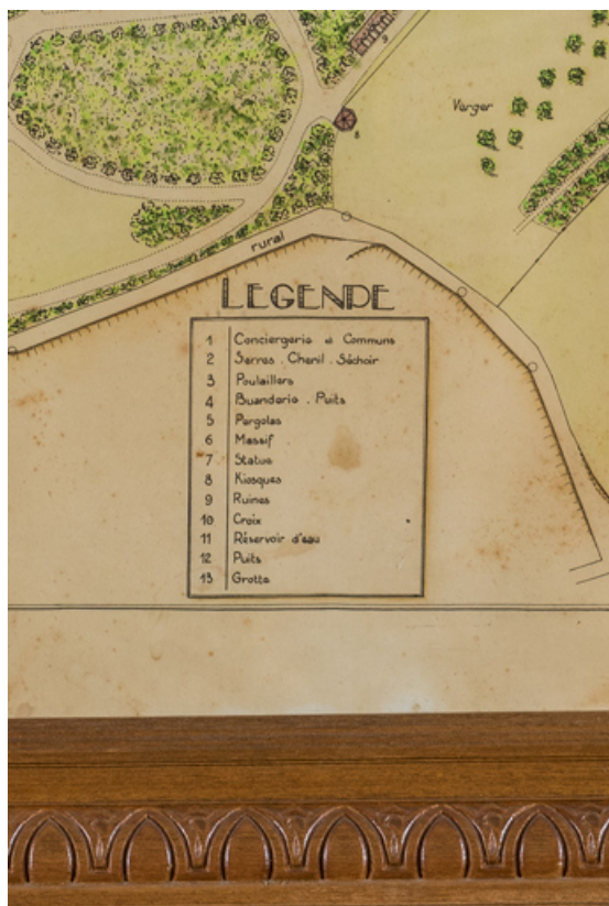
Plan du parc en 1912-1913, détail : légende.

58, Pougues-les-Eaux, 130 avenue de Paris, lieudit : La Montjaie