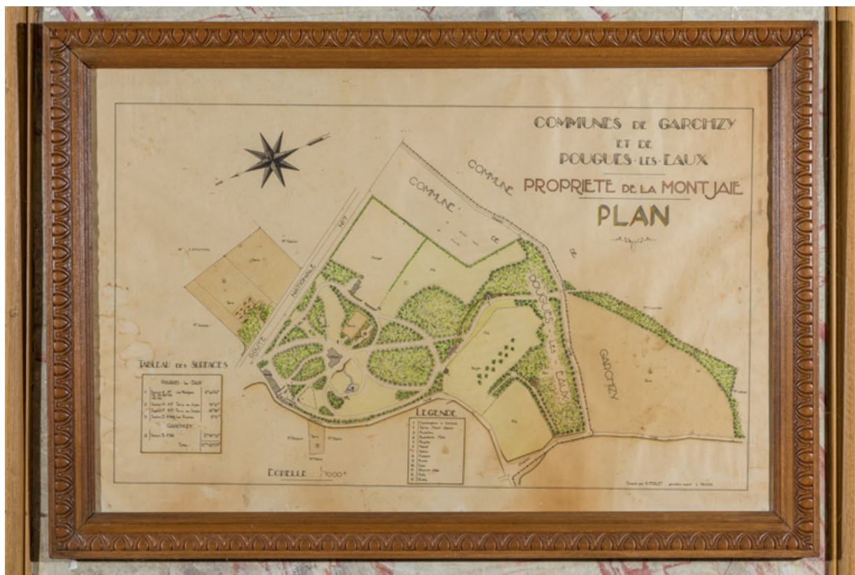
Localisation des "ruines" (9) sur un plan levé en 1912-1913. 58, Pougues-les-Eaux, 130 avenue de Paris, lieudit : La Montjaie