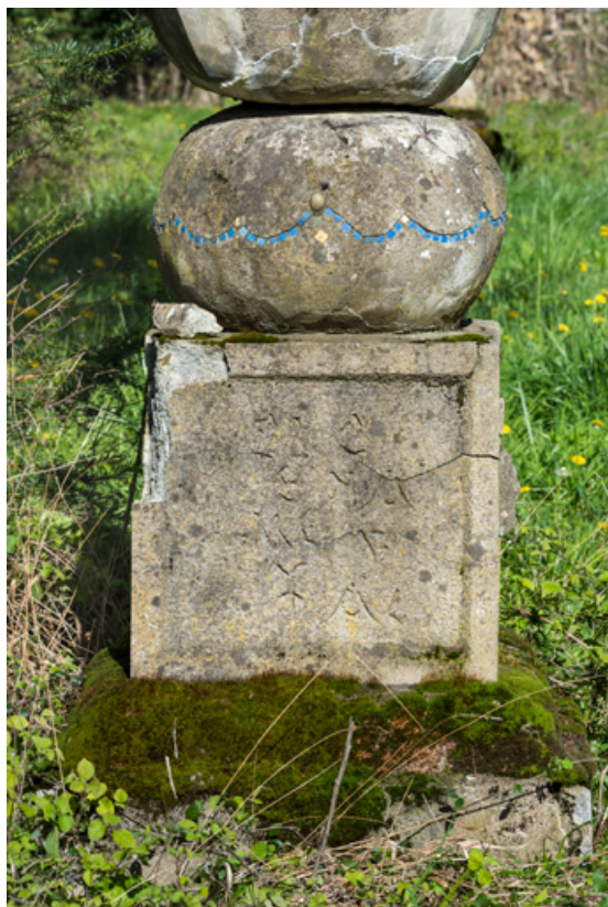
Fabrique du jardin orientalisant, détail.

58, Pougues-les-Eaux, 130 avenue de Paris, lieudit : La Montjaie