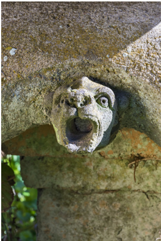
Fabrique du jardin orientalisant, détail.

58, Pougues-les-Eaux, 130 avenue de Paris, lieudit : La Montjaie