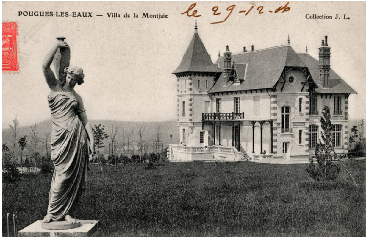
Statue aux abords de la maison.

58, Pougues-les-Eaux, 130 avenue de Paris, lieudit : La Montjaie