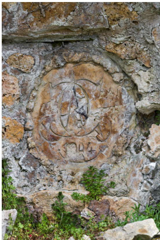
Cascade de l'étang, détail.

58, Pougues-les-Eaux, 130 avenue de Paris, lieudit : La Montjaie