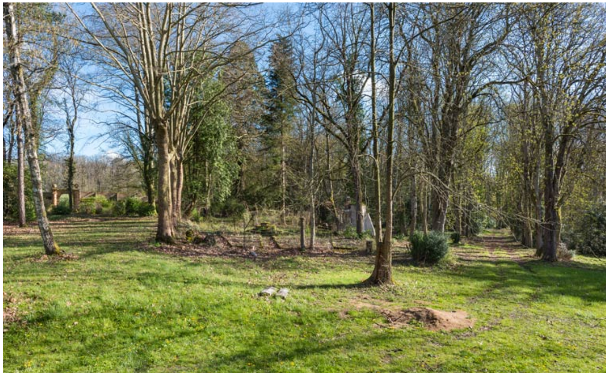
Allée nord-sud (vue en direction du sud).

58, Pougues-les-Eaux, 130 avenue de Paris, lieudit : La Montjaie