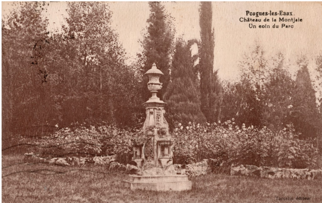
Vase sur un piédestal (non localisé).

58, Pougues-les-Eaux, 130 avenue de Paris, lieudit : La Montjaie