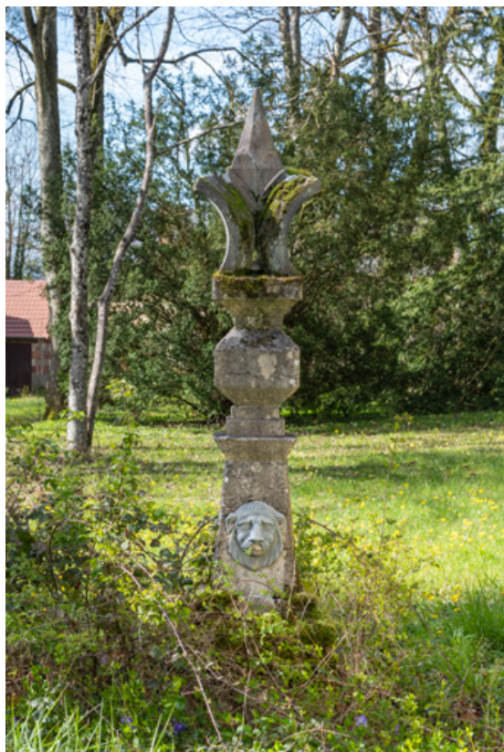
Fabrique du jardin orientalisant.

58, Pougues-les-Eaux, 130 avenue de Paris, lieudit : La Montjaie