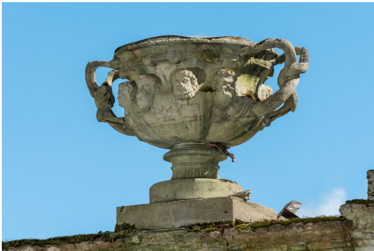
Portail du potager, détail : vase (du type "vase de Warwick"). 58, Pougues-les-Eaux, 130 avenue de Paris, lieudit : La Montjaie