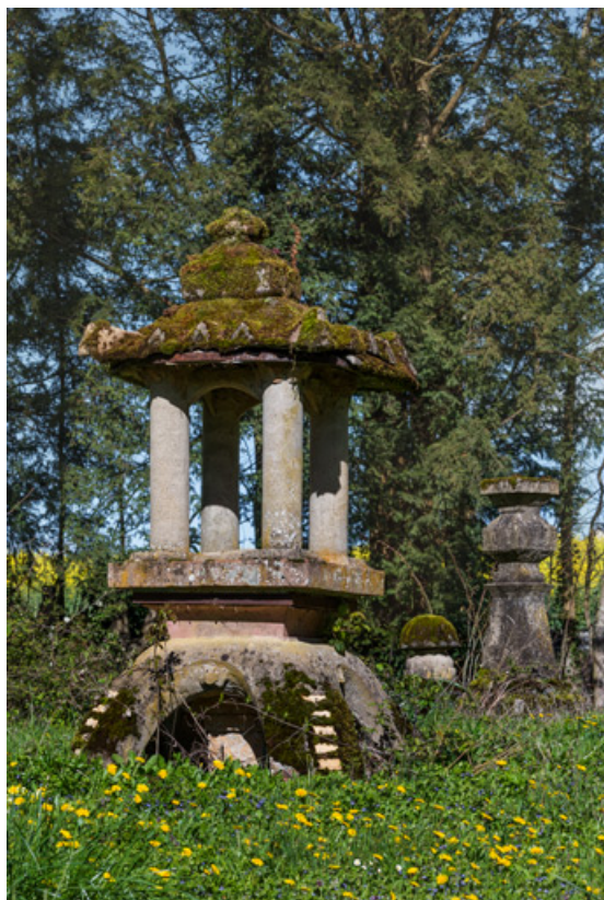
Fabrique du jardin orientalisant.

58, Pougues-les-Eaux, 130 avenue de Paris, lieudit : La Montjaie