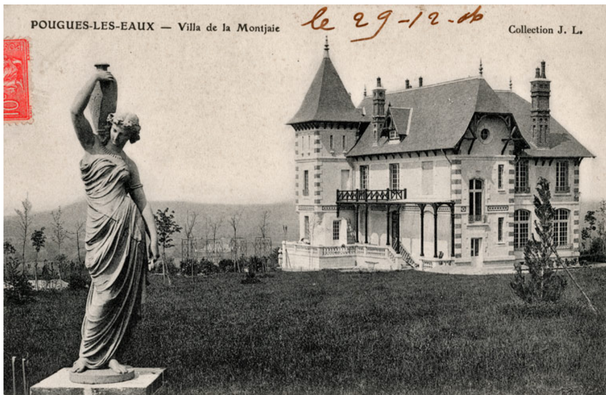
Statue aux abords de la maison.

58, Pougues-les-Eaux, 130 avenue de Paris, lieudit : La Montjaie