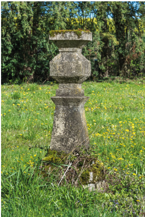
Fabrique du jardin orientalisant.

58, Pougues-les-Eaux, 130 avenue de Paris, lieudit : La Montjaie