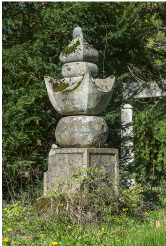
Fabrique du jardin orientalisant.

58, Pougues-les-Eaux, 130 avenue de Paris, lieudit : La Montjaie