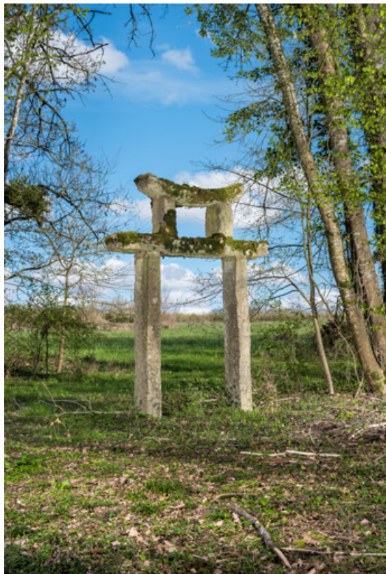
Portique japonais (torii).

58, Pougues-les-Eaux, 130 avenue de Paris, lieudit : La Montjaie