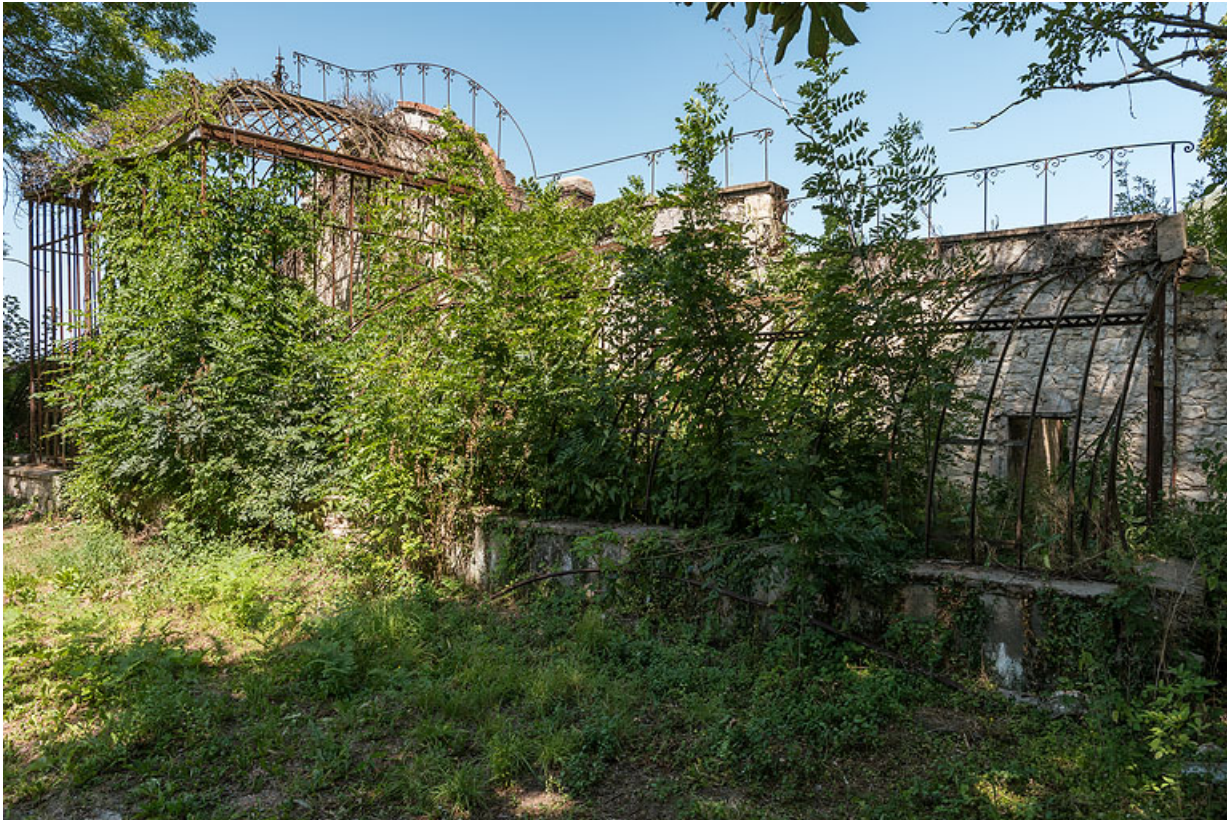
Aile est, vue de trois-quarts.

58, Pougues-les-Eaux, 1 rue de Bramepain