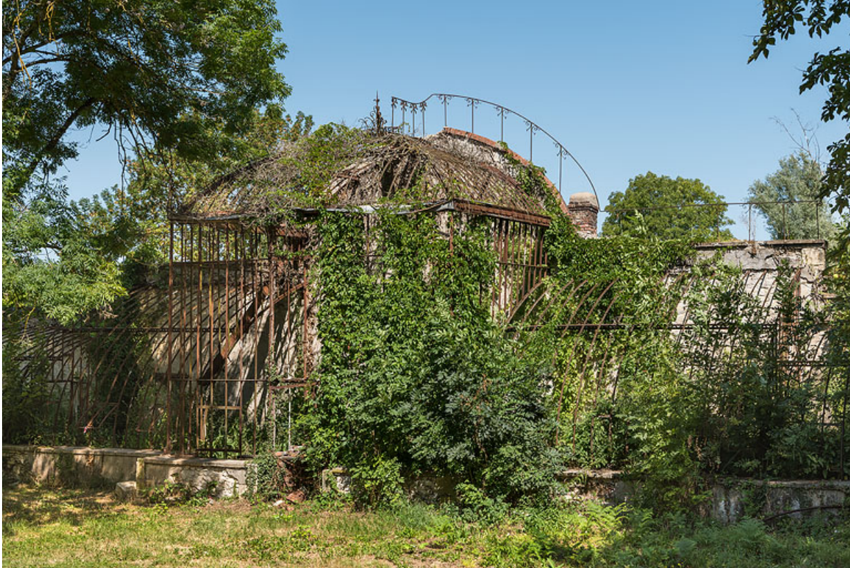
Pavillon central, vue de trois-quarts.

58, Pougues-les-Eaux, 1 rue de Bramepain