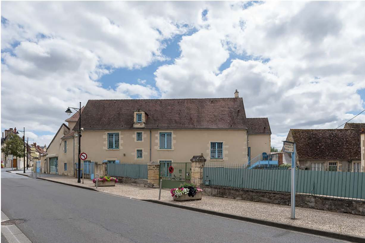
Vue depuis l'avenue de Paris.

58, Pougues-les-Eaux, 40 avenue de Paris