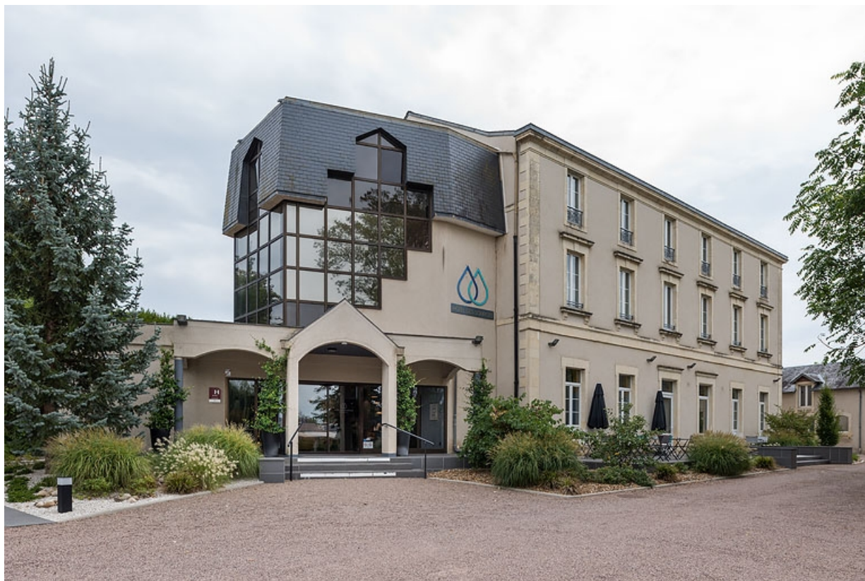
Façade après les travaux de modernisation de 2017.

58, Pougues-les-Eaux, 5 rue de la Mignarderie