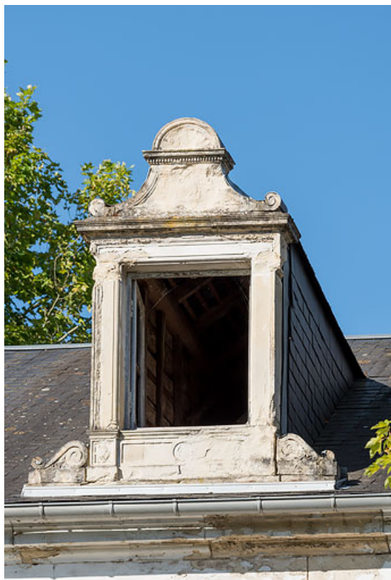
Façade de la maison de Marien dit Georges Bigouret, lucarne. 58, Pougues-les-Eaux, 34 avenue de Paris