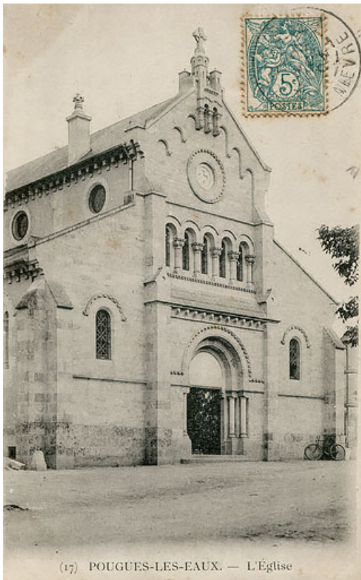
Façade de l'église au début du 20e siècle. 58, Pougues-les-Eaux place de l'Église