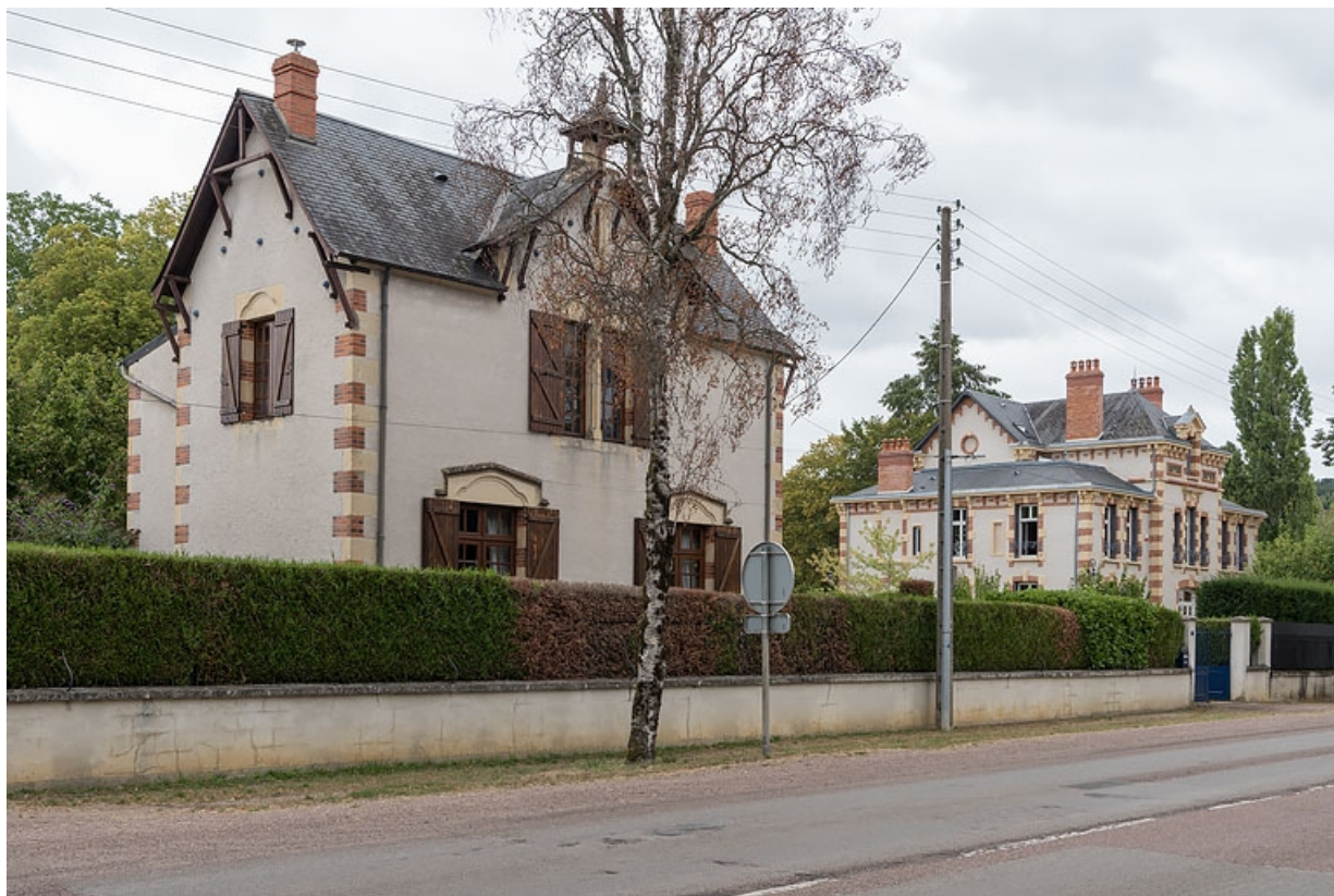
Vue de trois quarts, depuis l'avenue.

58, Pougues-les-Eaux, 17 avenue de Paris