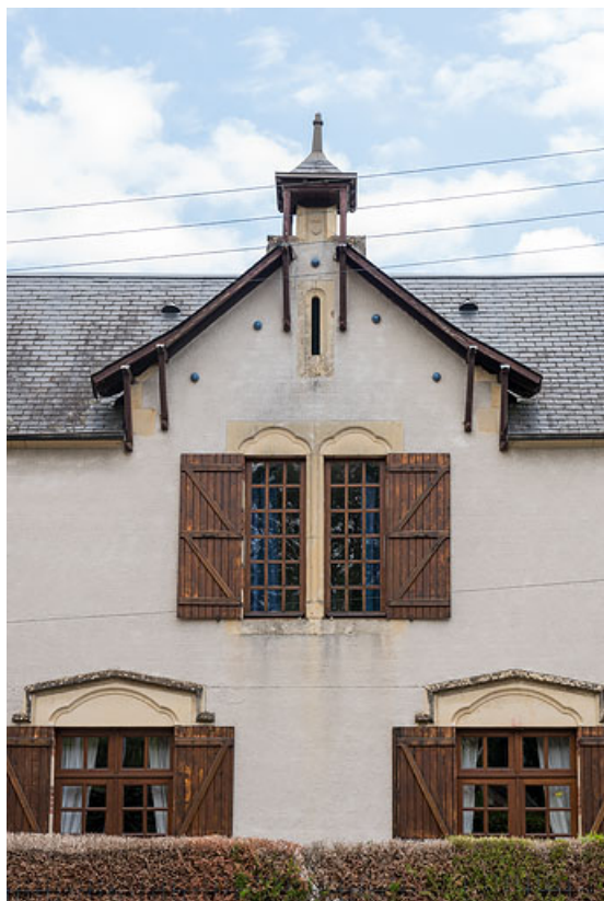
Pignon de la façade principale.

58, Pougues-les-Eaux, 17 avenue de Paris