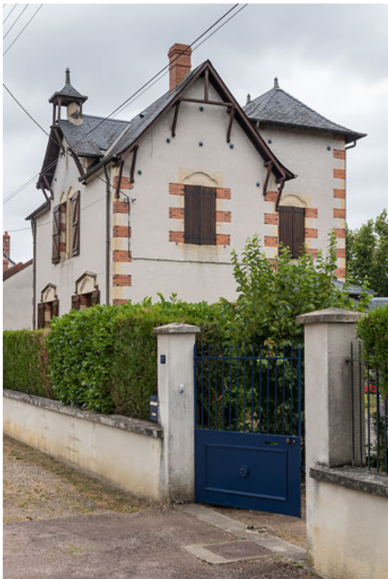
Vue de trois-quarts, depuis l'avenue.

58, Pougues-les-Eaux, 17 avenue de Paris