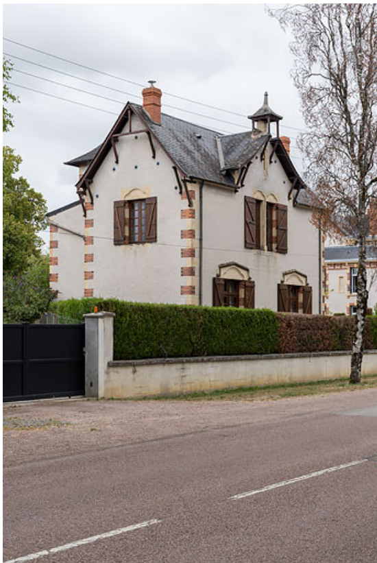
Vue de trois-quarts, depuis l'avenue.

58, Pougues-les-Eaux, 17 avenue de Paris