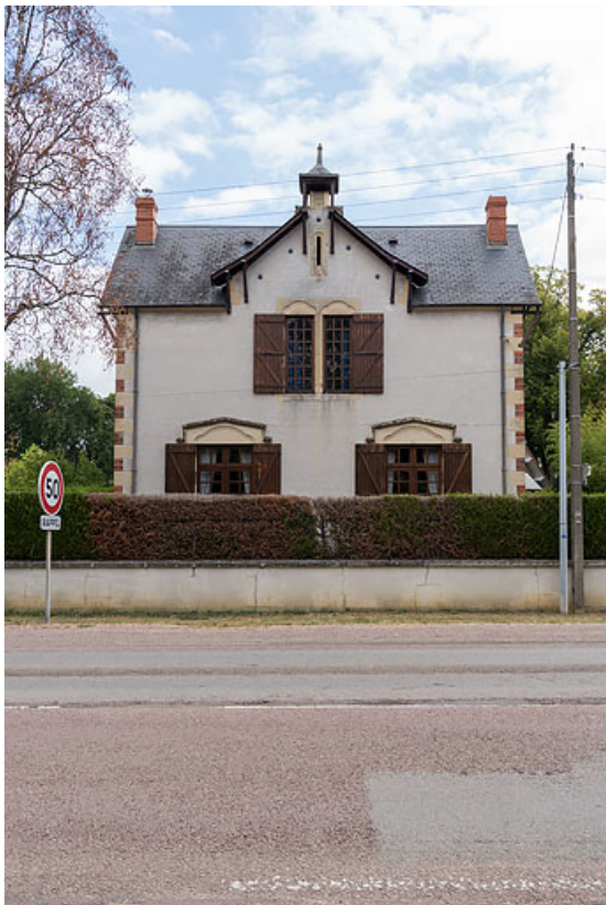
Vue de face, depuis l'avenue.

58, Pougues-les-Eaux, 17 avenue de Paris