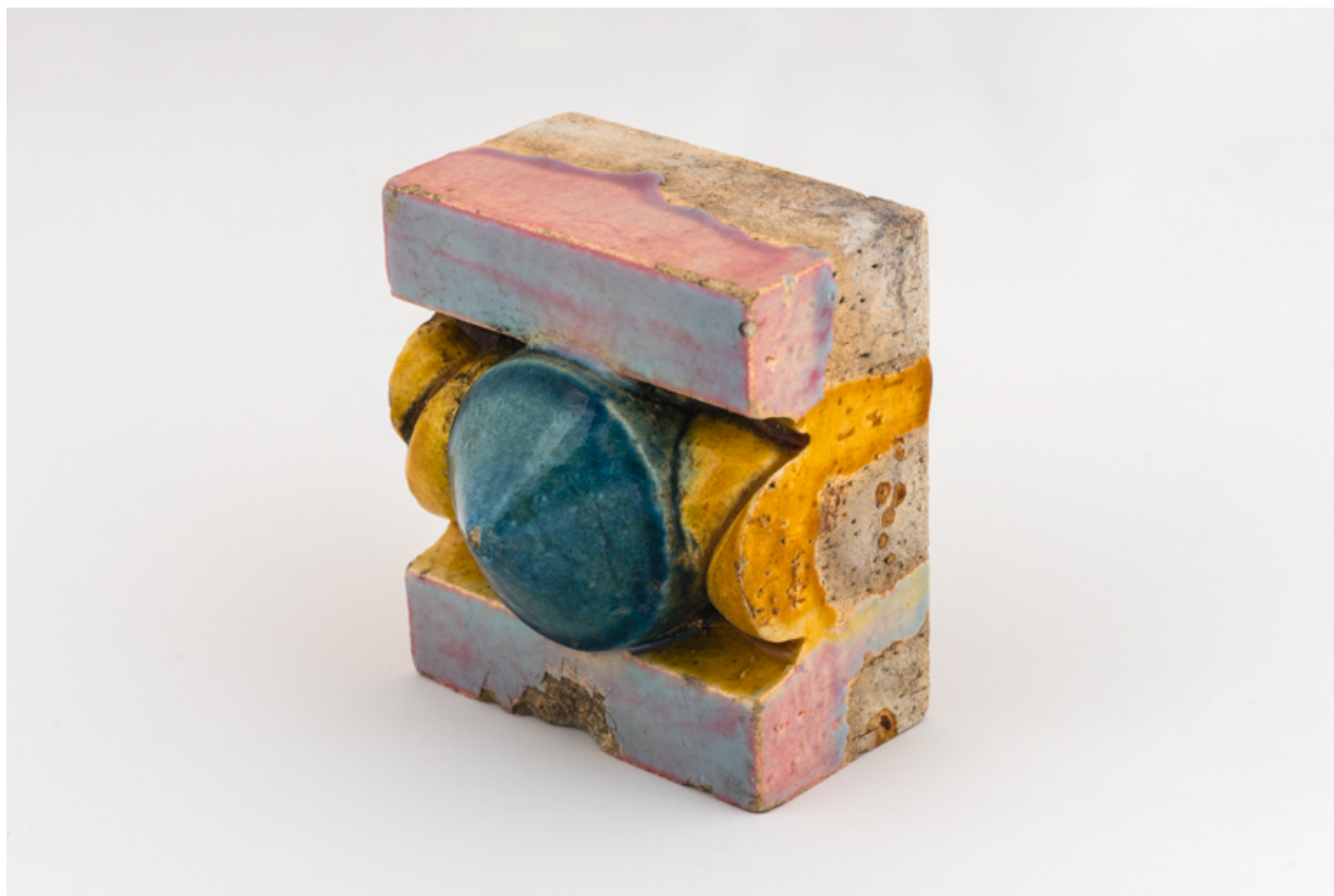
Décor de céramique de l'entablement, détail : élément de frise (corde et cabochon). 58, Pougues-les-Eaux, 130 avenue de Paris, lieudit : La Montjaie