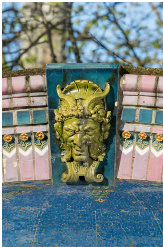
Décor de céramique de l'arc, détail : tête de faune et fleurettes.

58, Pougues-les-Eaux, 130 avenue de Paris, lieudit : La Montjaie