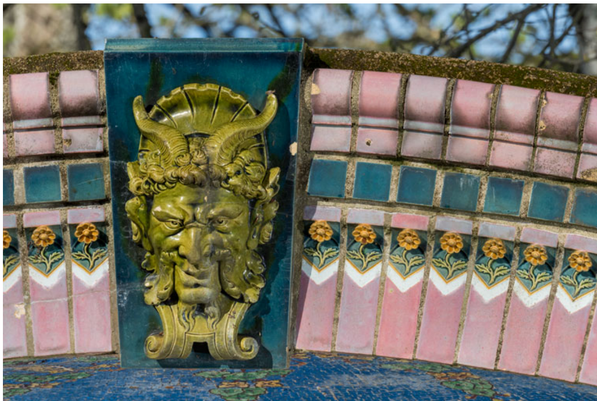
Décor de céramique de l'arc, détail : tête de faune et fleurettes.

58, Pougues-les-Eaux, 130 avenue de Paris, lieudit : La Montjaie