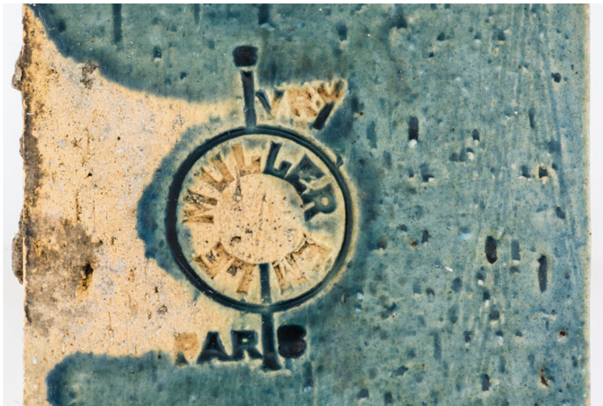
Décor de céramique de l'entablement, détail : marque d'Émile Müller à Ivry-Paris. 58, Pougues-les-Eaux, 130 avenue de Paris, lieudit : La Montjaie