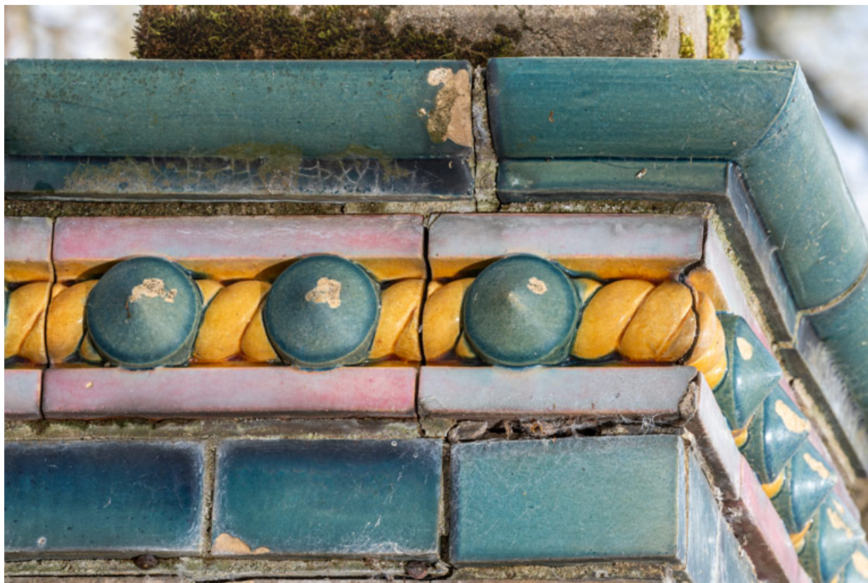
Décor de céramique de l'entablement, détail : frise (corde et cabochons).

58, Pougues-les-Eaux, 130 avenue de Paris, lieudit : La Montjaie