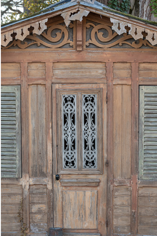
Décor en bois ajouré (lambrequins, pignon et vantail). 58, Saint-Honoré-les-Bains, lieudit : écart de La Montagne