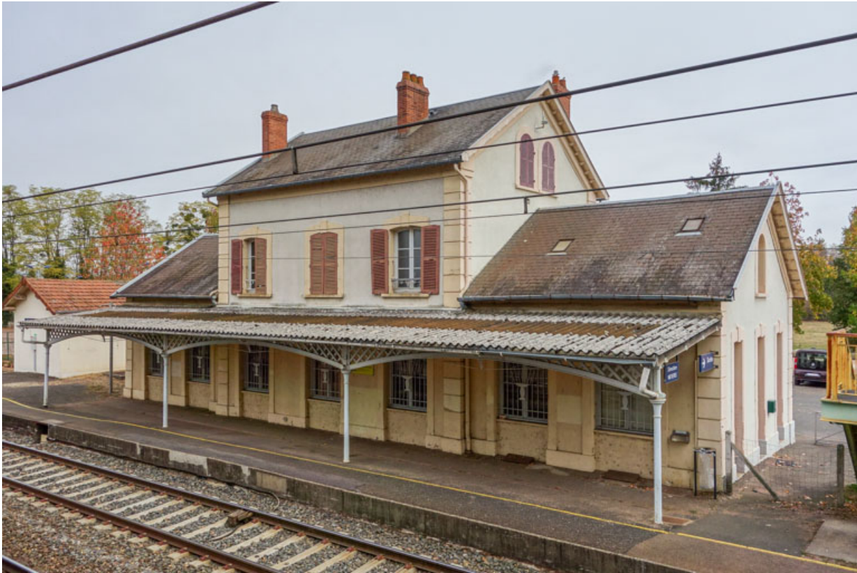
Façade, côté voie ferrée.