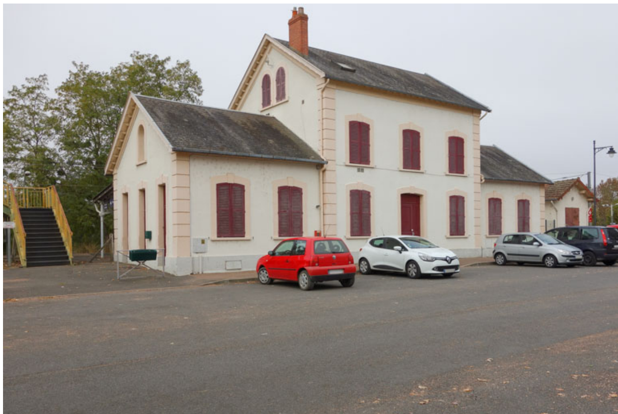
Façade, côté place.