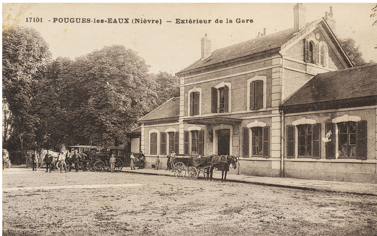
Façade, côté place.