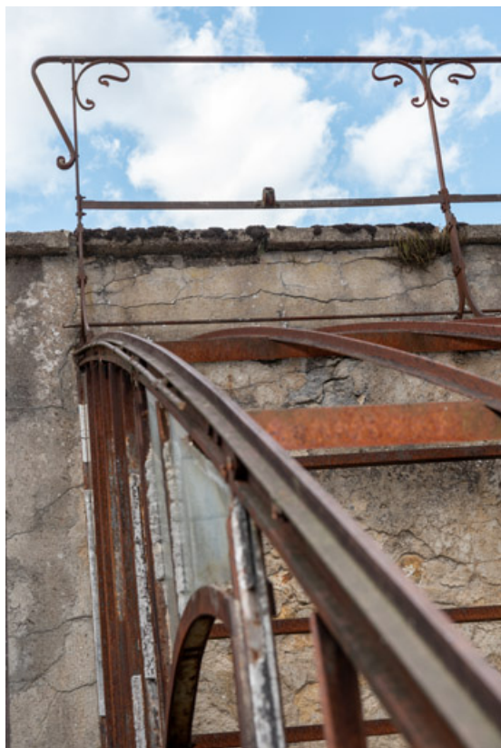
Détail de la structure métallique et du garde-corps de la galerie du mur.

58, Saint-Honoré-les-Bains, 8 avenue de Rémyilly