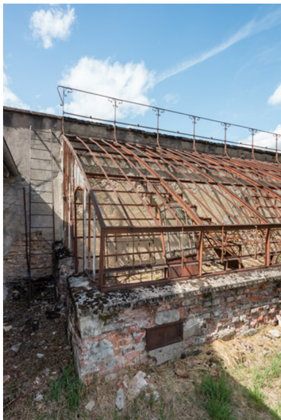
Détail de la structure métallique construite sur un muret en brique et adossée à un mur en calcaire.

58, Saint-Honoré-les-Bains, 8 avenue de Rémilly