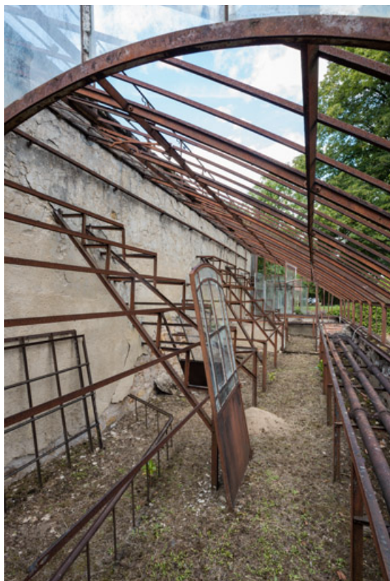
Détail des gradins destinés à porter les tablettes.

58, Saint-Honoré-les-Bains, 8 avenue de Rémilly