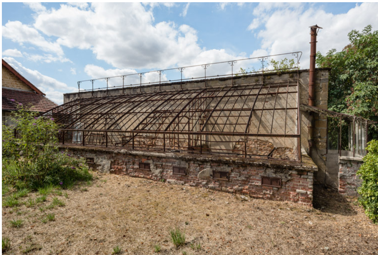
Vue d'ensemble depuis le sud-est avec l'emplacement de l'ancien système de chauffage à thermosiphon à droite. 58, Saint-Honoré-les-Bains, 8 avenue de Rémilly