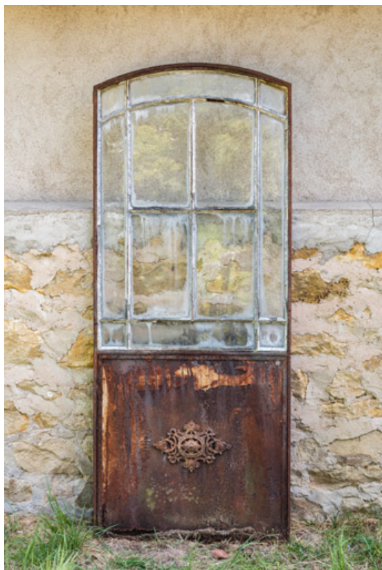
Porte vitrée avec panneau portant un médaillon décoratif ("Guillot-Pelletier Orléans"). 58, Saint-Honoré-les-Bains, 8 avenue de Rémilly