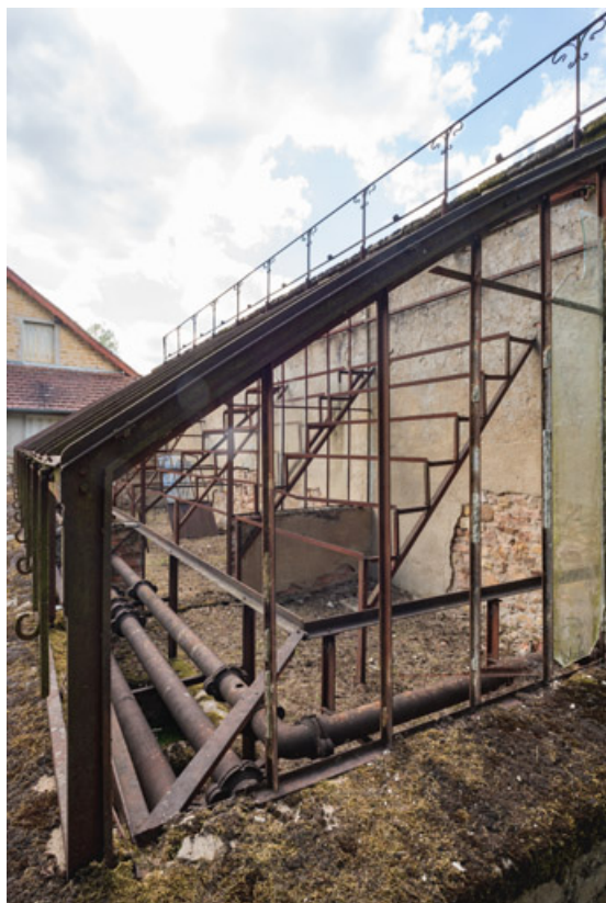
Détail des conduites (radiateurs) de l'ancien chauffage à thermosiphon.

58, Saint-Honoré-les-Bains, 8 avenue de Rémilly