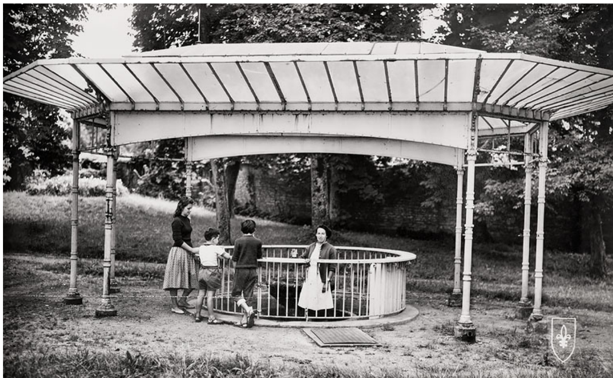
Buvette sur le site du Ponteau, premier état d'abandon (années 1970). 58, Pougues-les-Eaux avenue de Paris