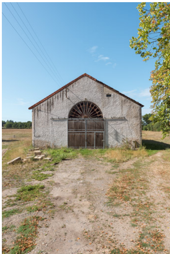
Élévation extérieure, vue de face.

58, Decize, 19 chemin de la Source, lieudit : Saint-Aré