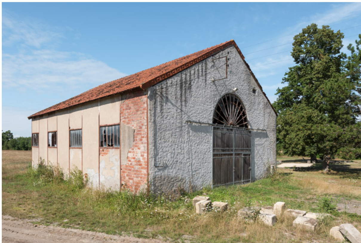
Élévation extérieure, vue de trois-quarts.

58, Decize, 19 chemin de la Source, lieudit : Saint-Aré