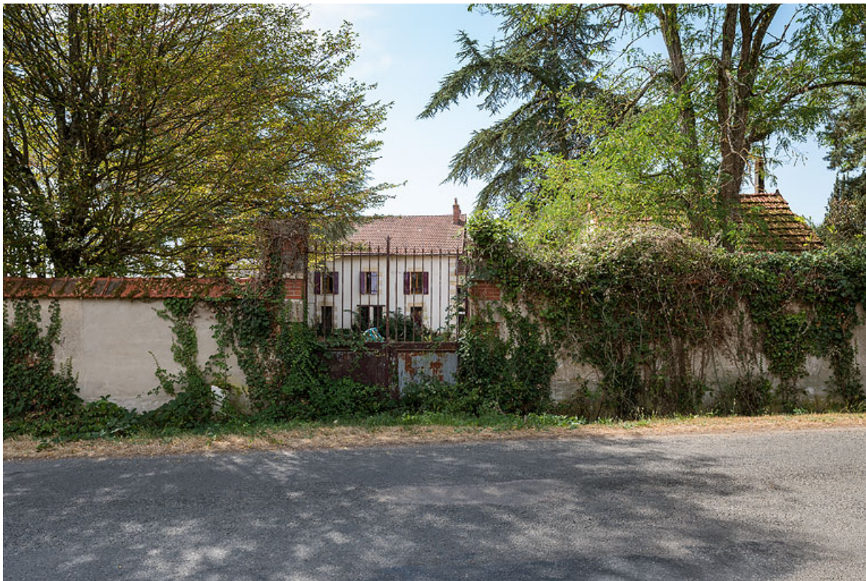
Portail d'entrée sur la rue des Fonts-Bouillants.

58, Saint-Parize-le-Châtel, 22 rue des Fonts-Bouillants