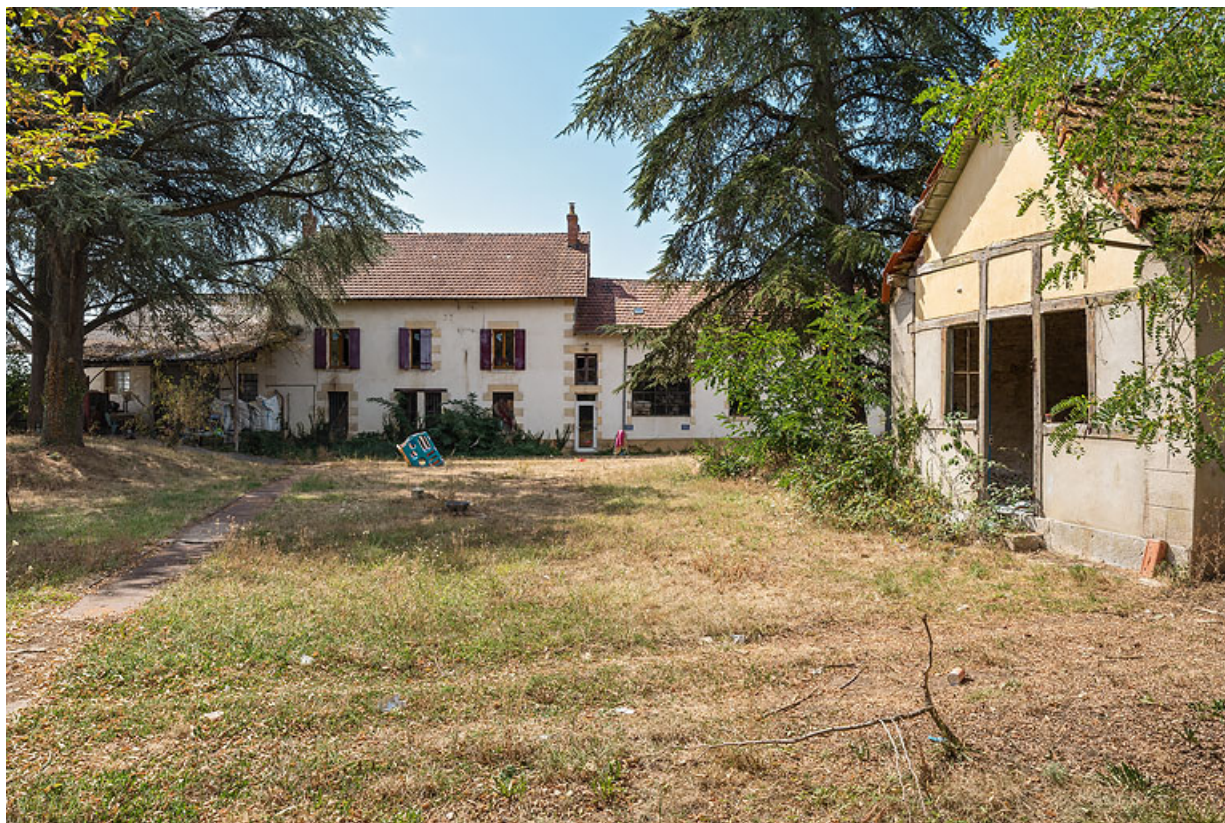
Usine de mise en bouteilles (au fond) et bureau (à droite).

58, Saint-Parize-le-Châtel, 22 rue des Fonts-Bouillants