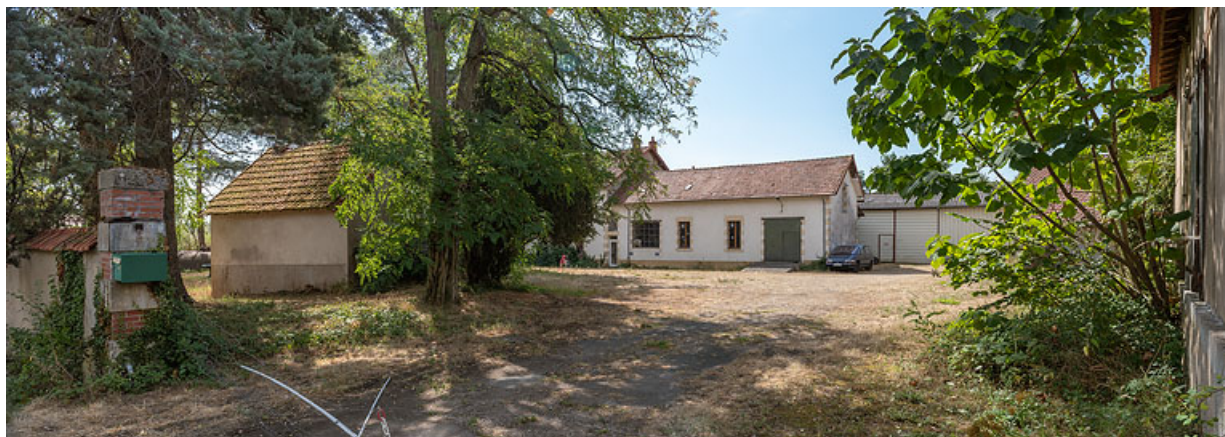
Usine de mise en bouteilles (au fond), bureau (à gauche) et dépendance (à droite). 58, Saint-Parize-le-Châtel, 22 rue des Fonts-Bouillants