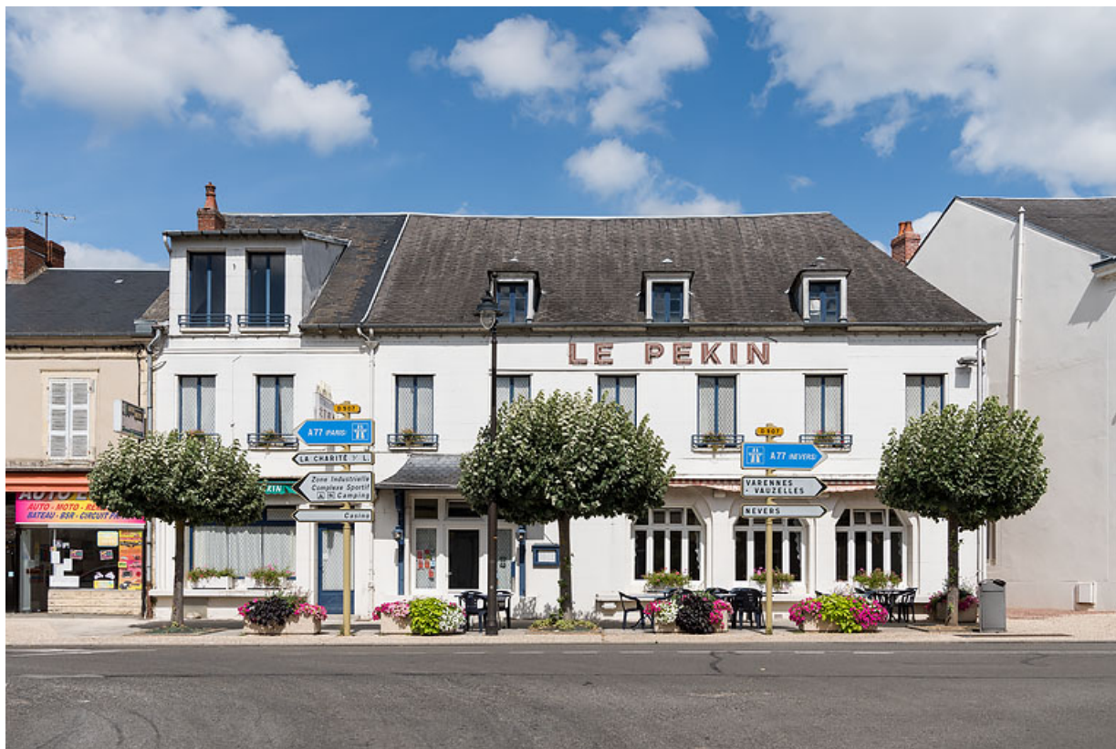
Vue ancienne, prise depuis l'avenue de Paris.

58, Pougues-les-Eaux, 39 avenue de Paris