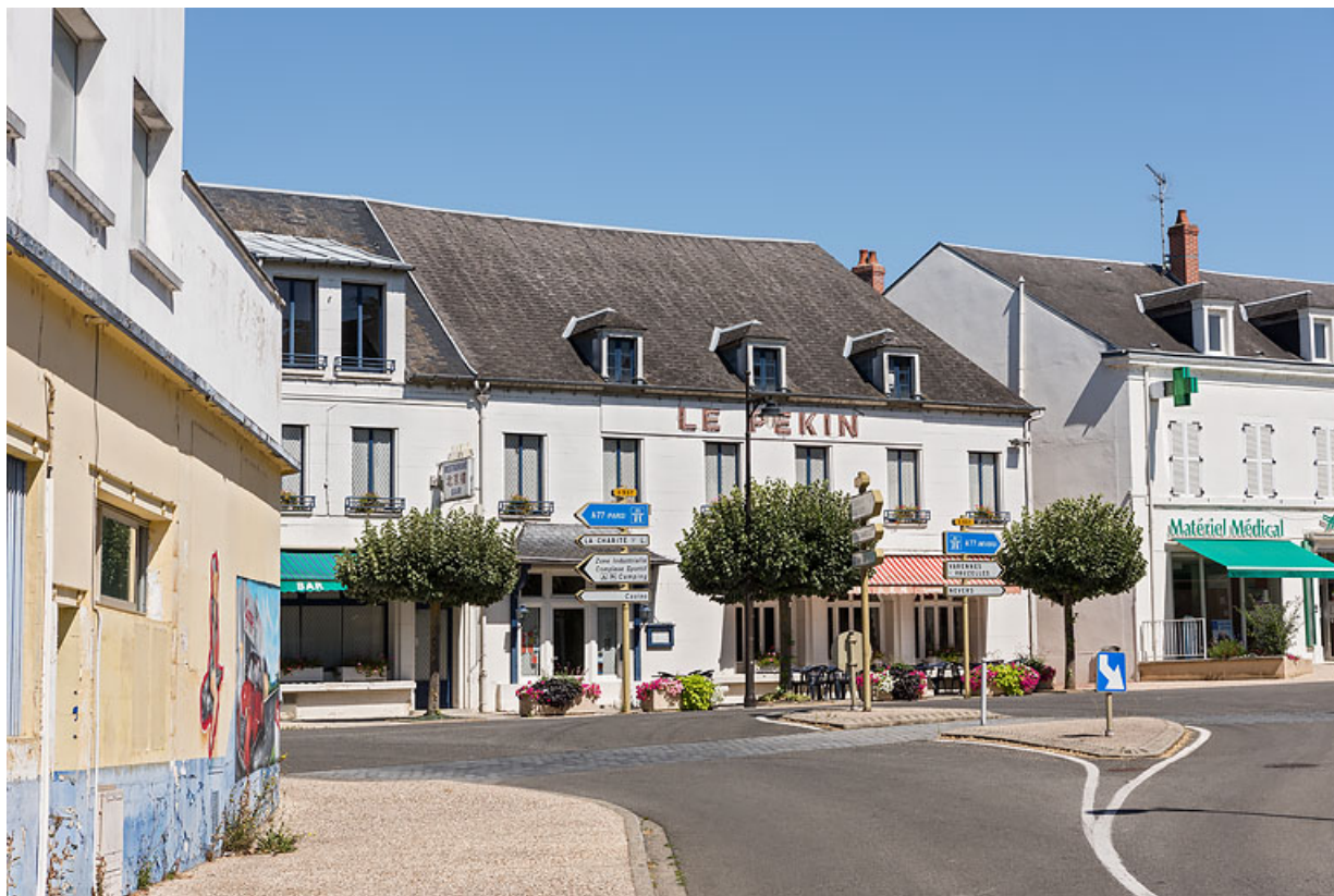
Vue actuelle, prise depuis l'avenue de la Gare.

58, Pougues-les-Eaux, 39 avenue de Paris