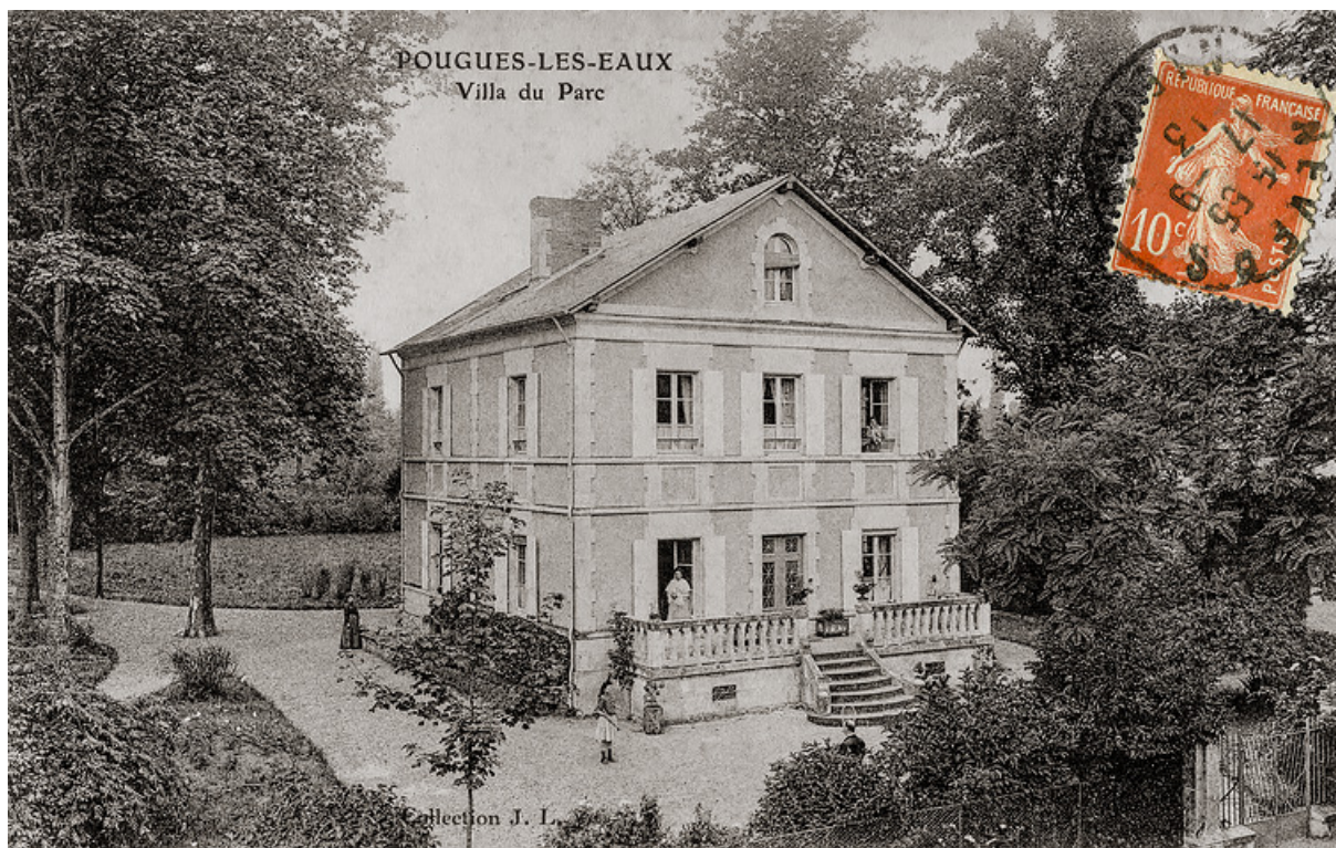
Vue ancienne (vers 1913) depuis l'établissement thermal.

58, Pougues-les-Eaux, 19 avenue de Conti