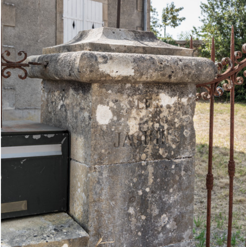
Pilier de portail portant l'inscription du nom de la villa.

58, Saint-Honoré-les-Bains, 40 avenue du Général d'Espeuilles