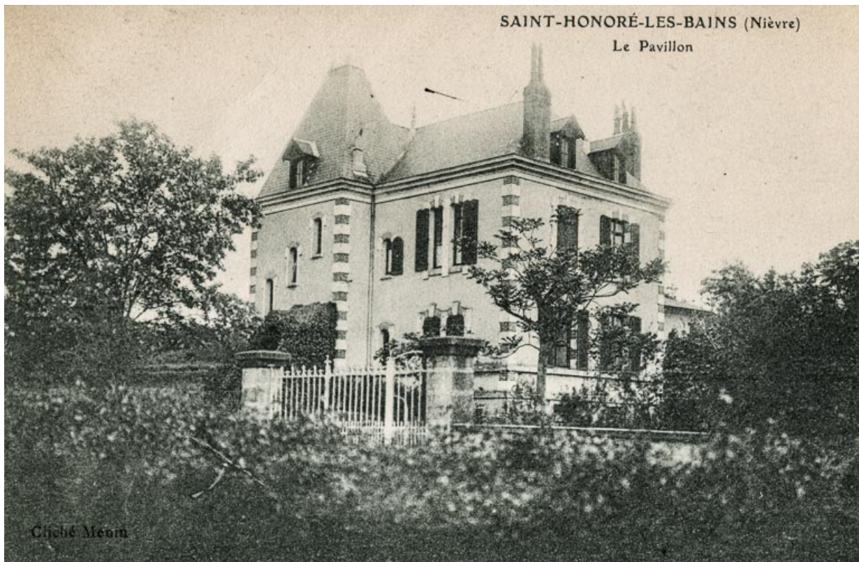
Élévation sur la rue, vue depuis l'Hôtel Bellevue.

58, Saint-Honoré-les-Bains, 6 rue Félicie Musset